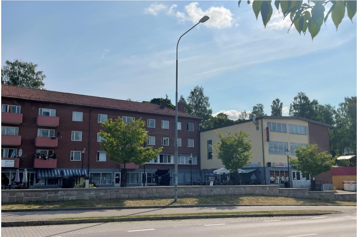
Centrumbebyggelse längs Köpingsvägen nedanför kyrkan.