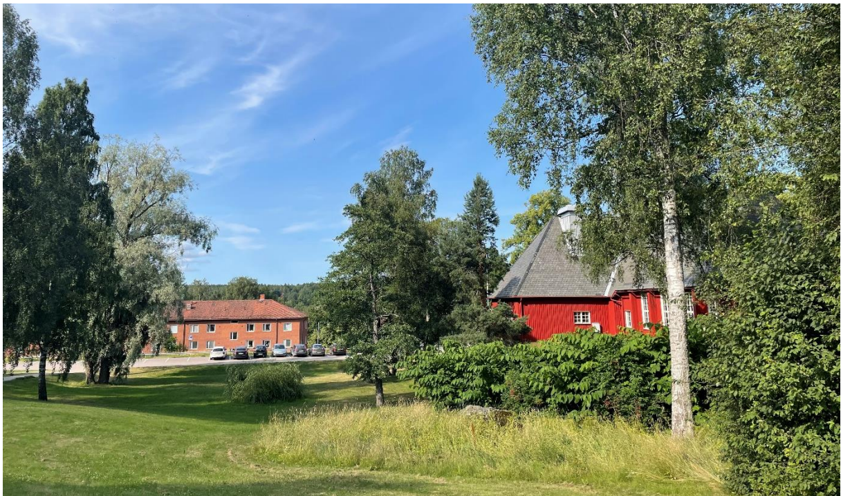
Grönyta kring kyrkan med kommunhuset i fonden.