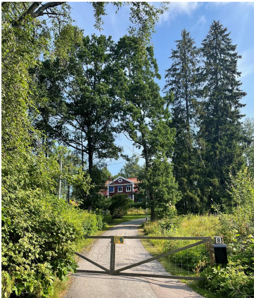
Kolsva före detta prästgård.