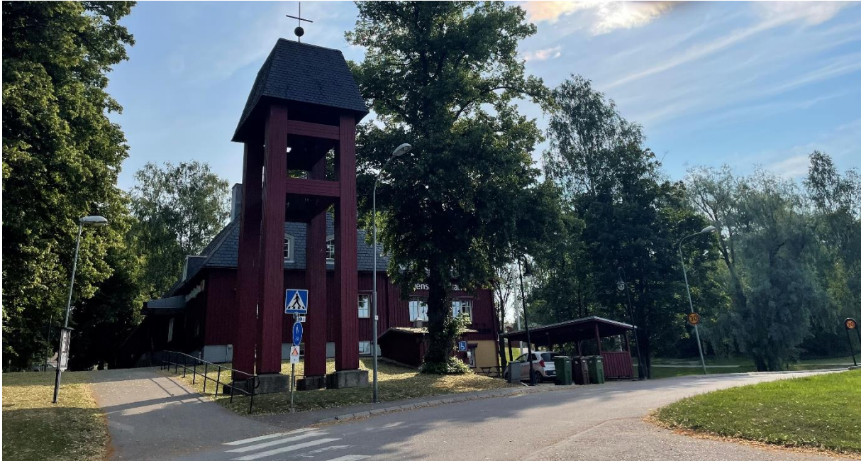
Kolsva brukskyrka och klockstapel.