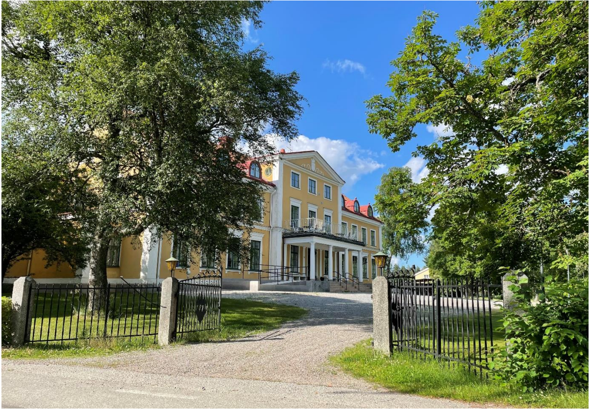
Tärna folkhögskolas huvudbyggnad.