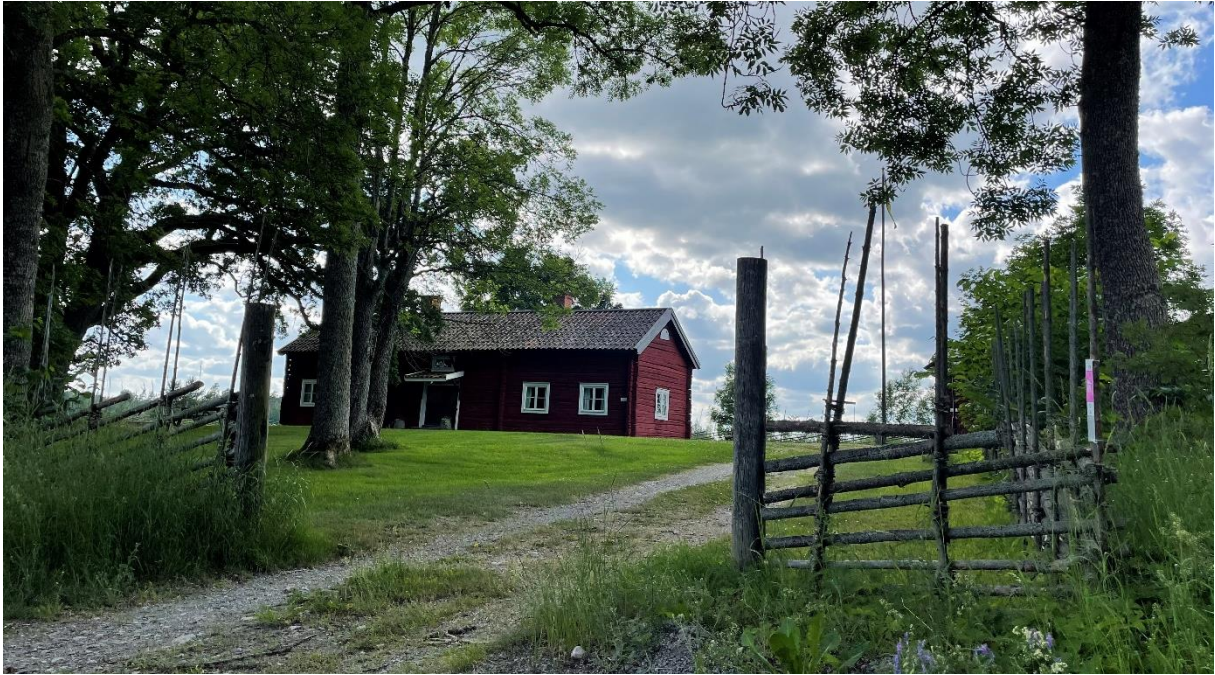
Infarten till hembydsgården.