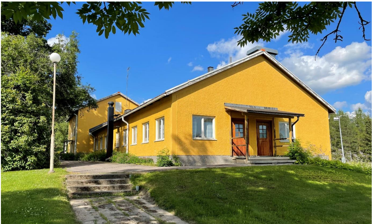
Före detta kommunkontor.