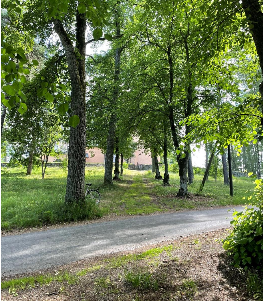
Väg/stig från före detta