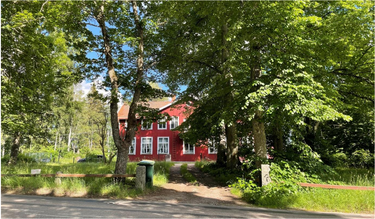
Före detta skolbyggnad.