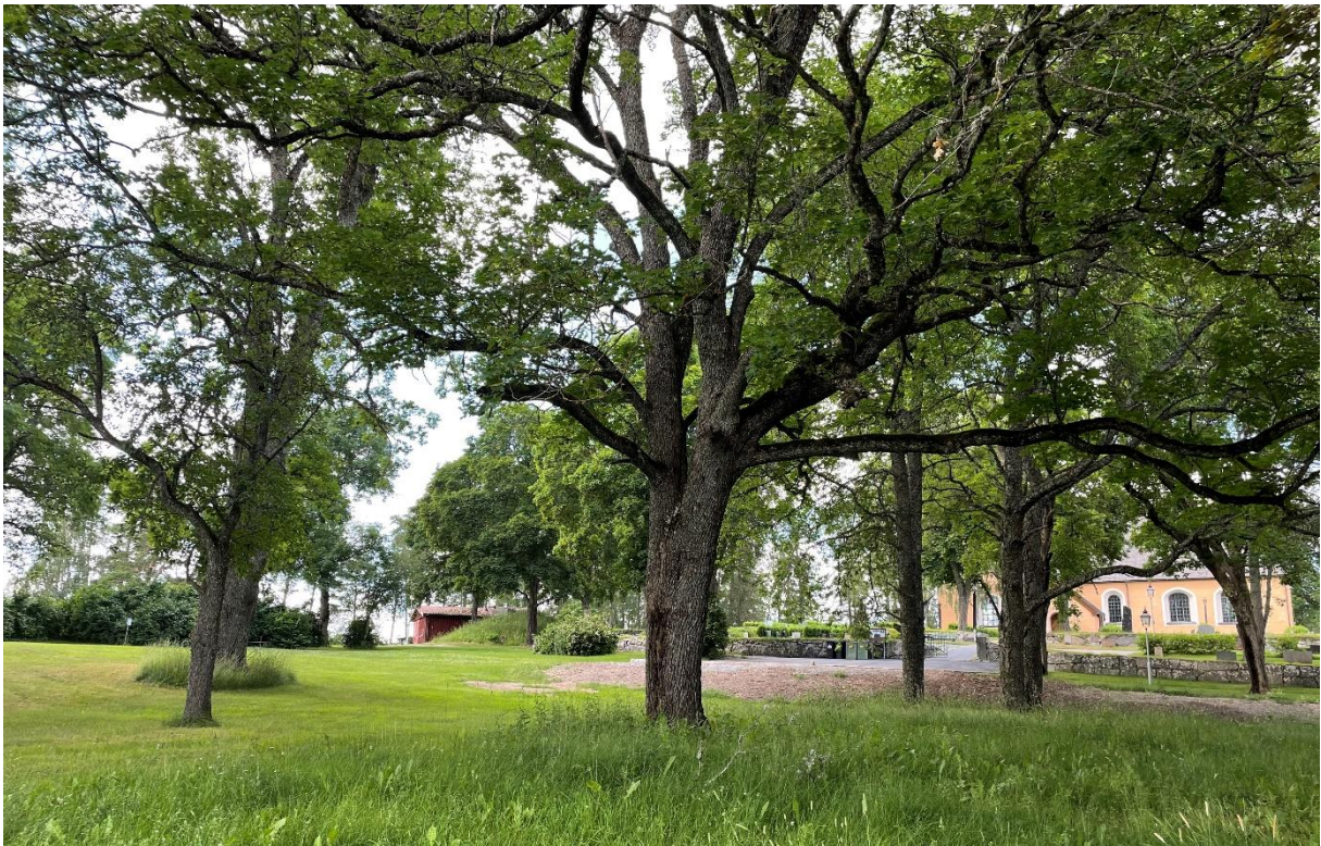
Öppen grön yta med ekar vid kyrka och hembygdsgård.