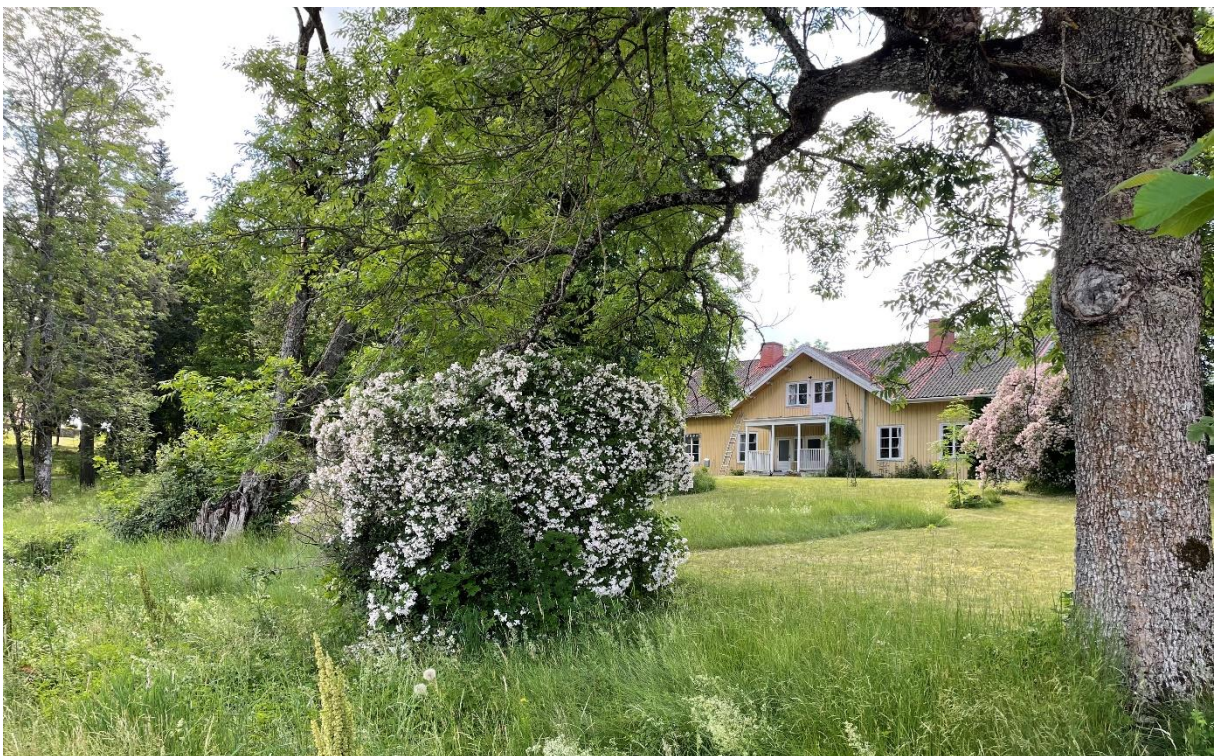
Före detta prästgård.