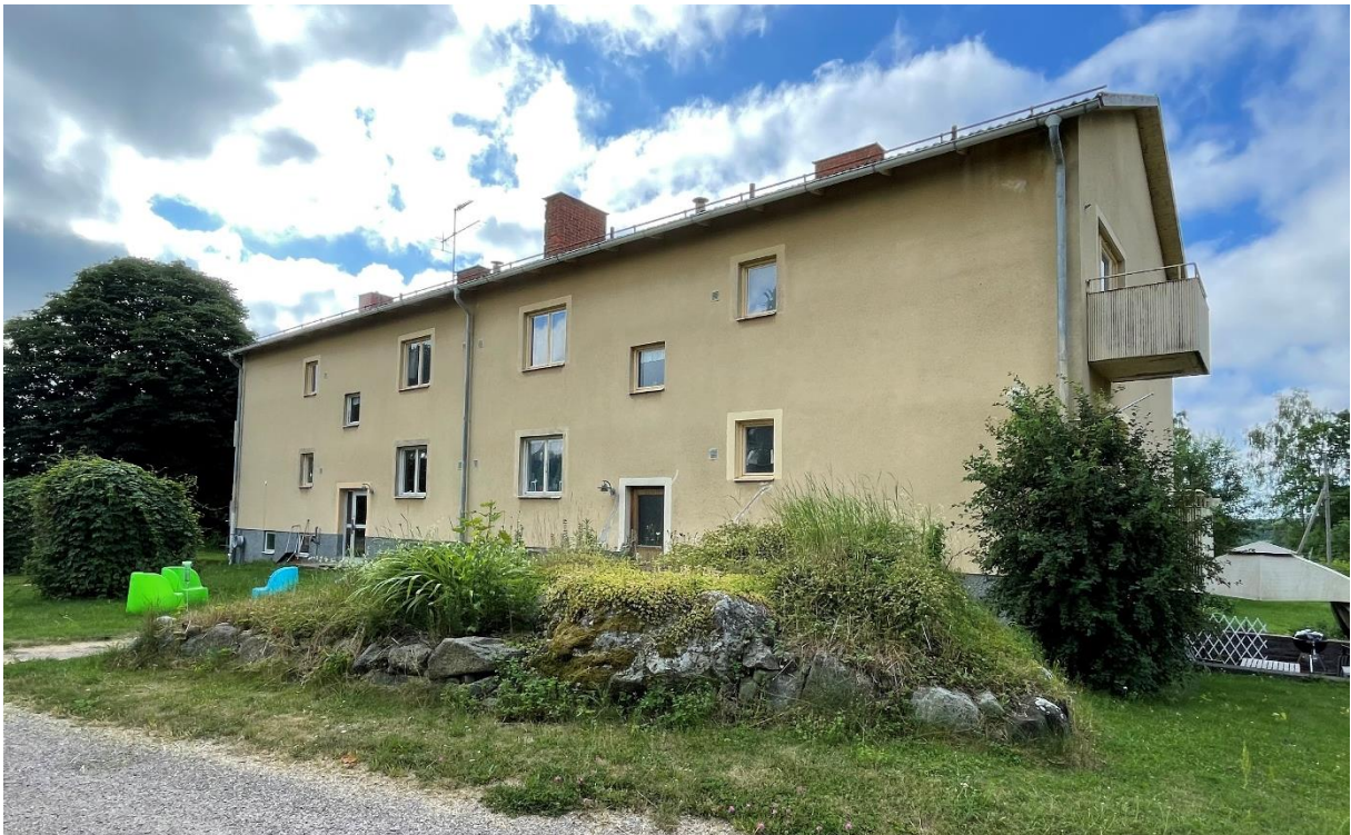
Före detta äldreboende i byn Ändesta norr om kyrkbyn.