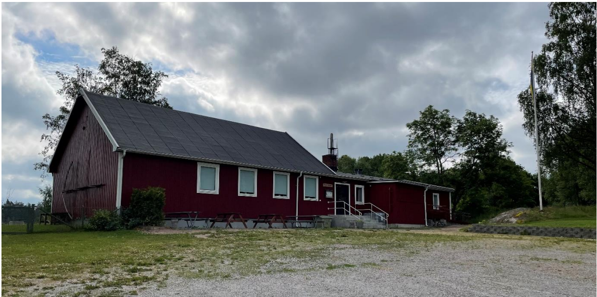
Hembygdsgården byggdes av två baracker som donerades till hembygdsföreningen i början av 1950-talet. På 1980-talet byggdes den ut för förskoleverksamhet.