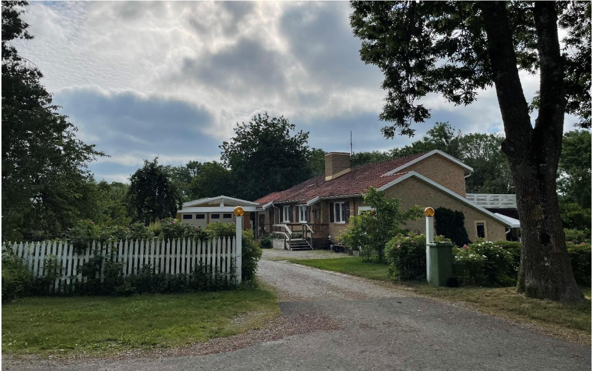
Före detta lärarbostad från 1954.