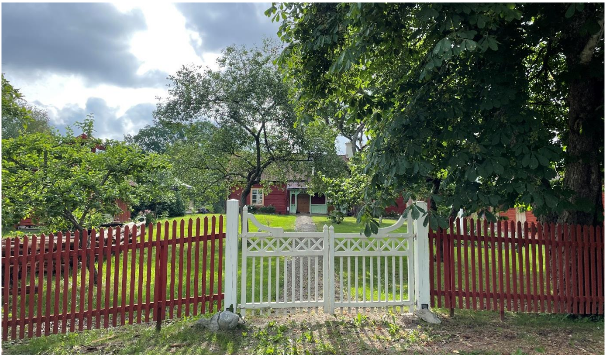
Före detta klockargård med grind mot kyrkan.