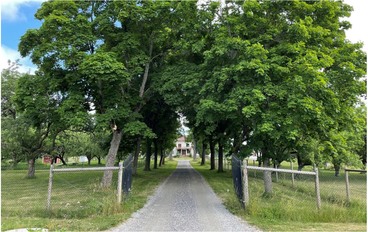
Allé till Kungsbyns mangårdsbyggnad.