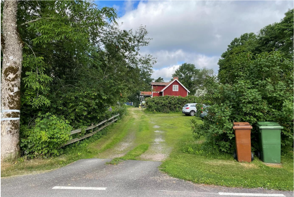
Söder om kyrkogården ligger ett rött hus som varit skol/kyrkvaktmästarbostad. Den var tidigare komministerbostad. Byggnaden uppfördes ursprungligen en våning och byggdes på med en våning på 1950-talet.