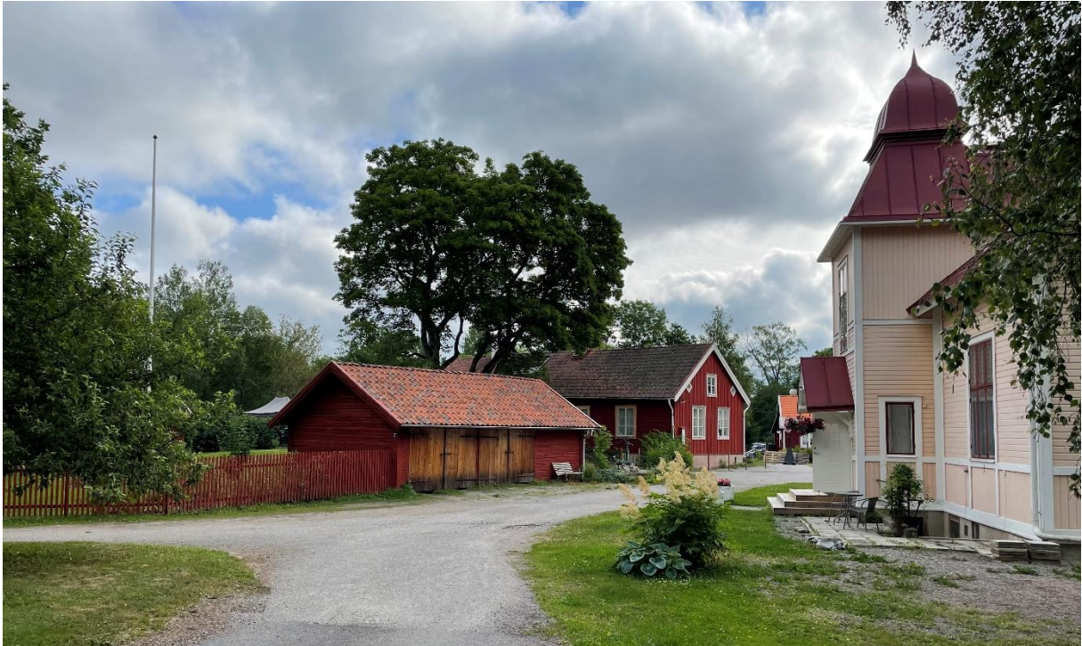
Före detta klockargård till vänster och före detta skolbyggnad till höger.