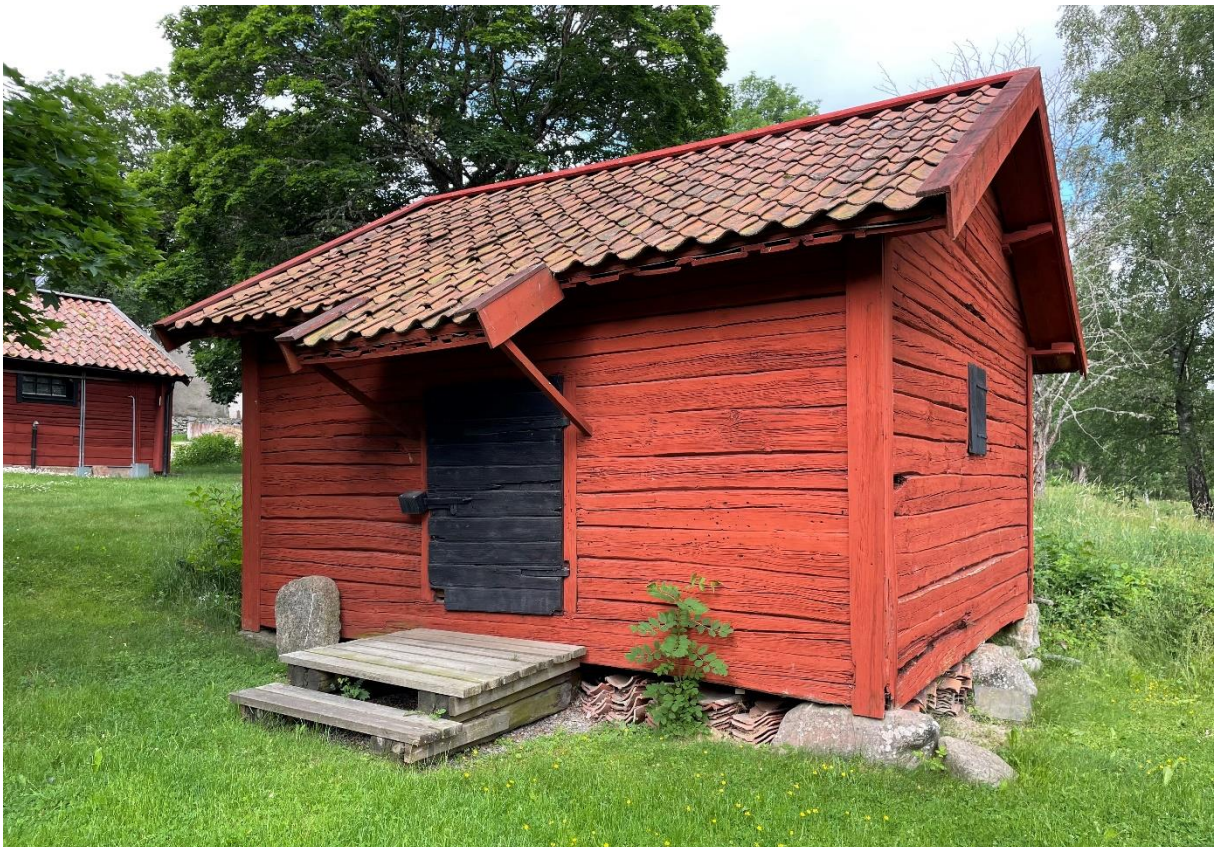
Bod (sädesmagasin och/eller tiondebod) bredvid kyrkan.