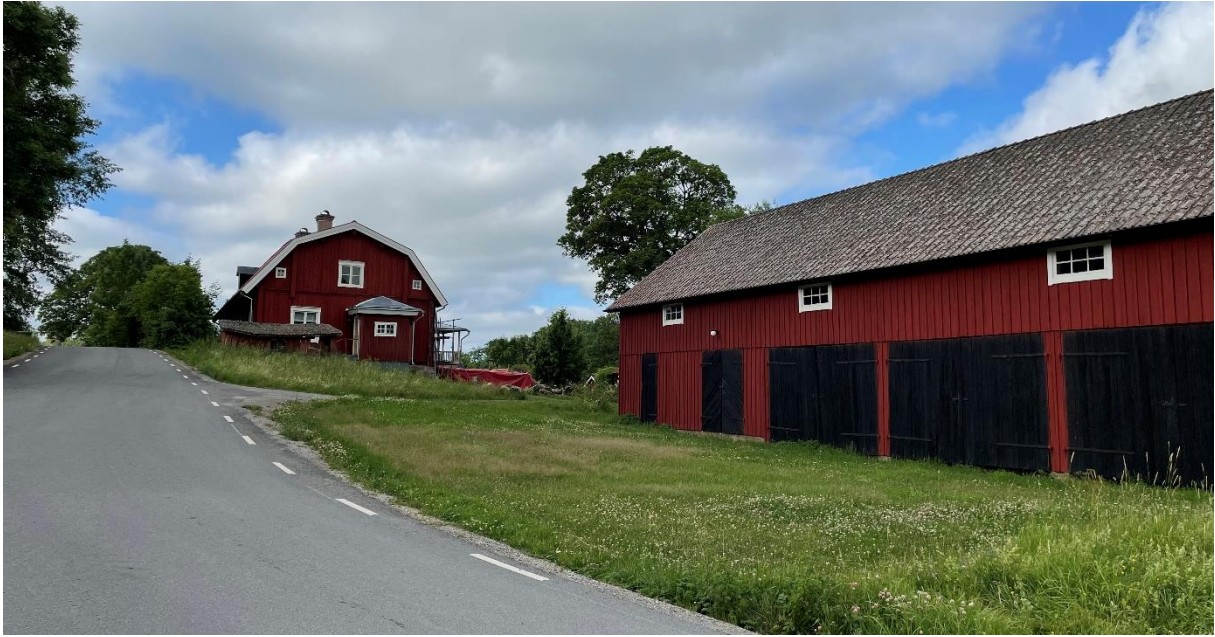
Prästgården som ligger ca en km norr om kyrkan. Bostadshuset uppfördes omkring 1800.