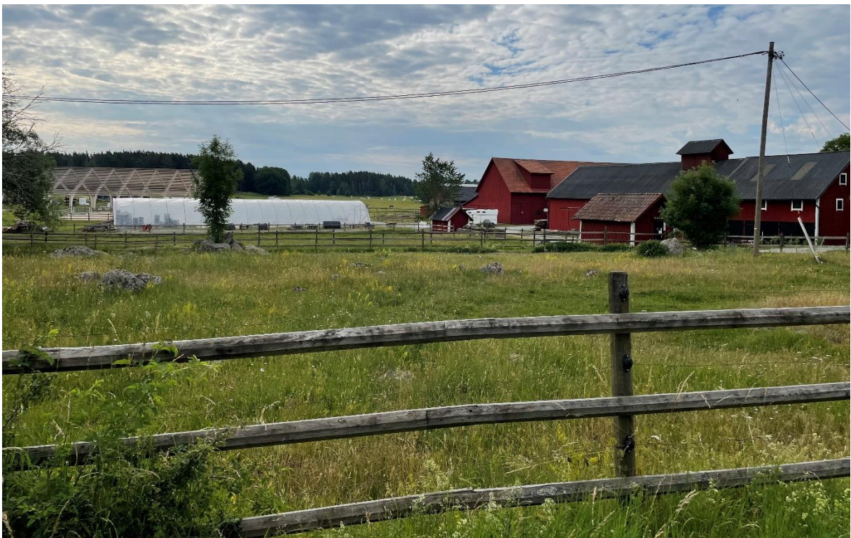
Vy mot Kärrbo före detta prästgårds ekonomibyggnader.