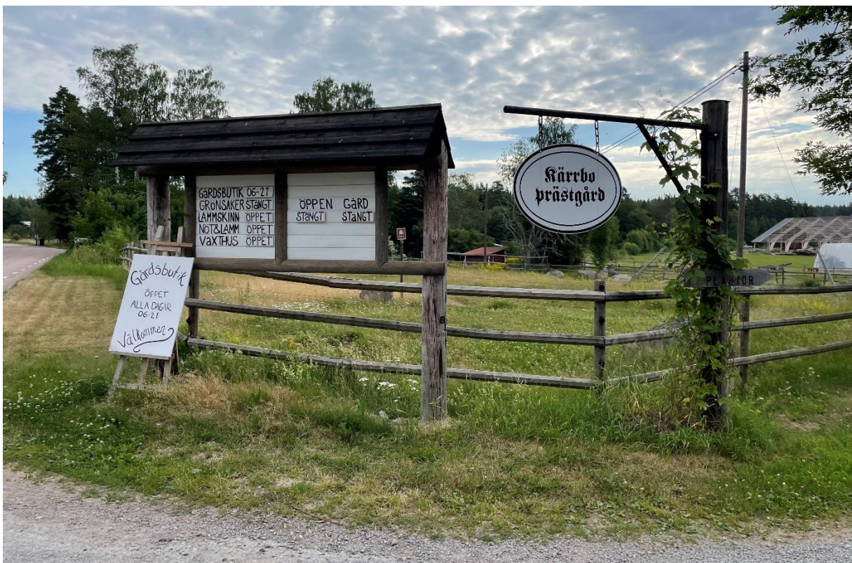
Kärbo före detta prästgård säljer växter och odlade produkter.