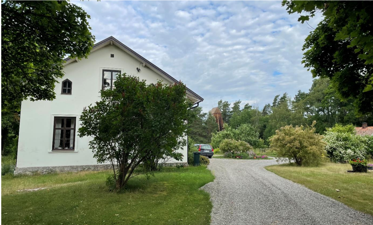
Före detta skolbyggnad med klockstapel i fonden.