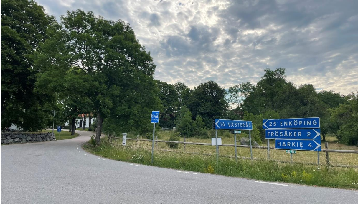
Vägskäl vid kyrkan med före detta skolbyggnad bakom träden.