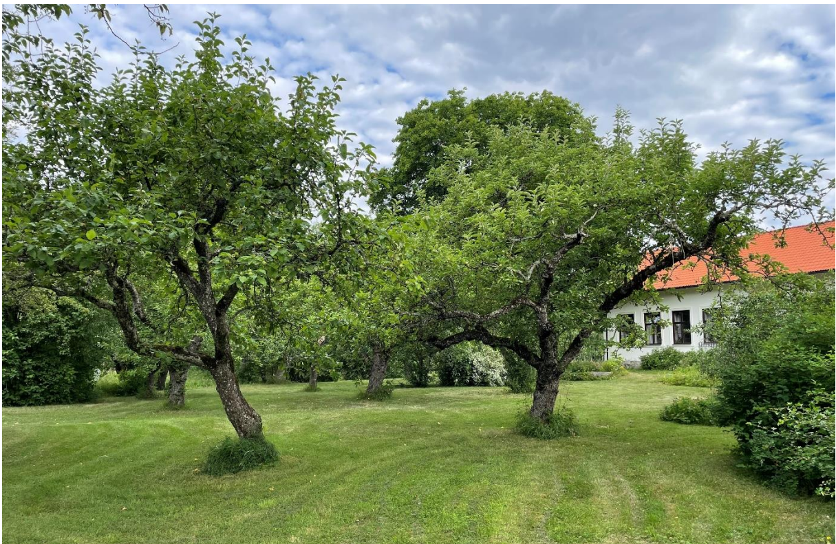
Före detta skolbyggnad med trädgård.