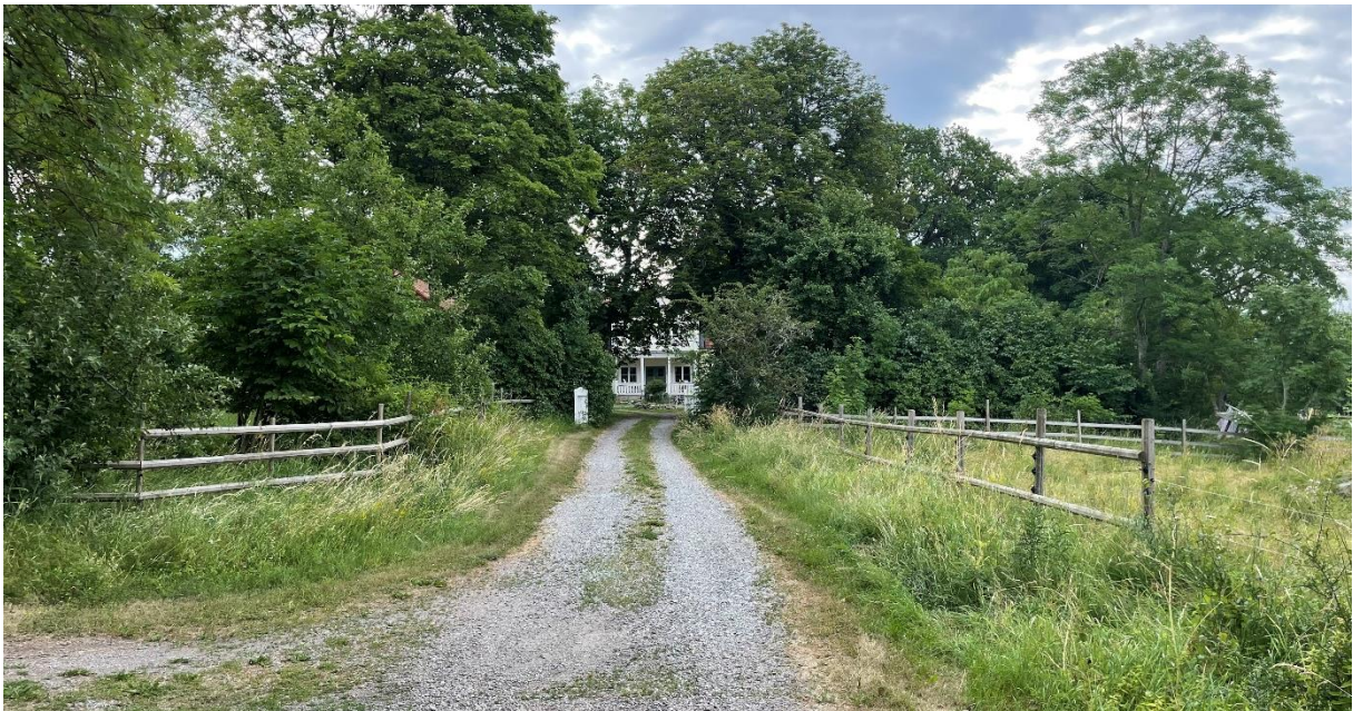
Före detta prästgårdens mangårdsbyggnad ligger privat bakom en trädriddå.