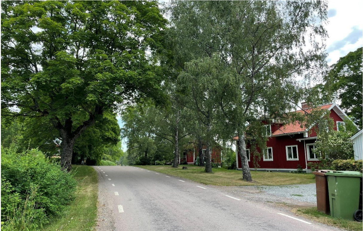
Väg genom kyrkbyn med före detta arrendatorsbostad till höger.