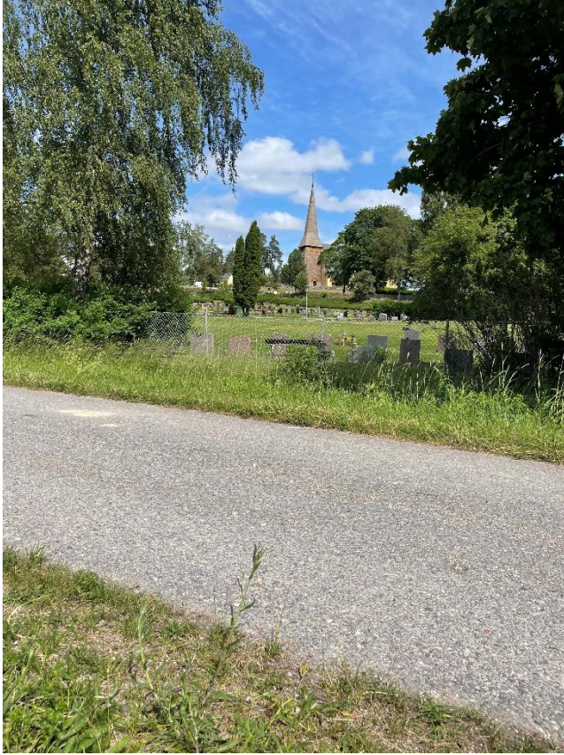
Vy från före detta järnvägsspår mot kyrkan.