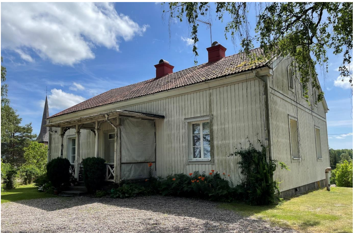
Före detta slöjd och lärarbostad. Senare församlingshem.