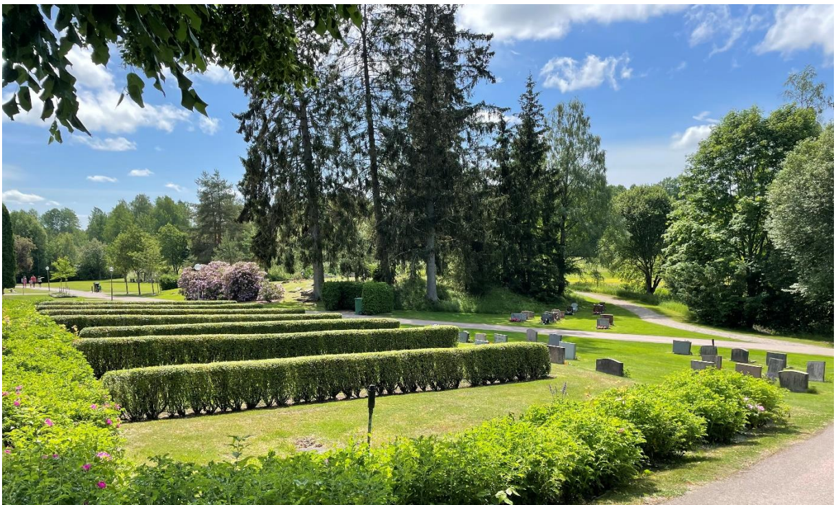
Delar av den yngre kyrkogården.