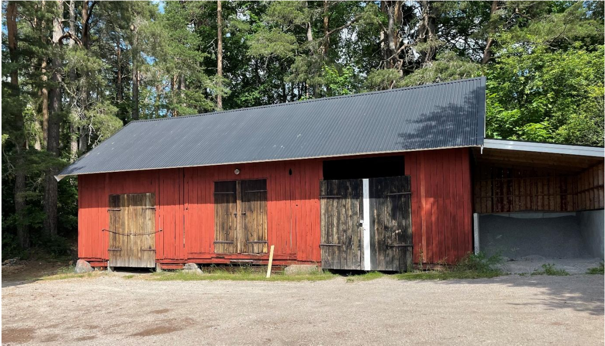
Klockarbostaden är riven men klockarladan står kvar.