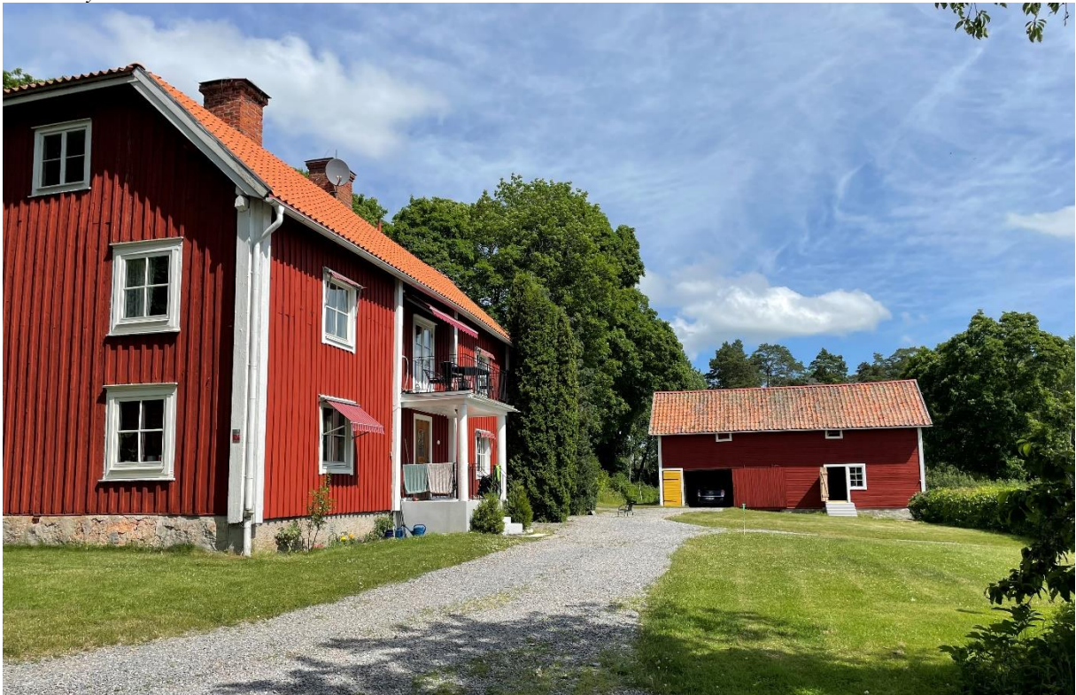
Malma före detta prästgård, senare arrendatorsbostad.