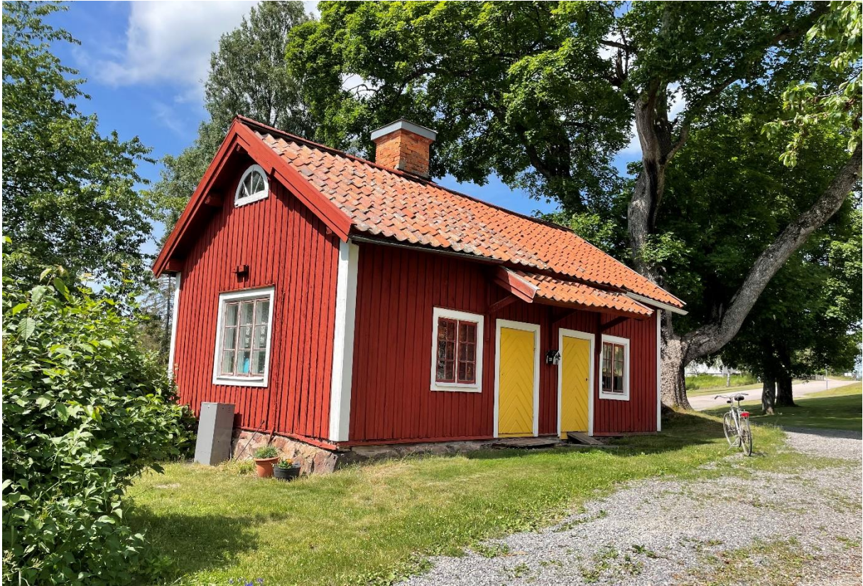
Före detta bagarstuga vid prästgården.