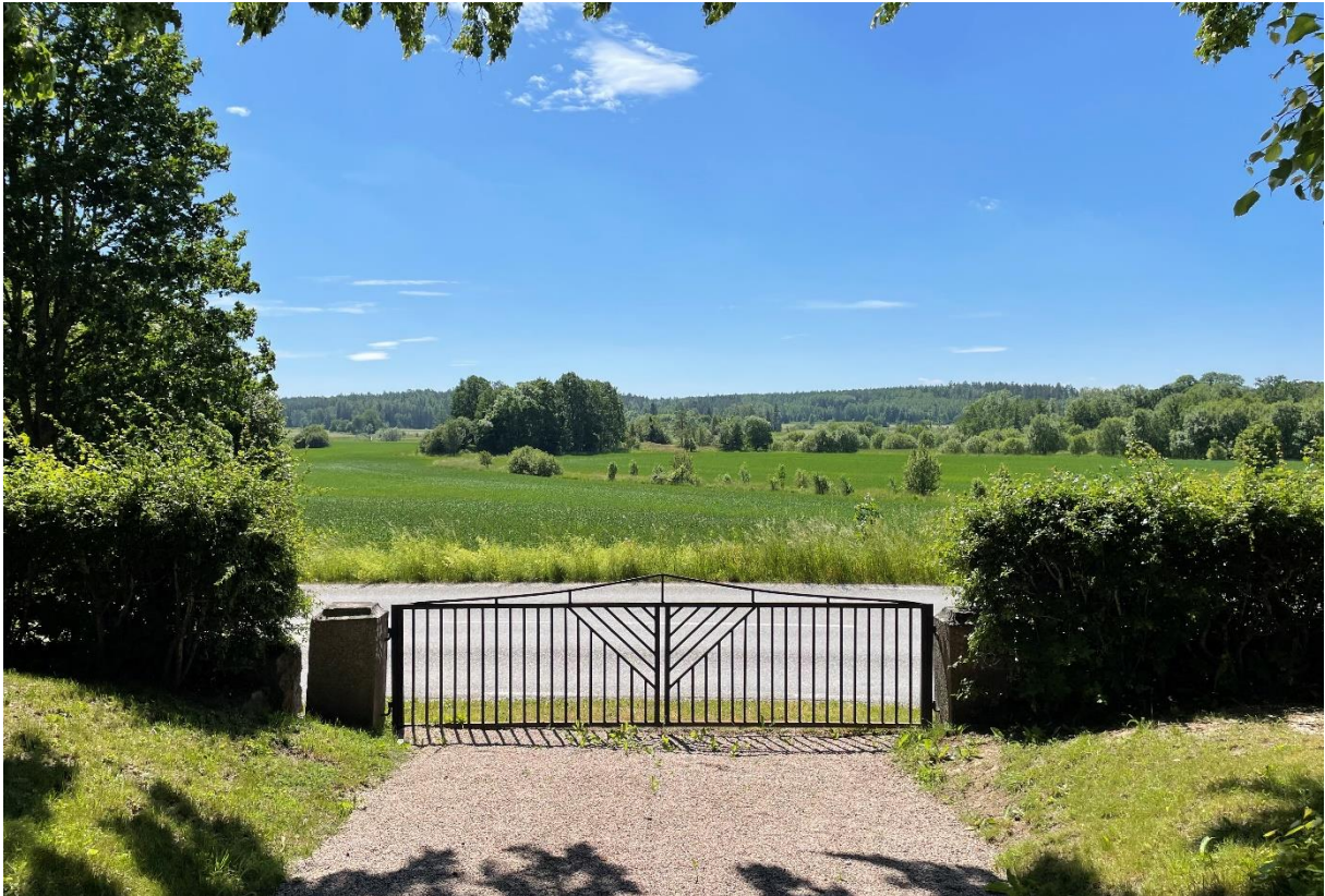
Vy från kyrkogården mot åkermarken söder om kyrkan och den möjliga tidigare tingsplatsen Åkershäll.