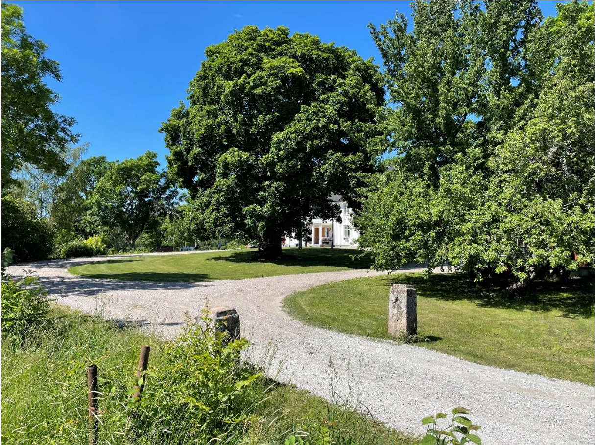
Före detta mangårdsbyggnad, idag privatbostad.