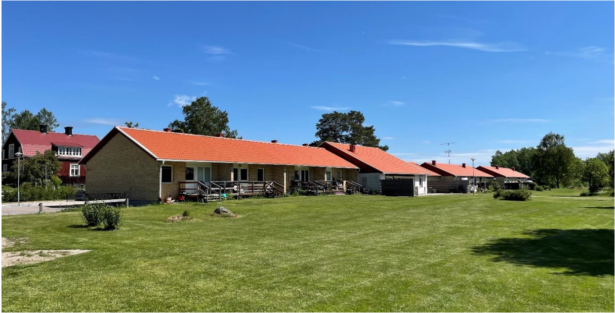
Pensionärlänga norr om kyrkan och skolorna.