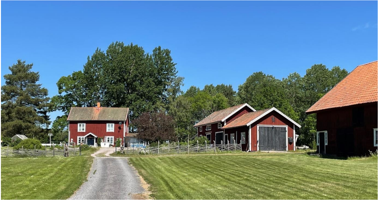
Komministergård öster om kyrkan.