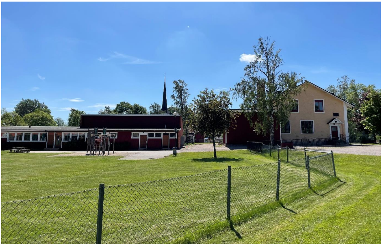
Medåkers moderna skola till vänster byggdes 1963.