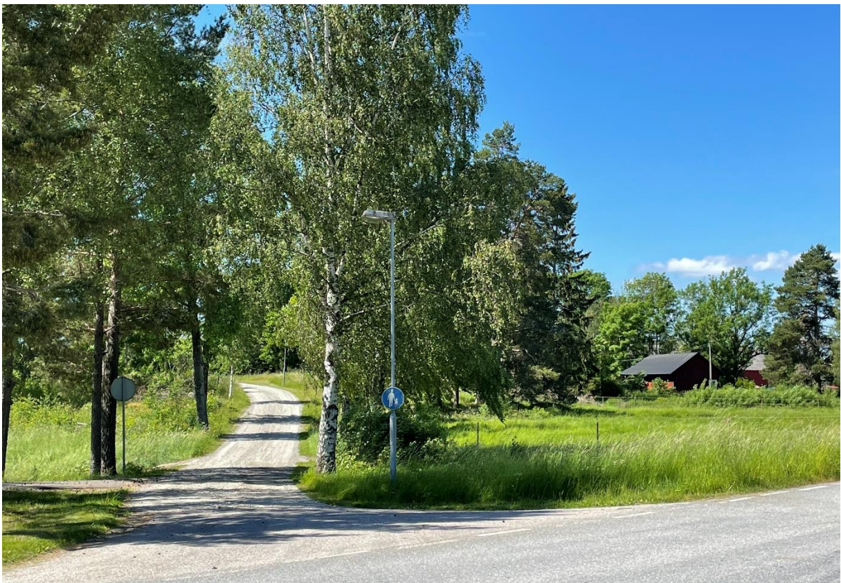
Väg in till före detta prästgården.