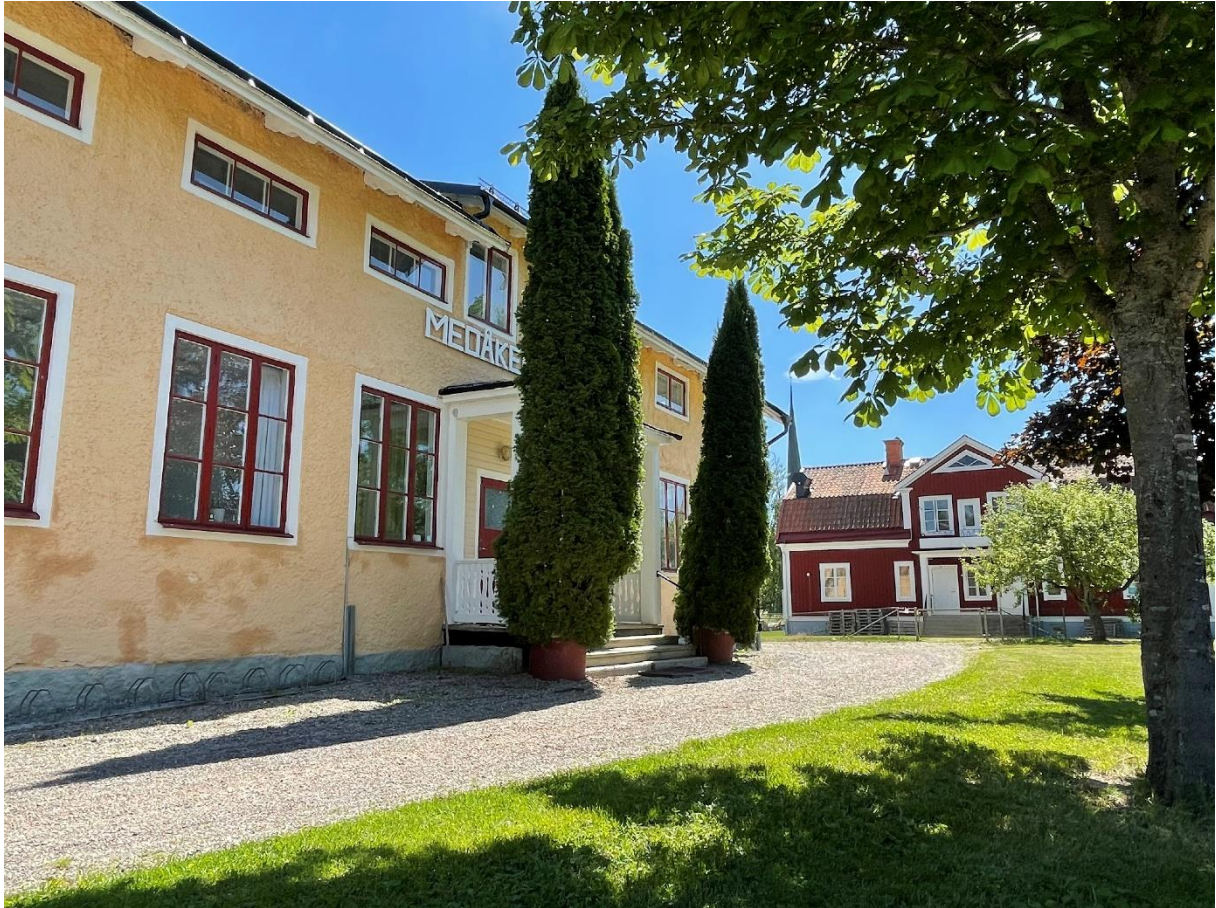
De bågge äldre skolbyggnaderna.