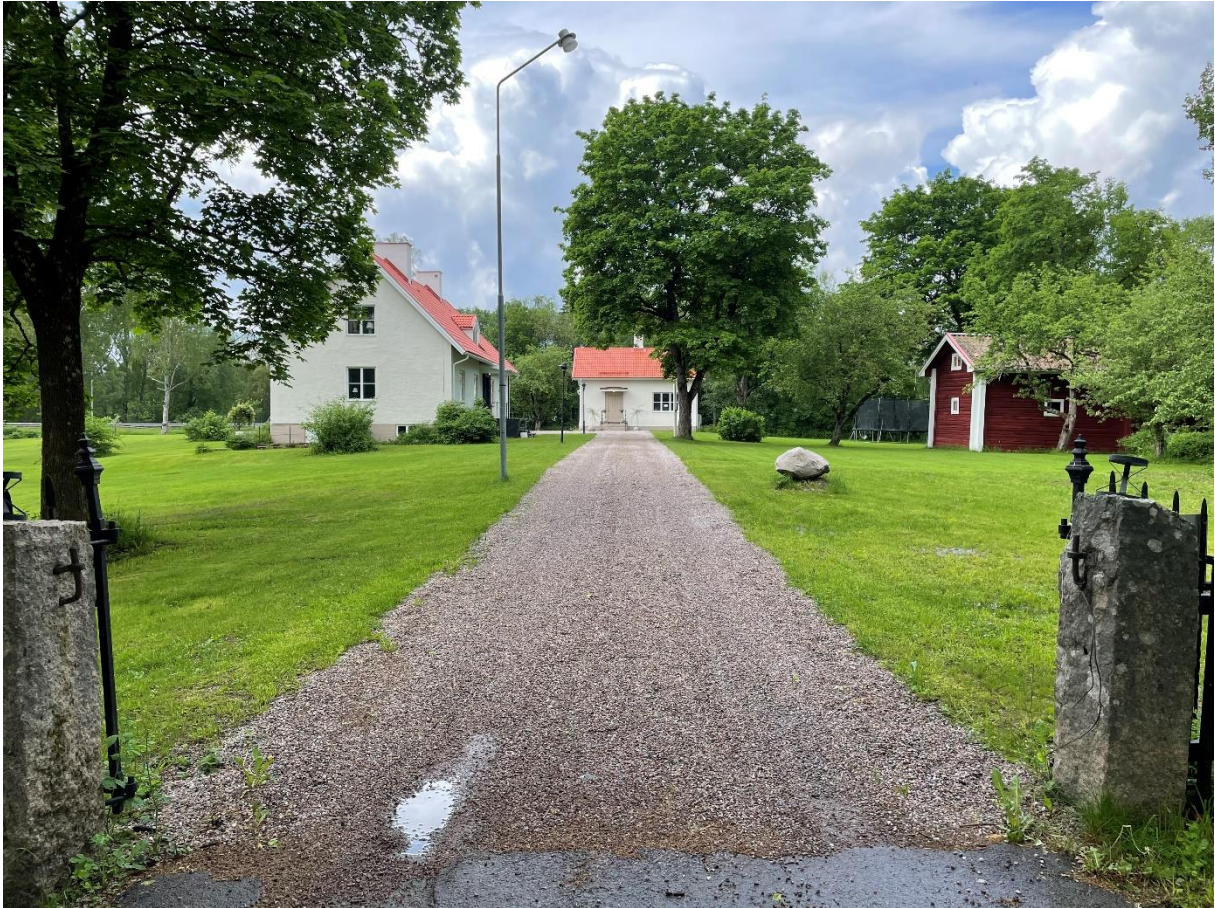
Före detta Norbergs prästgård.