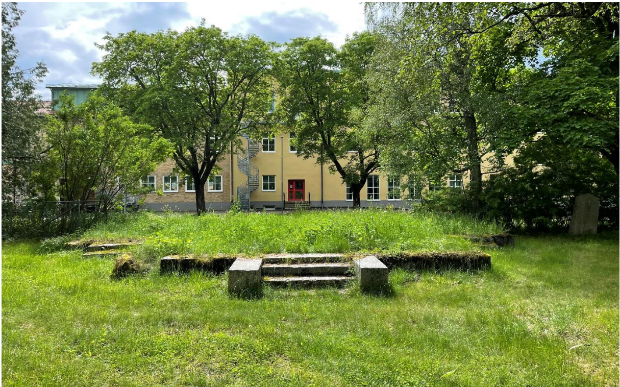
Rester av kapell på kyrkogården.