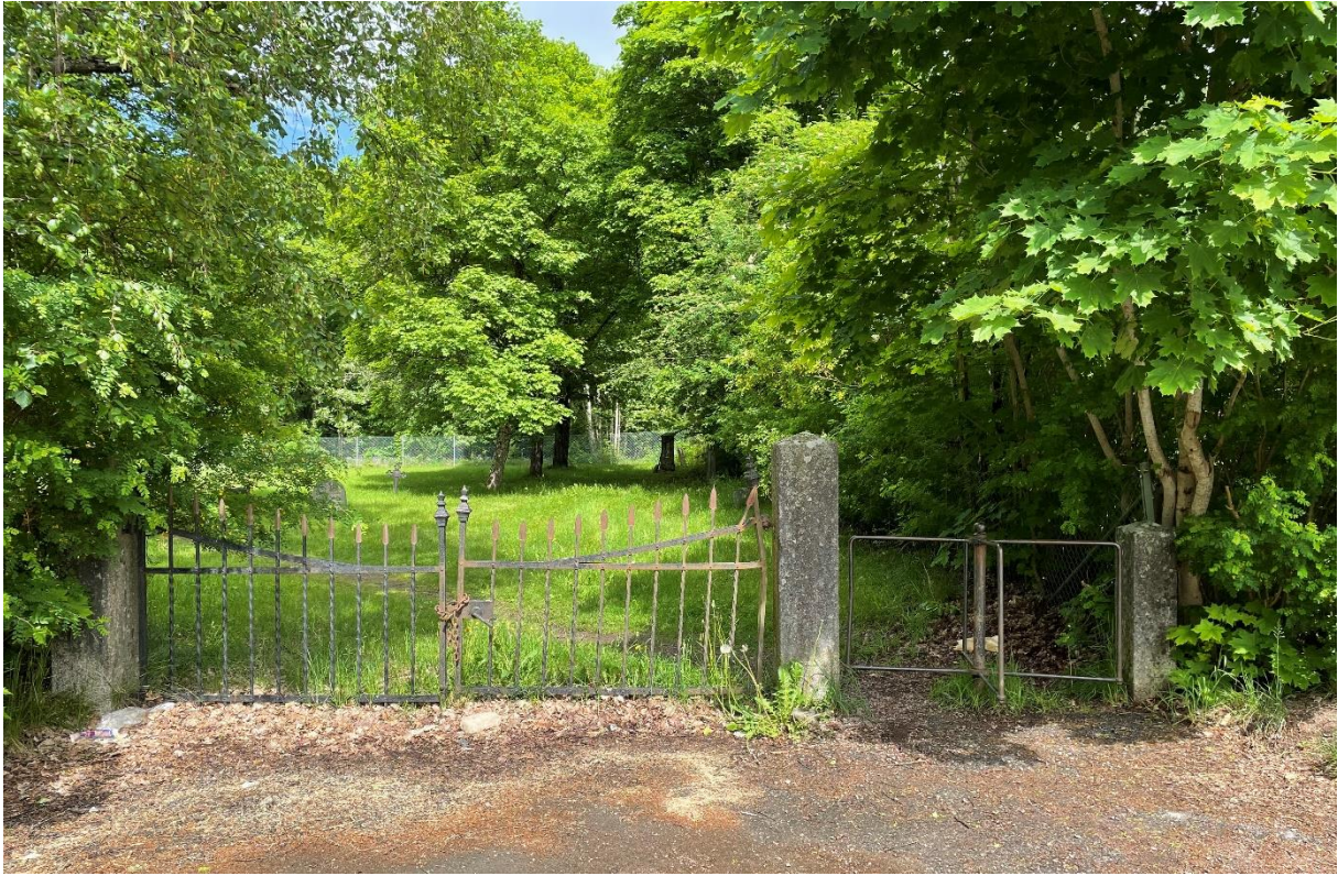
Entré till den äldre kyrkogården från 1800-talets mitt.