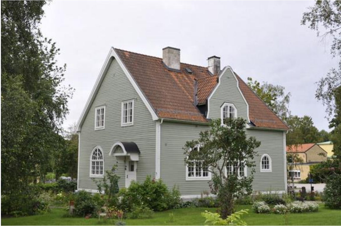
Det äldre församlingshemmet.