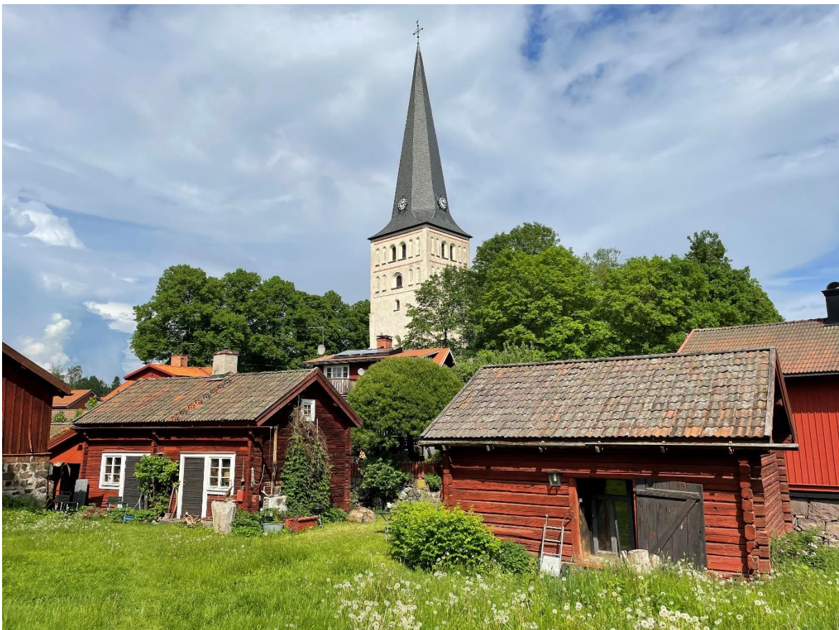
Norbergs kyrka med äldre småskalig bebyggelse i förgrunden.