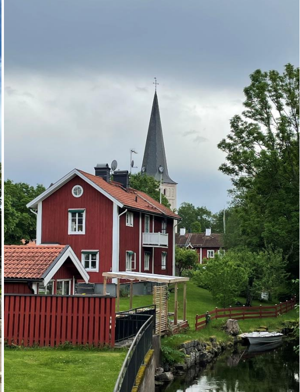
Före detta klockargården vid Norbergsån med Norberg kyrka i bakgrunden.