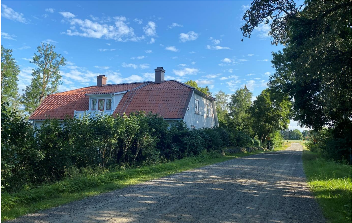
Romfartuna före detta prästgård.