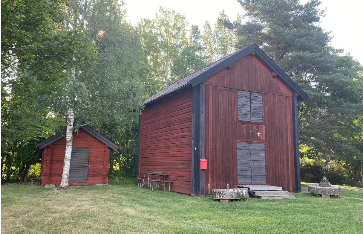
Visthusbod flyttad från prästgården upp till kyrkbacken.