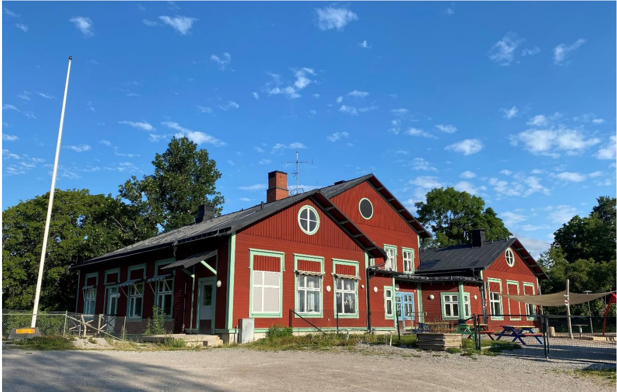
Romfartuna skola, idag förskola.