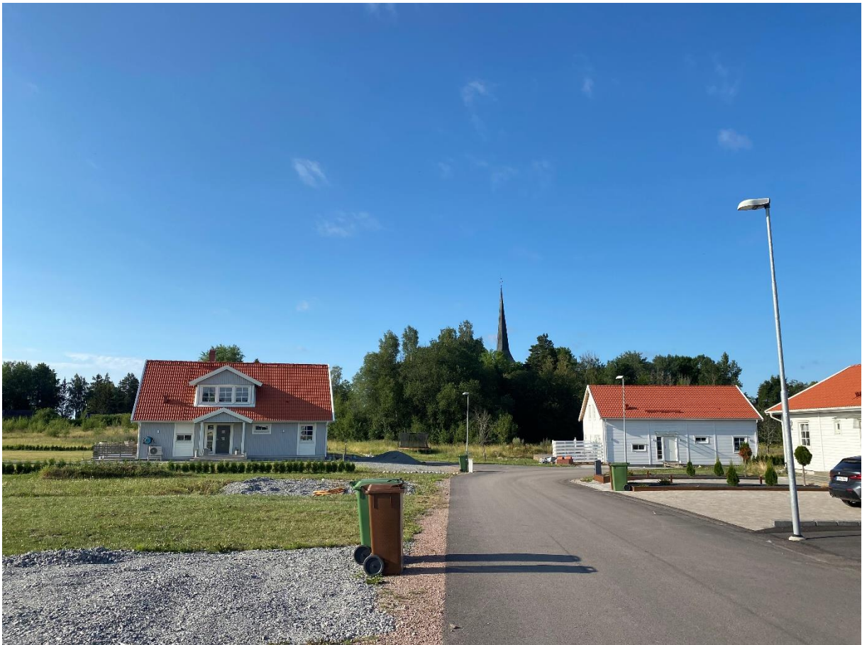
Nybyggt villaområde norr om kyrkbyn.