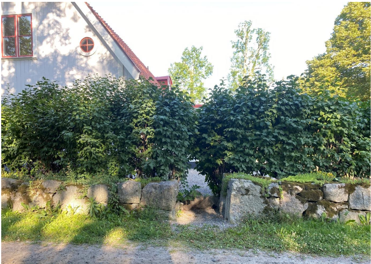
Romfartuna före detta prästgårds gavel med oxögon.