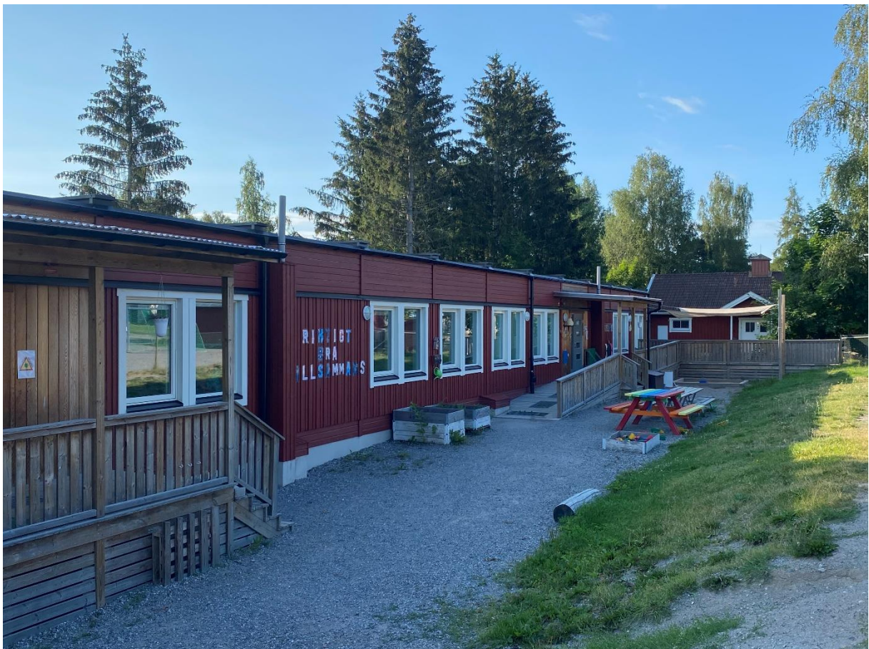
Baracker tillhörande Romfartuna förskola