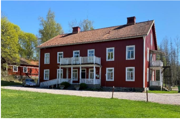
Före detta äldreboende uppfört 1905.