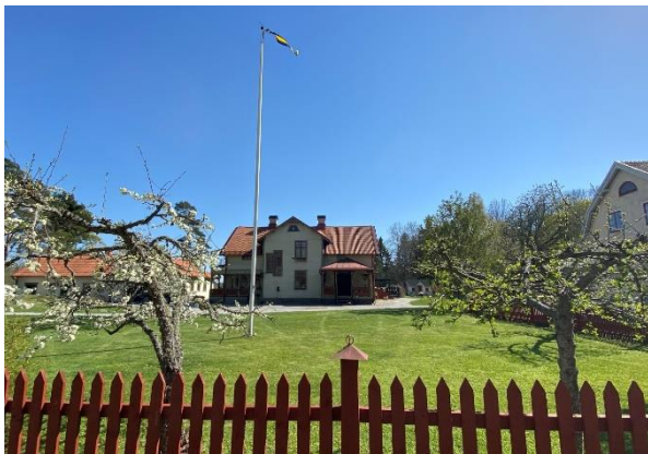
Bostadshus, före detta lanthandel.