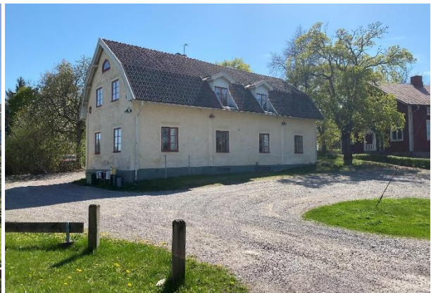
Före detta skolhus senare församlingshem, idag privat.