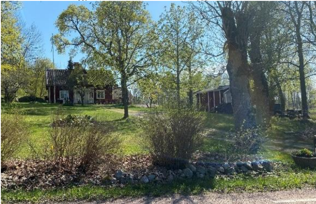
Bostadshus, tidigare bostad för skräddare.