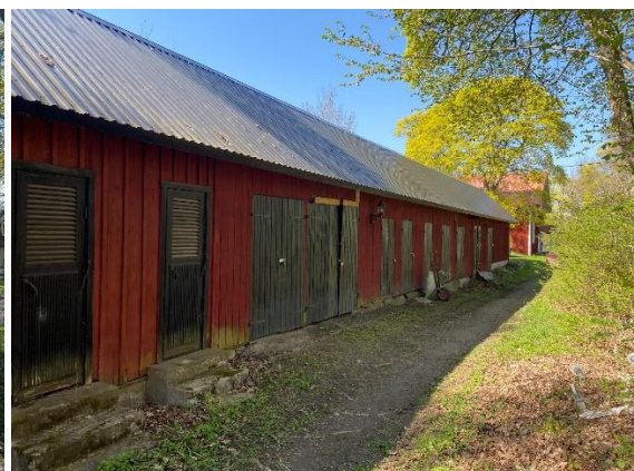
Uthus bakom skolbyggnaden.