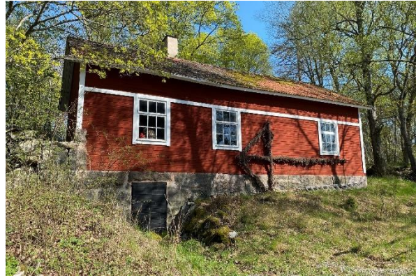
Uthusbyggnad till före detta äldreboende.