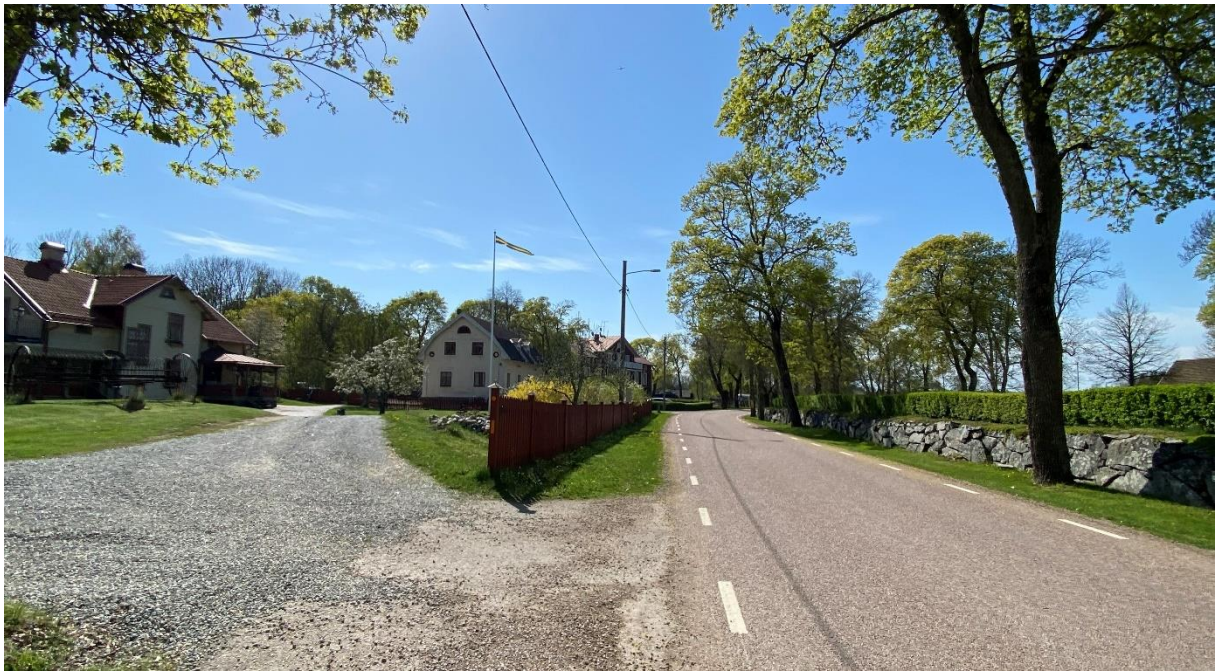
Väg genom kyrkbyn med kyrka till höger och bebyggelse till vänster.