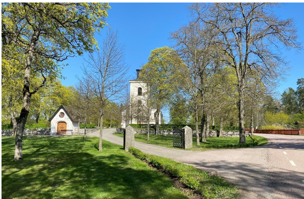
Rytterne nya kyrka.

Kulturhistorisk karakterisering Rytterne kyrka, Västerås stift, 2005