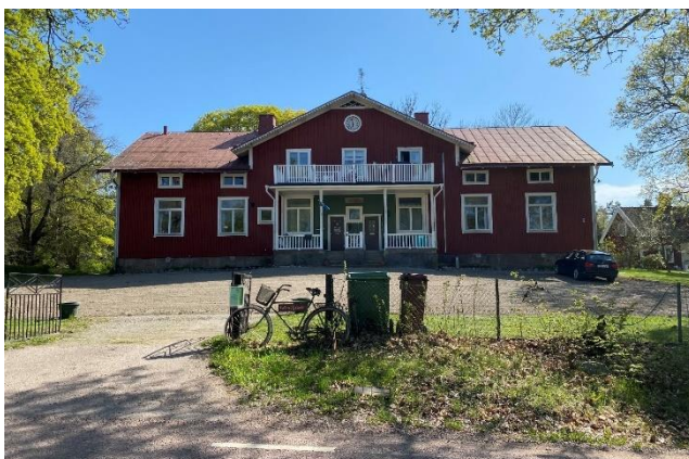
Skolhus från 1887.