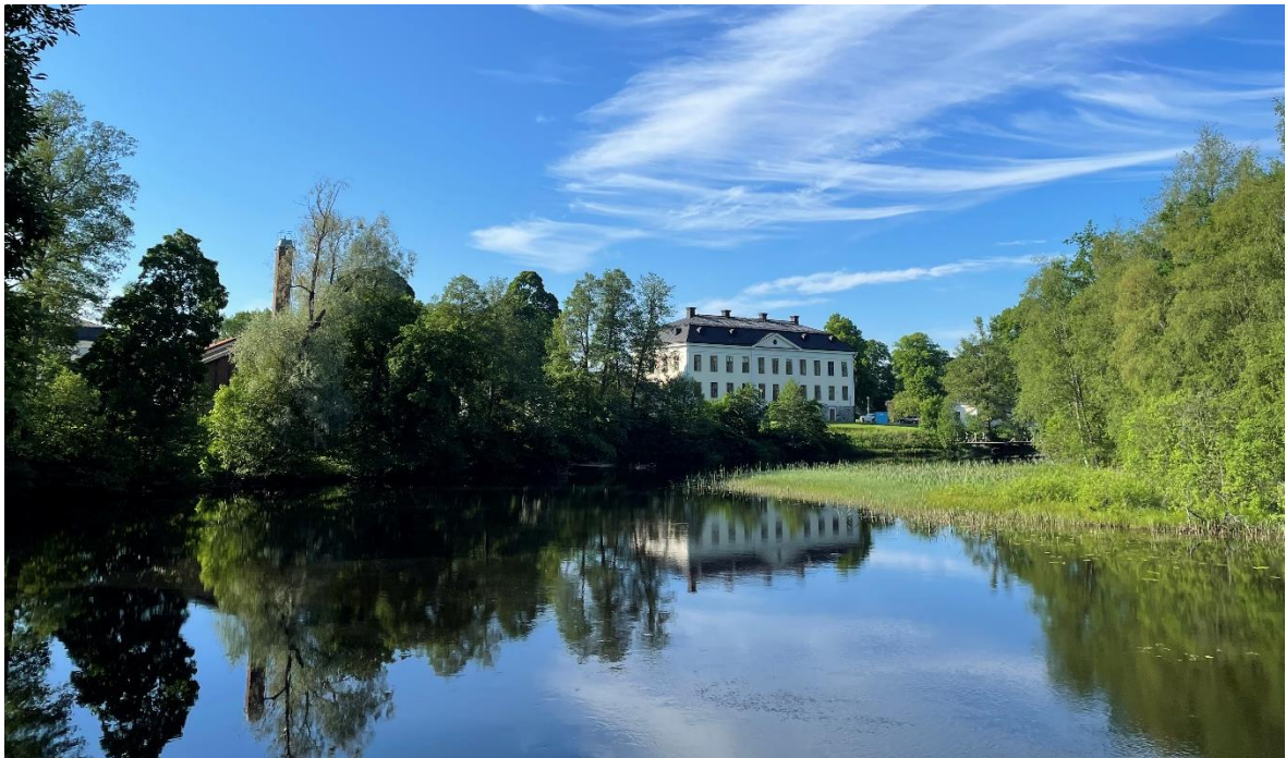
Skinnskattebergs herrgård från söder.