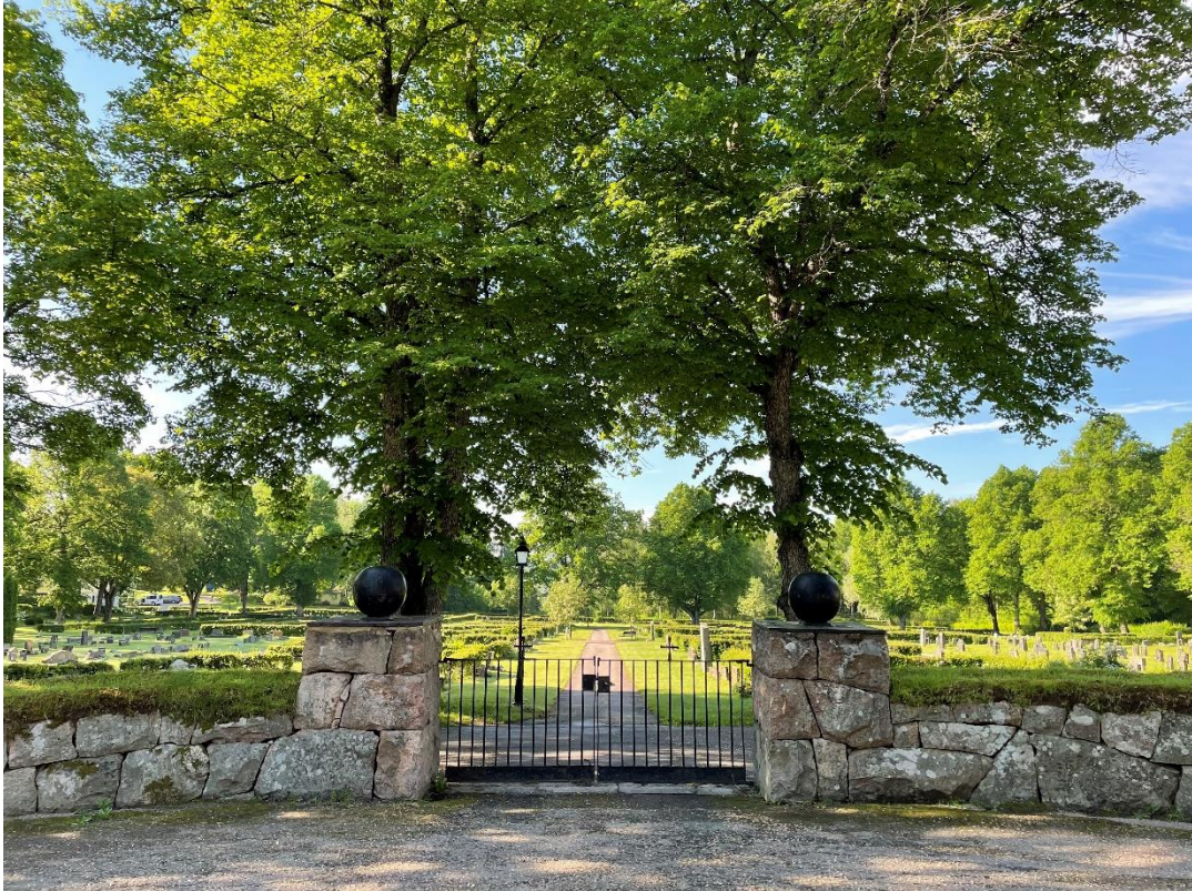
Kyrkogård mot sjön.