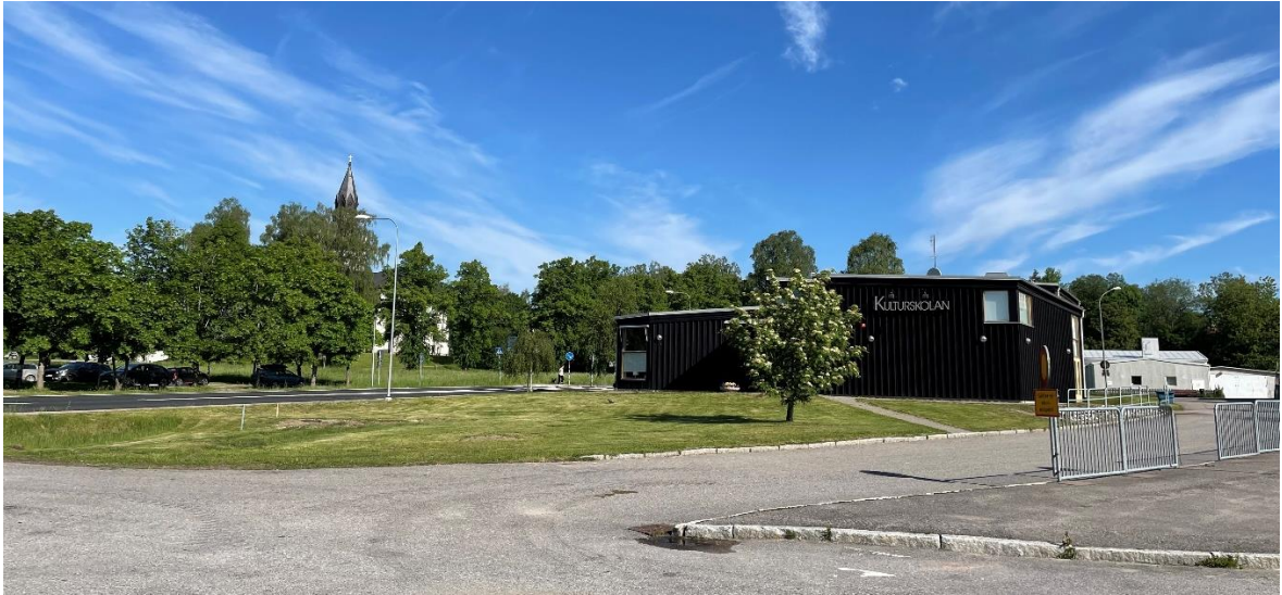
Vy mot kyrkan med Kulturhuset Korpen i förgrunden och Köpingsvägen strax bakom.