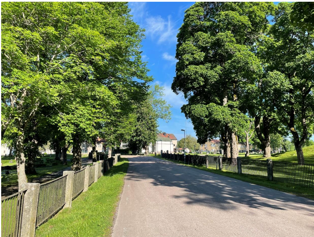
F.d genomfartväg, till höger kyrka, till vänster kyrkogård, i fonden kommunhus.