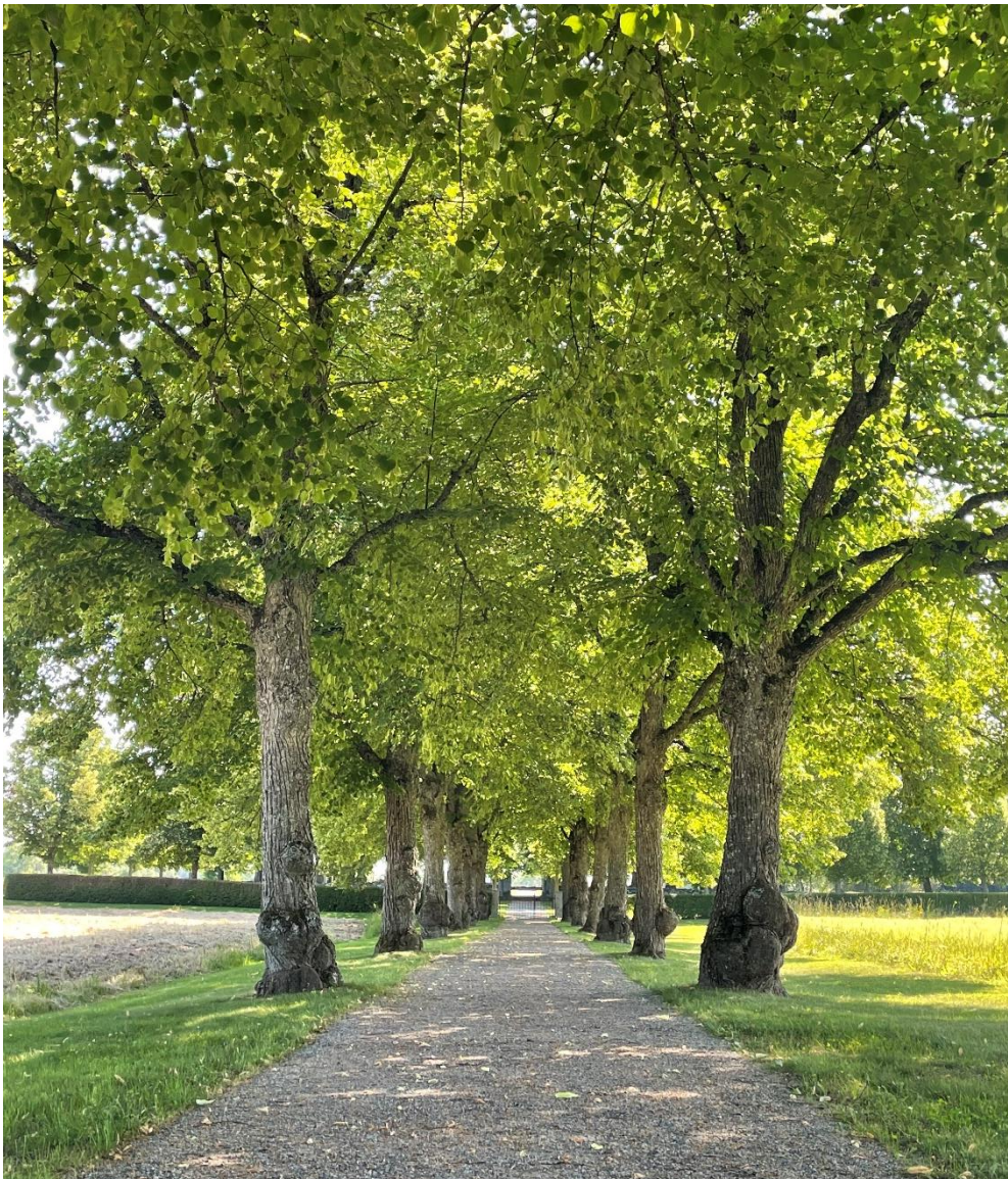
Allé mot den äldre kyrkogården.