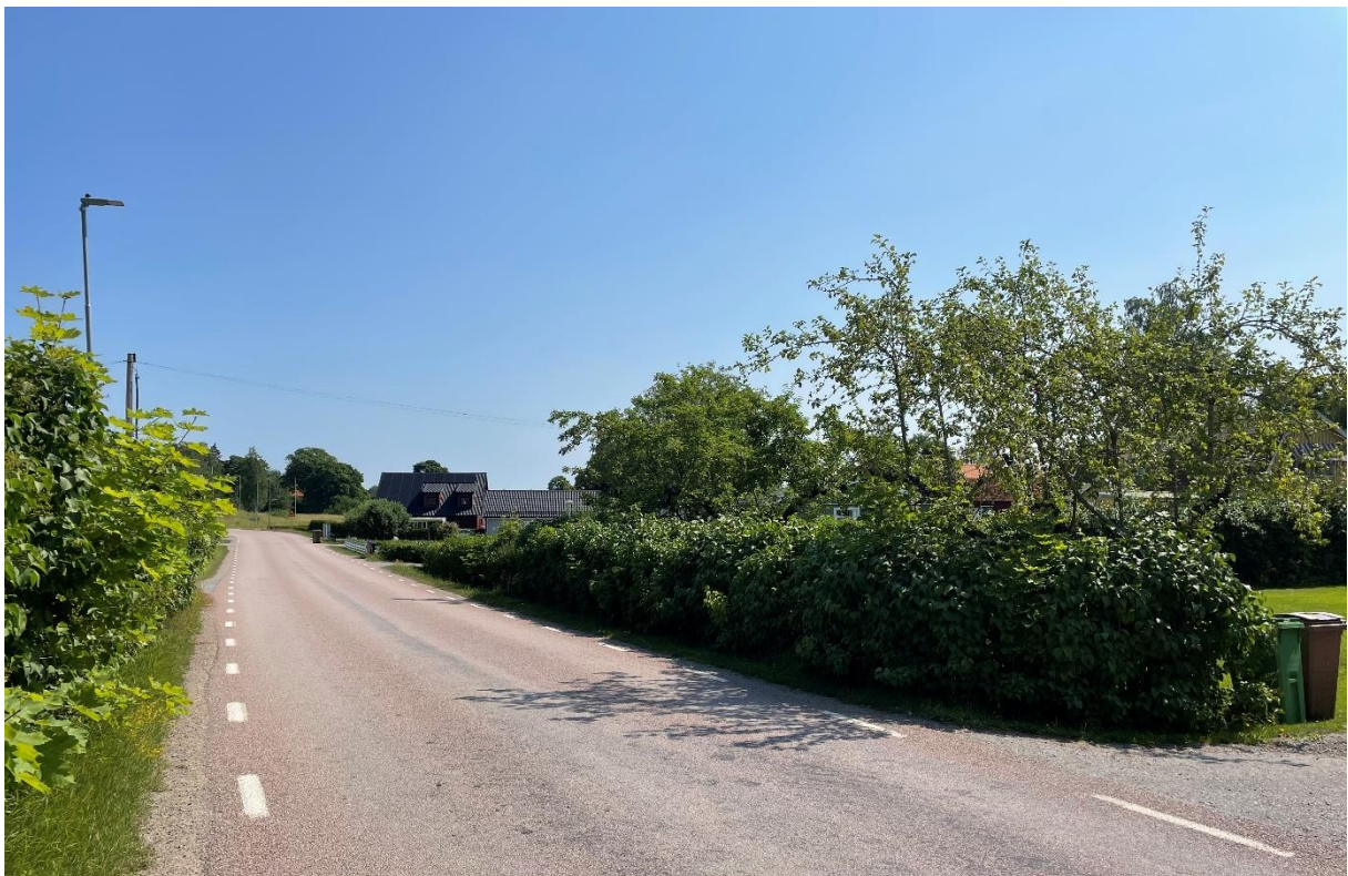
Väg norr om kyrkan med bostadshus från 1900-talets mitt. Tomterna har utfarter mot gatan och avgränsas av häckar.