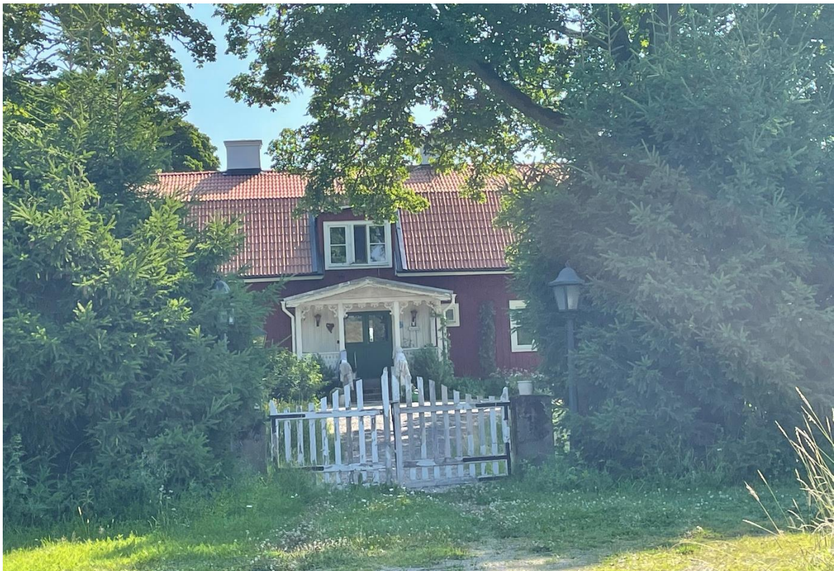
Före detta prästgårdens huvudbyggnad.