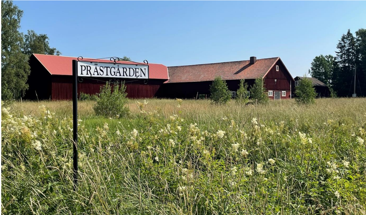
Före detta prästgårdens ekonomibygnader.