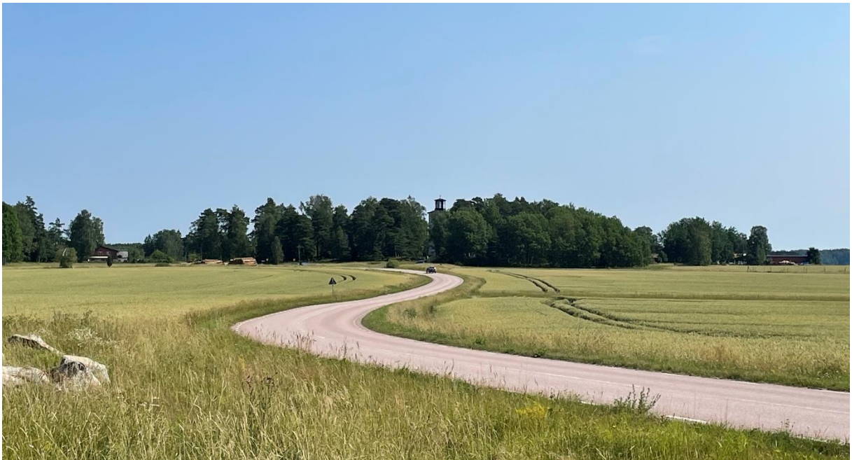
Sevalla kyrka från sydväst.