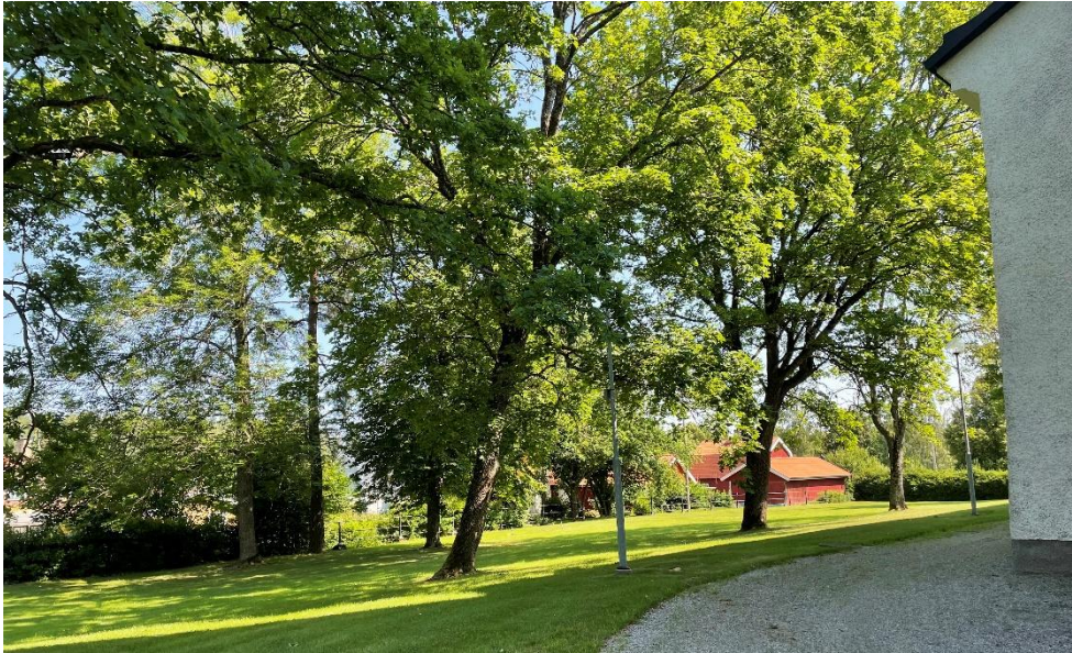
Grönyta kring nya kyrkan.