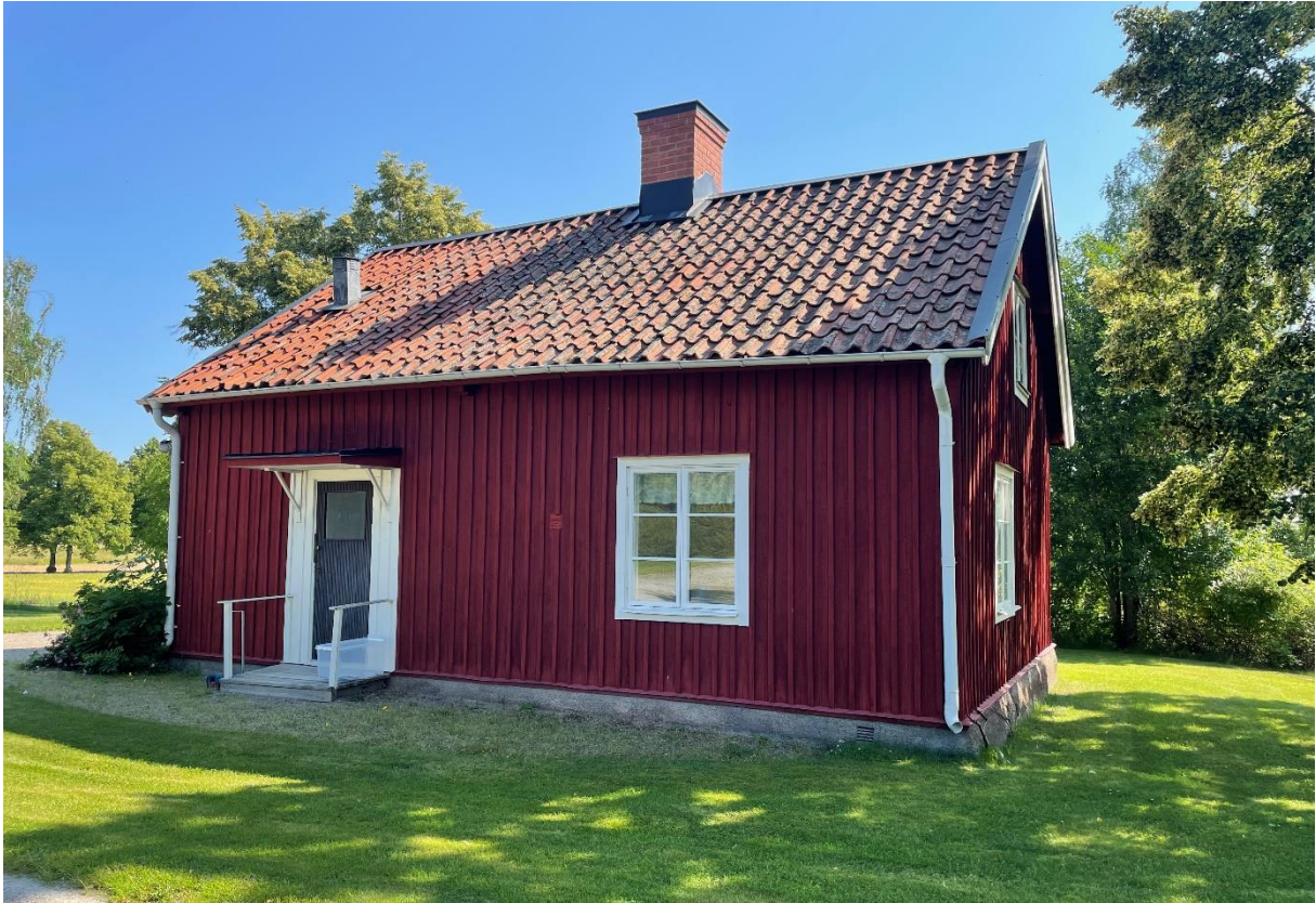
Före detta fattigstuga från 1830-tal, idag församlingshem.