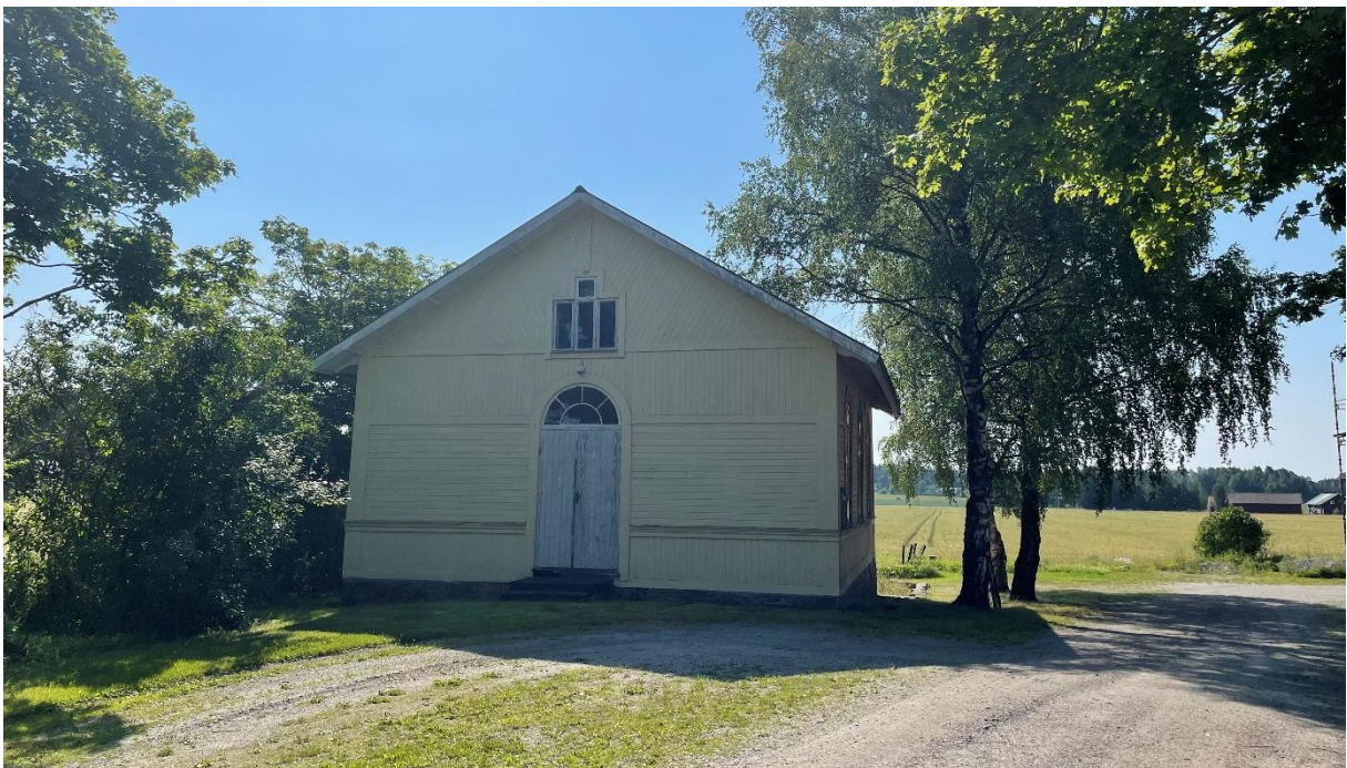
Före detta missionskyrka.