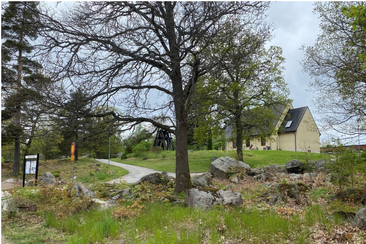
S:t Lars och kyrkbacken från söder.

S:t Lars kyrka- inventering av kulturhistoriska värden, Västmanlands läns museum, moderna kyrkor 2018.