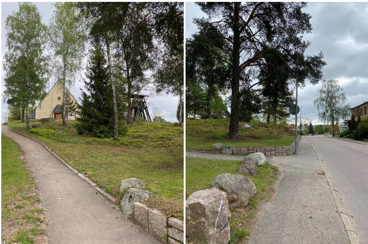
Stig upp till kyrkan från Norra prästgårdsgatan där även Hallstahammars kommunhus ligger.