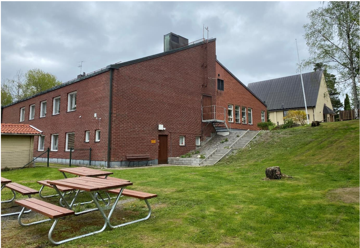
Församlingshem och kyrka.