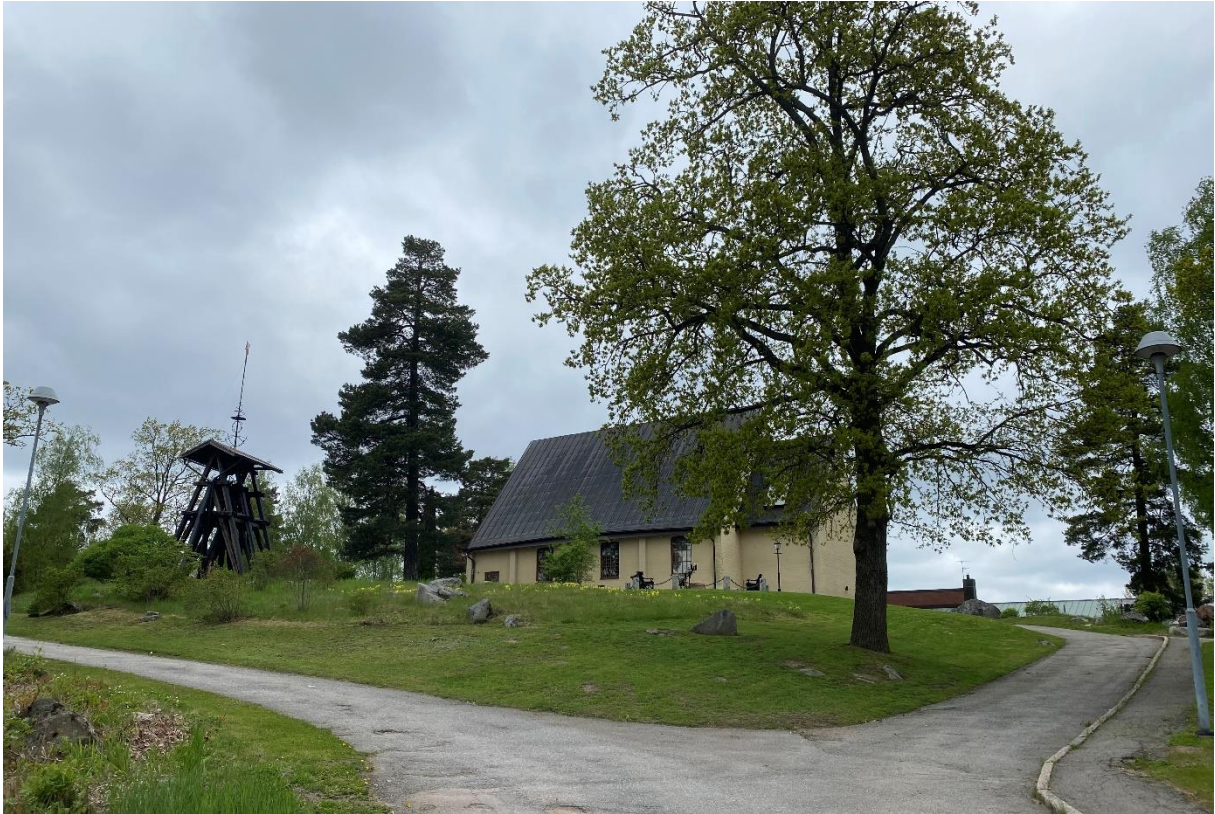
Kyrka och klockstapel från söder.