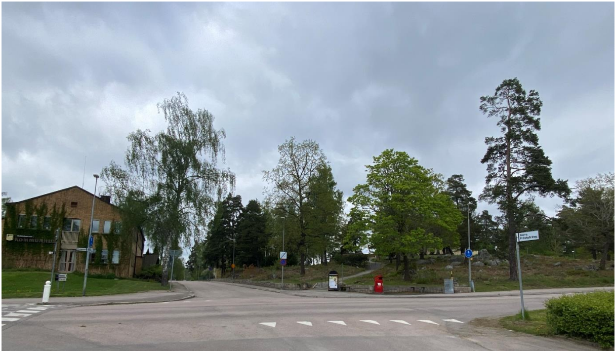
Hallstahammars kommunhus till vänster och kyrkbacken till höger.