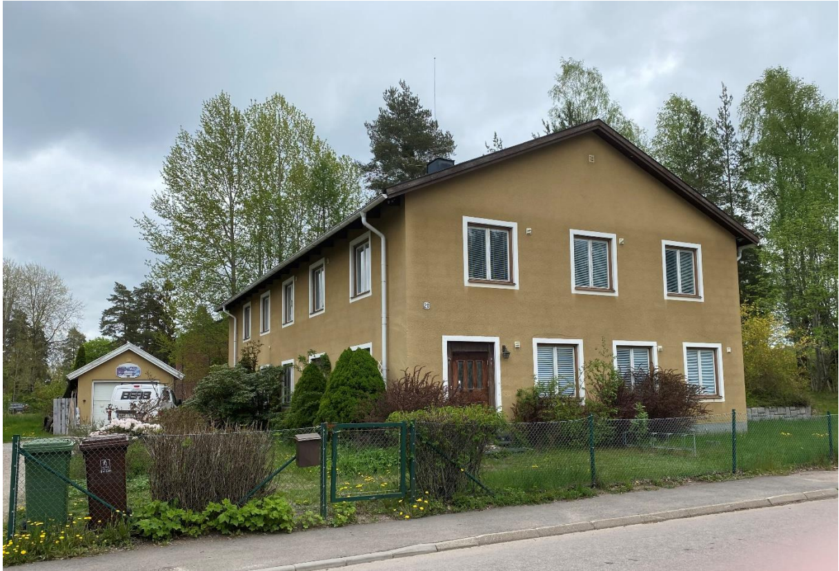
Före detta kyrkoherdebostad.