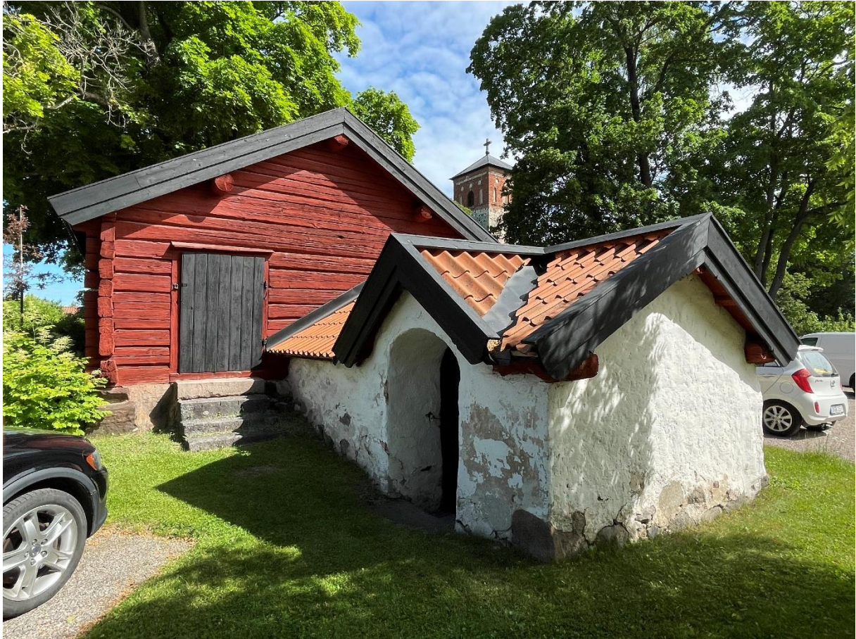
Bod och källare på före detta prästgårdens tomt.