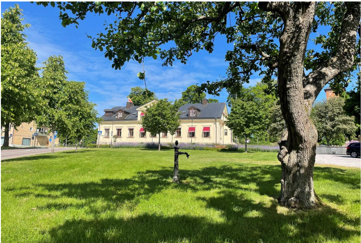
Före detta prästgård, idag pastorsexpedition från söder.