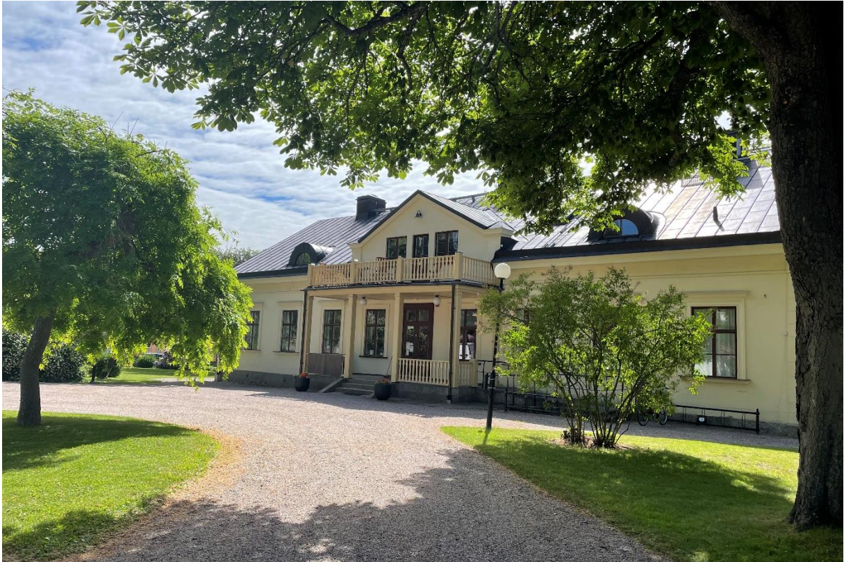
Före detta prästgård, idag pastorsexpedition.