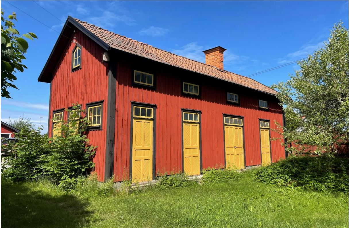
Uthus tillhörande före detta klockarbostad/skolhus.