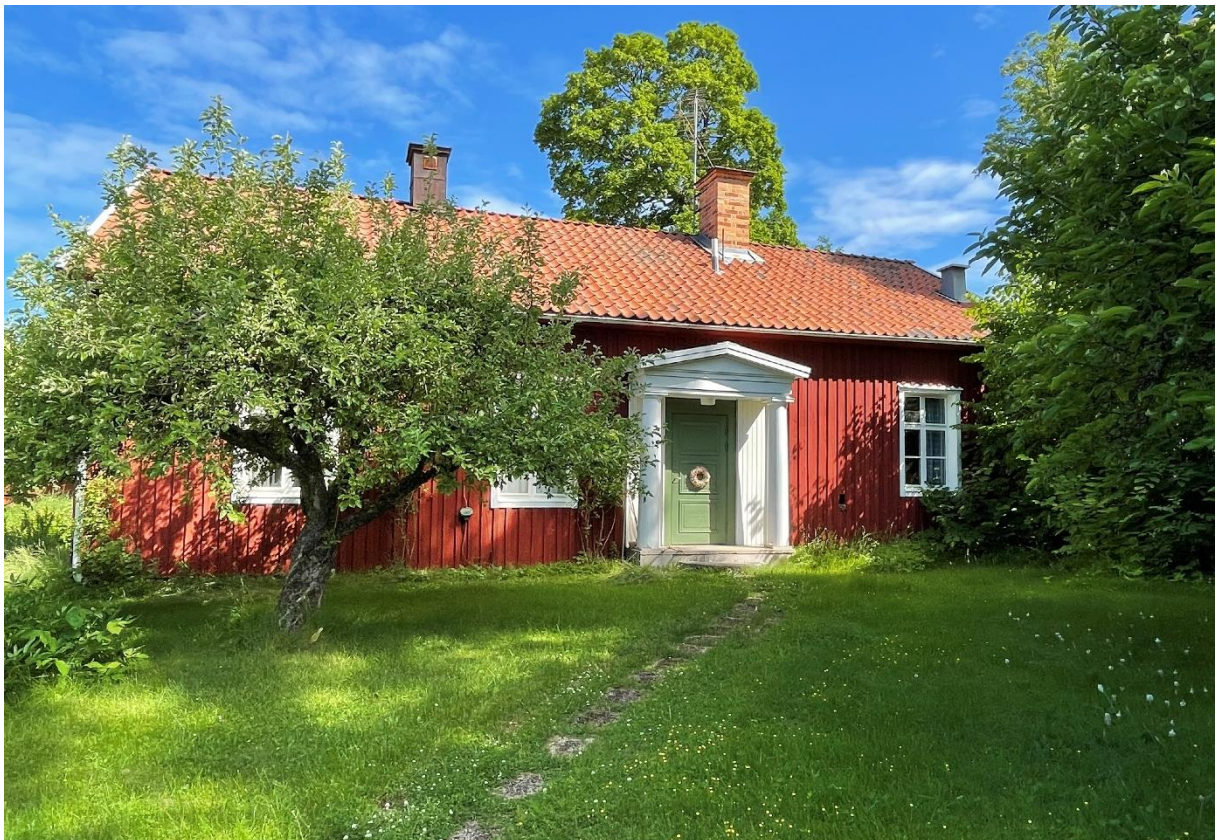
Före detta klockarbostad och skolhus.