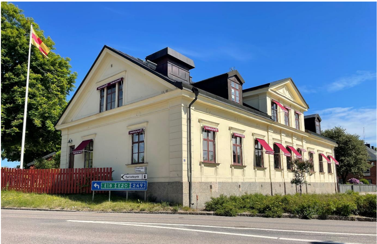
Före detta prästgård, idag pastorsexpedition.