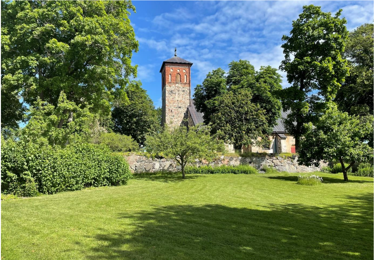
S:t Nicolai kyrka, vy över pastorsexpeditionens trädgård.