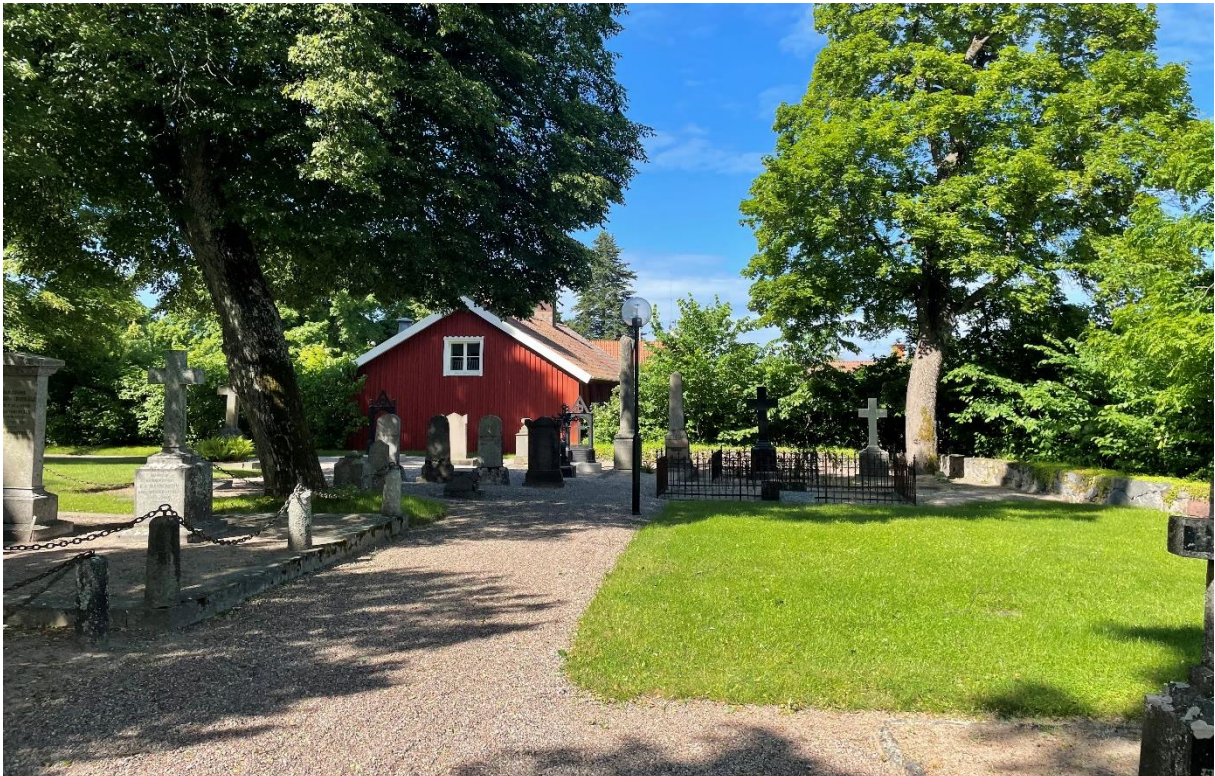
Före detta klockar/skolhus från kyrkogård.