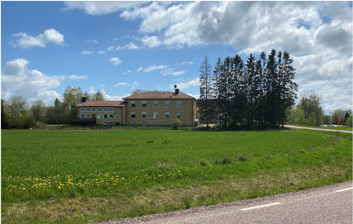
Före detta skolbyggnad från 1948.