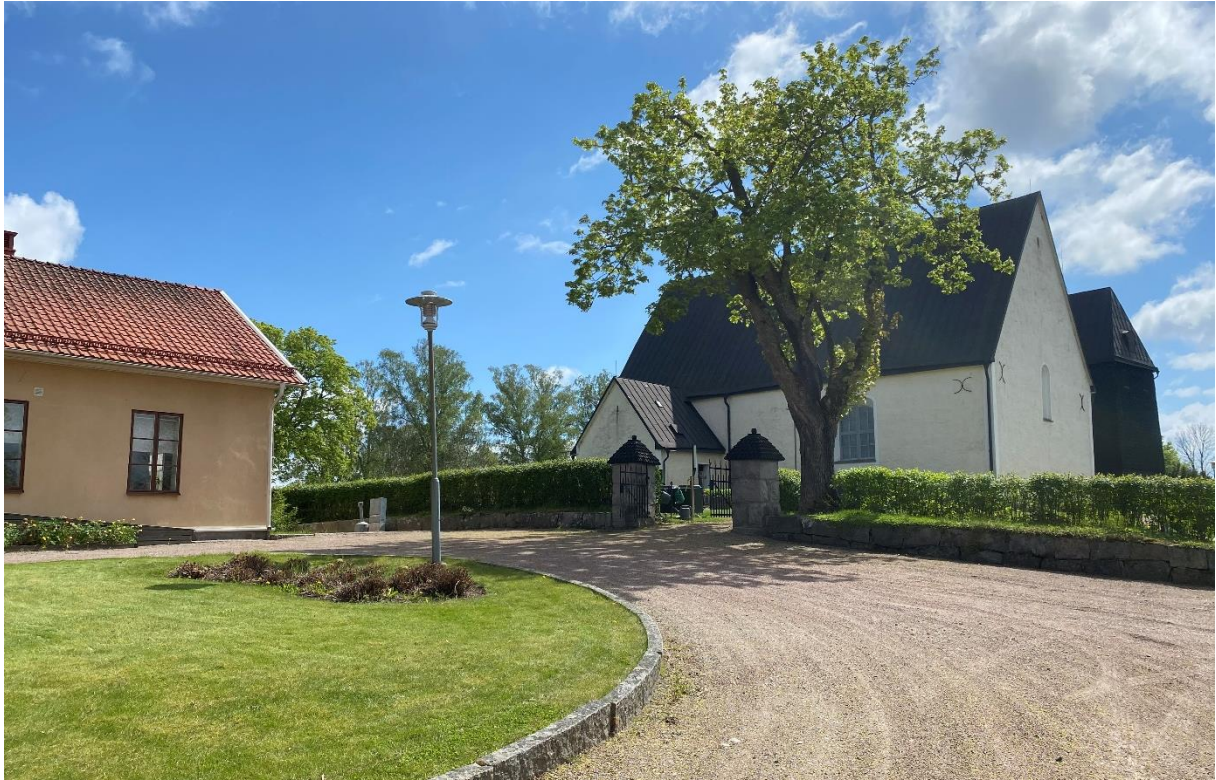
Svedvi kyrka med församlingshem, före detta skola till vänster.