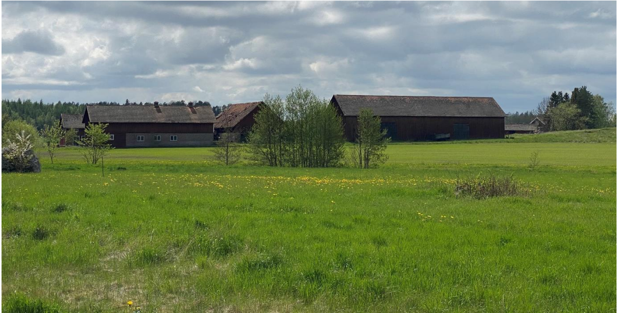
Före detta prästgårdens ekonomibyggnader.