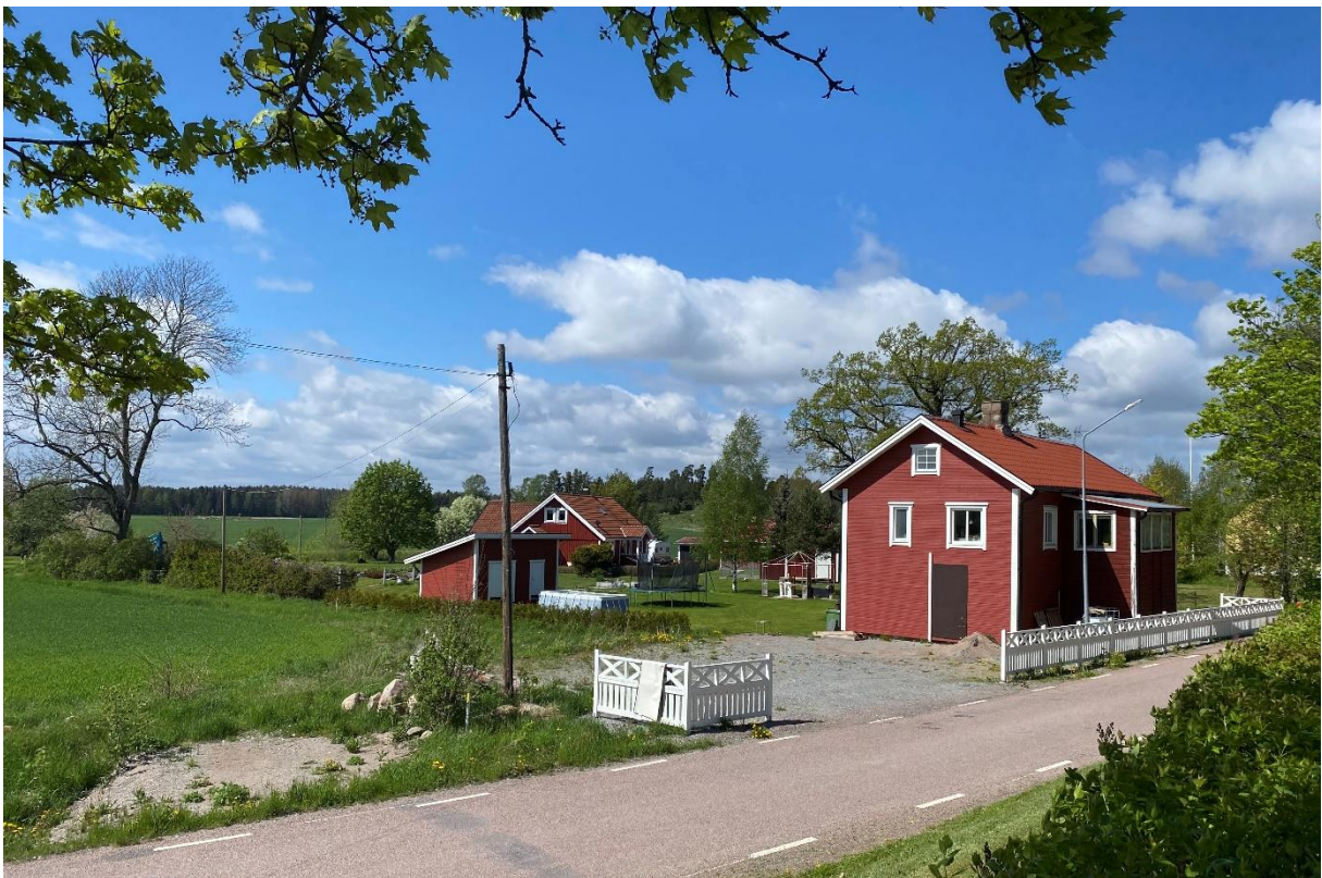
Bostadsbebyggelse söder om kyrkan, Före detta lanthandel intill vägen.