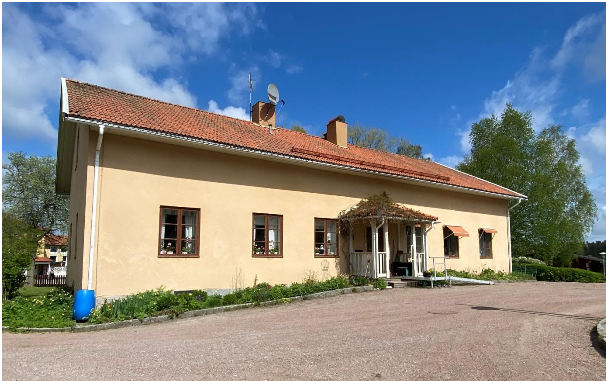
Före detta skolbyggnad, idag kontor för Svenska kyrkan.