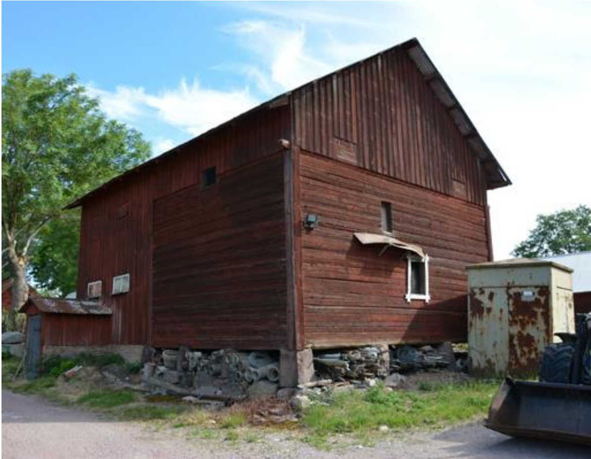
Före detta sockenmagasin på Fjällsta gård.