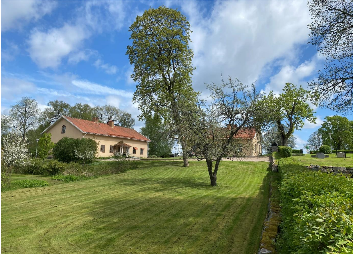
Före detta skolbyggnader med trädgård.