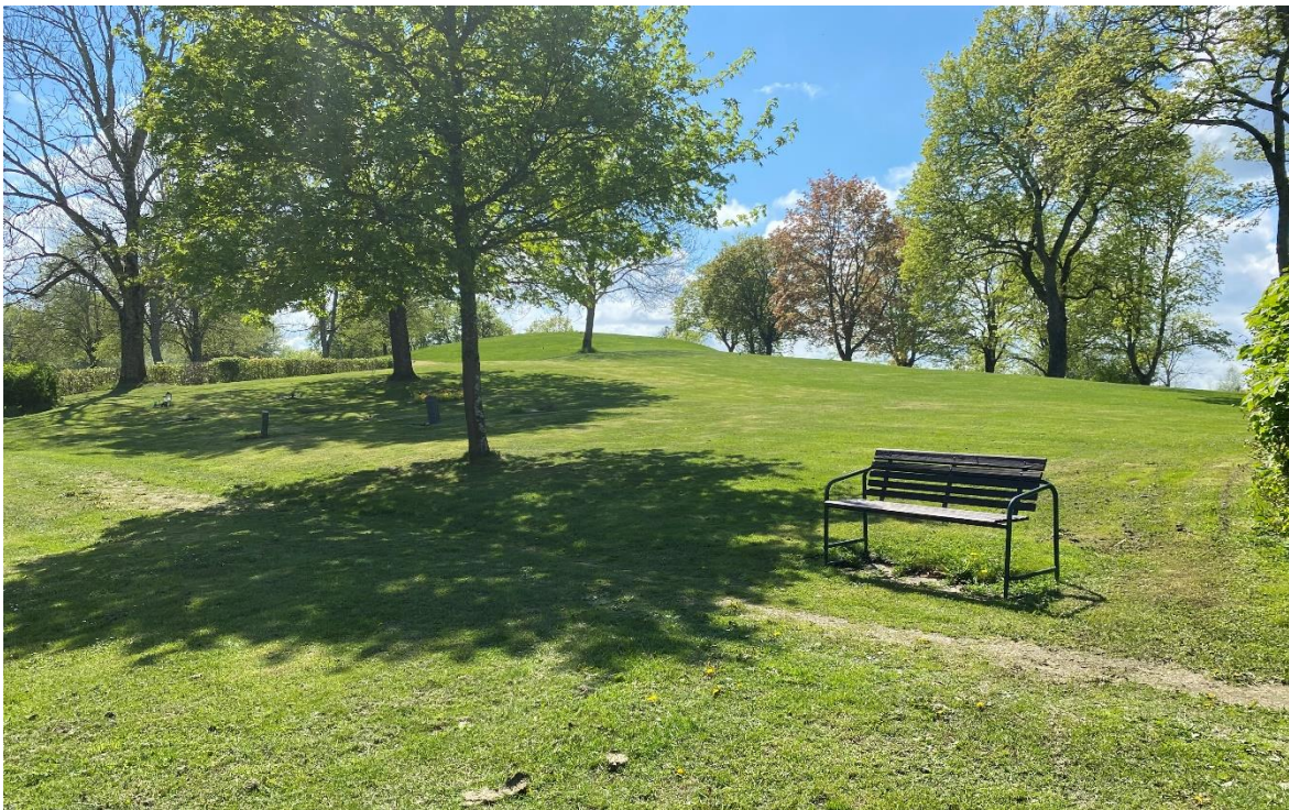
Kulle där de tidigare prästgårdarna låg, idag en del av begravningsplatsen.