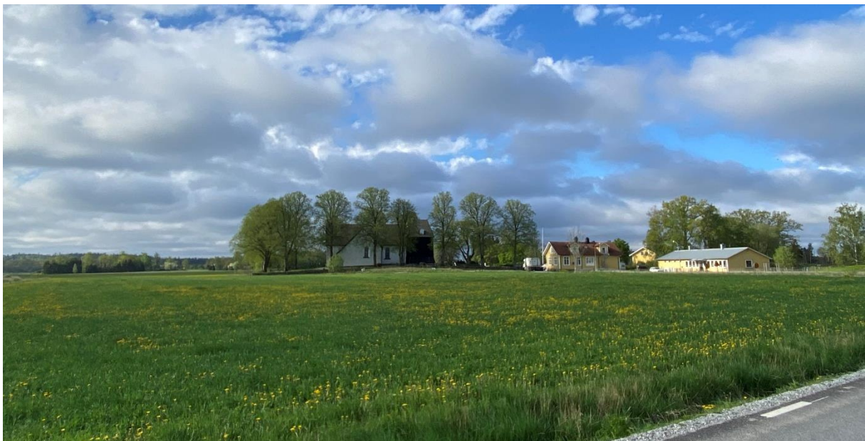
Säby kyrkby från norr.