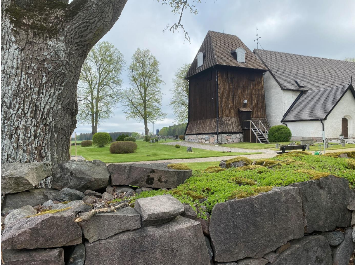
Säby kyrka och klockstapel.