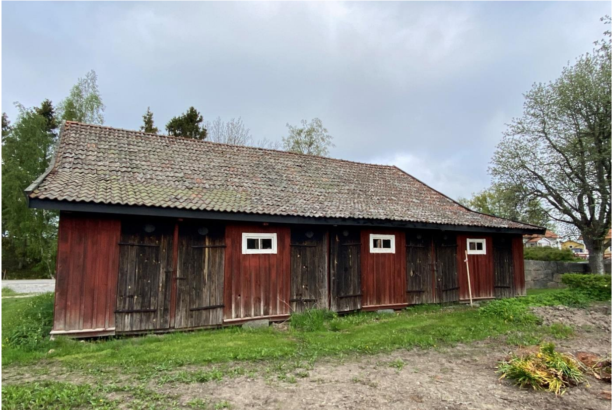
Före detta kyrkstall vid Säby kyrka.