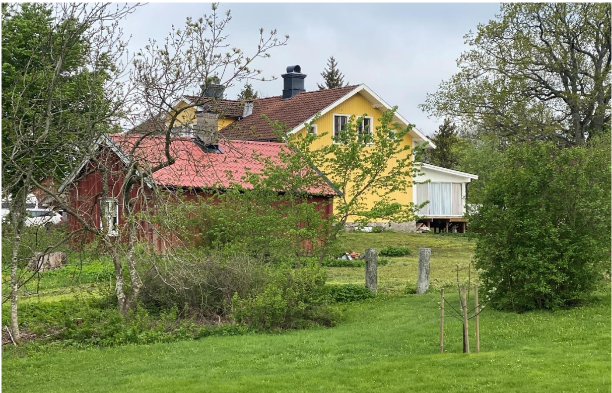
Säby före detta prästgård med flygelbyggnad.