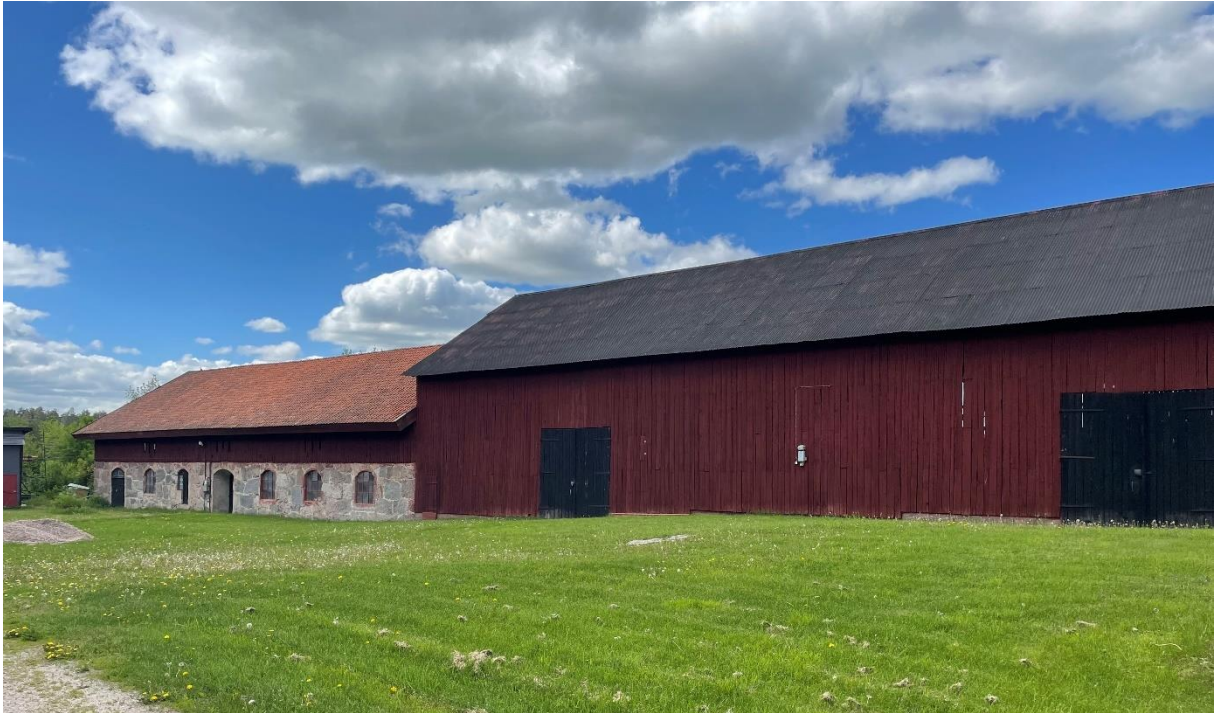
Ekonomibyggnader vid tidigare prästgården.