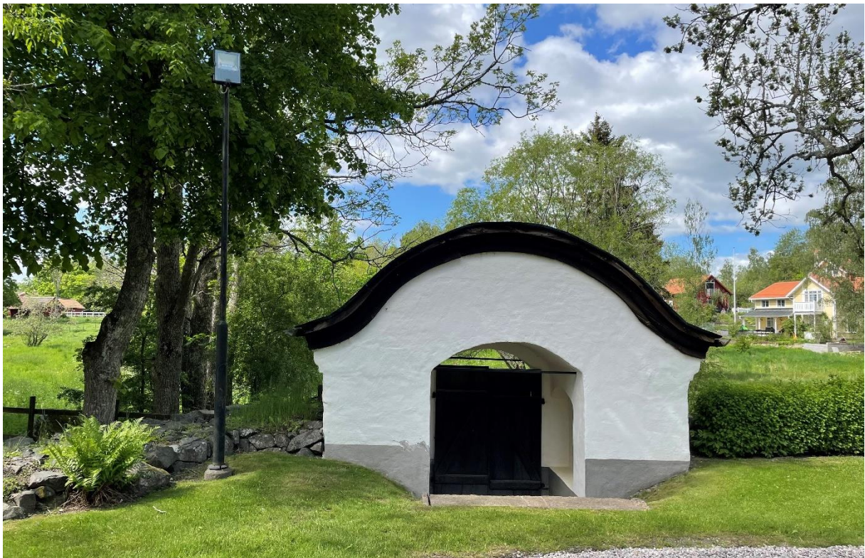
Stiglucka mot väster.