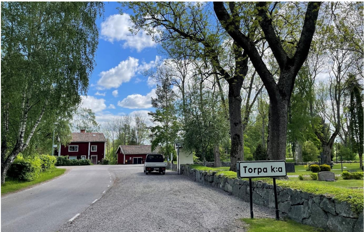
Före detta sockenstuga invid kyrkan.