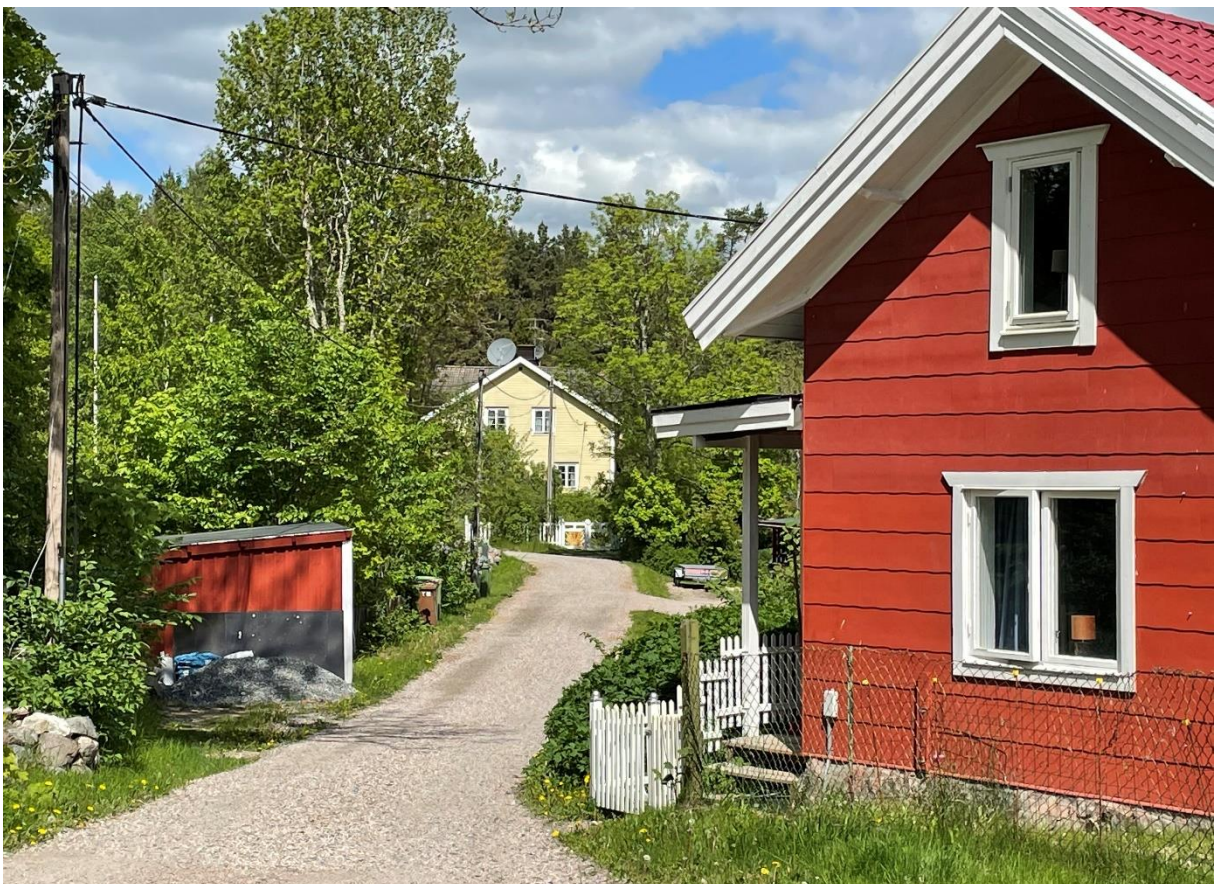
Bebyggelse i Himmelsberga by, byggnaden i fonden är en före detta fattigstuga.