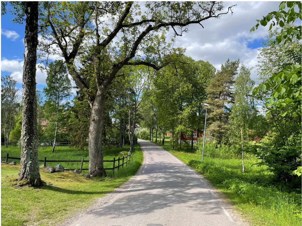
Väg från kyrkan mot Himmelsberga by.