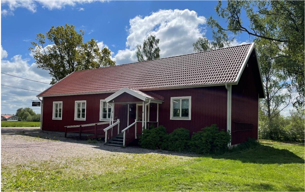
Bydegården söder om kyrkan.