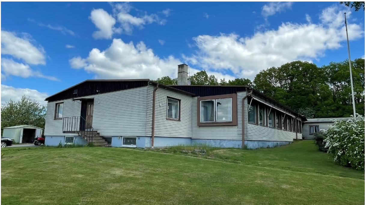
Ålderdomshem från 1950-talet söder om kyrkan invid spåren.