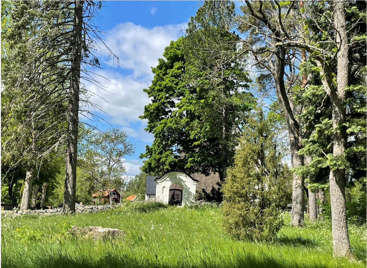
Stiglucka mot öster.