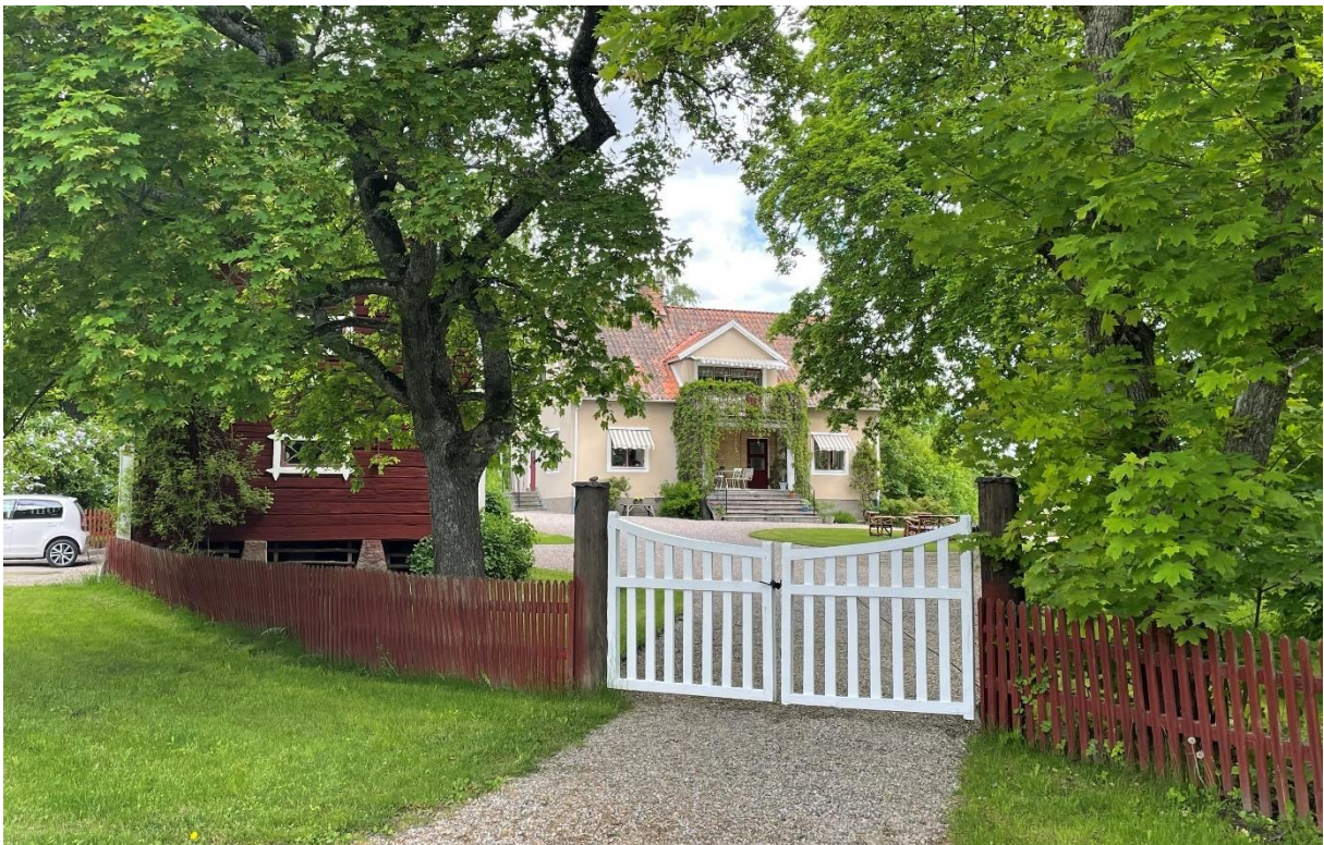
Före detta prästgårdens nya huvudbyggnad från 1950-talet.