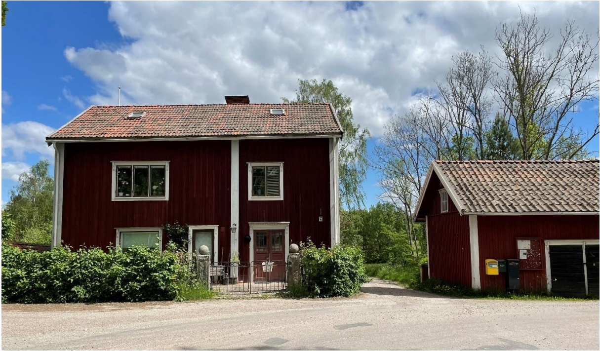
Före detta sockenstuga.