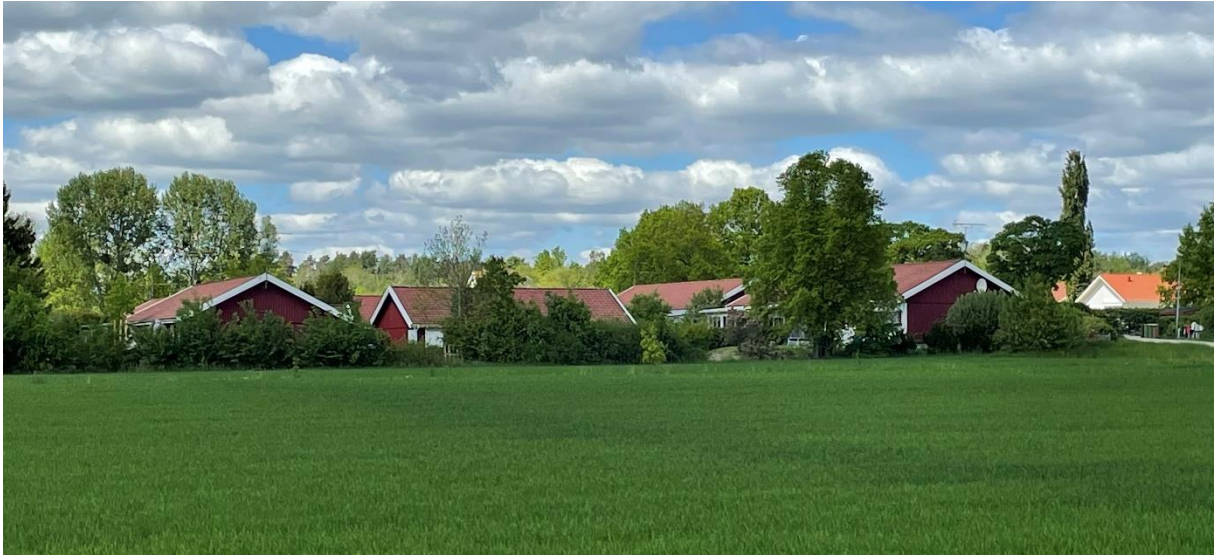
Modern bebyggelse vid platsen där skolan låg tidigare.