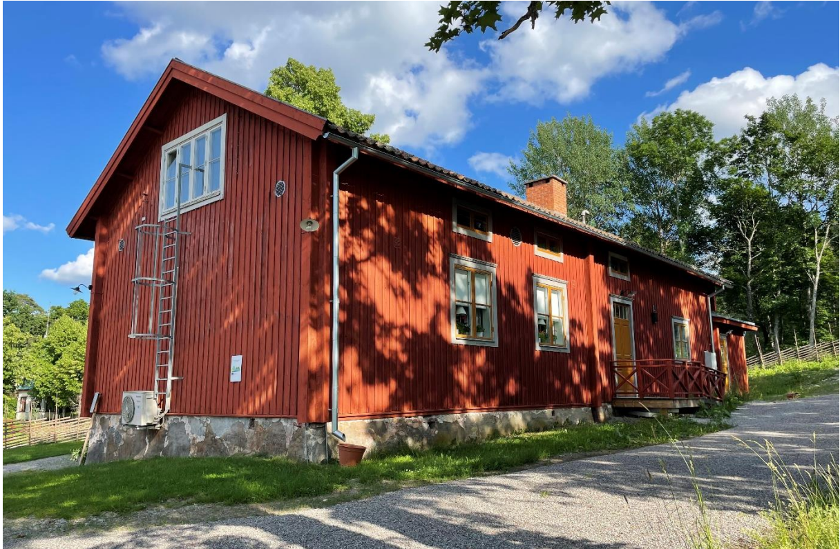
Den äldre skolan och klockarbostaden från 1825 har används som bygdegård sedan 1951.