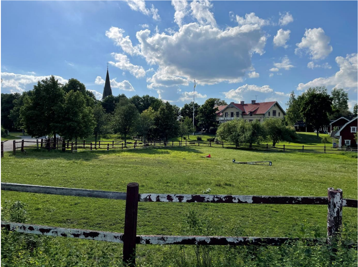
Tärna kyrka och före detta skolhus.