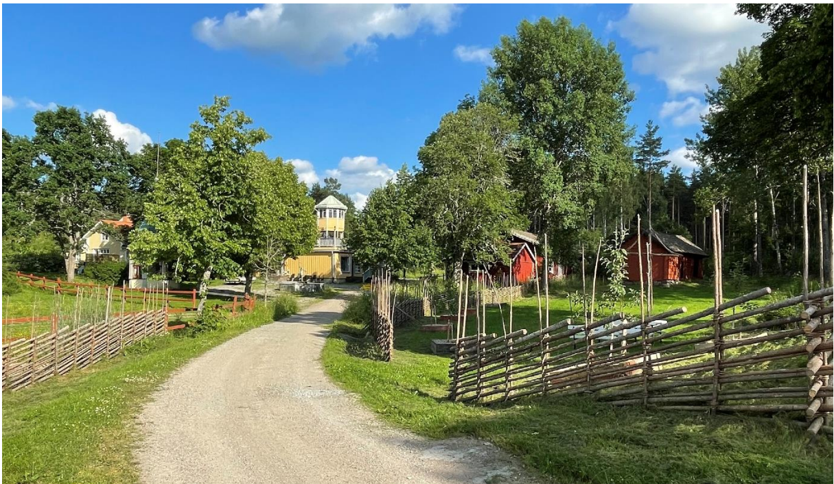
Östra delen av byn där den äldre klockarbostaden och handelsboden låg.