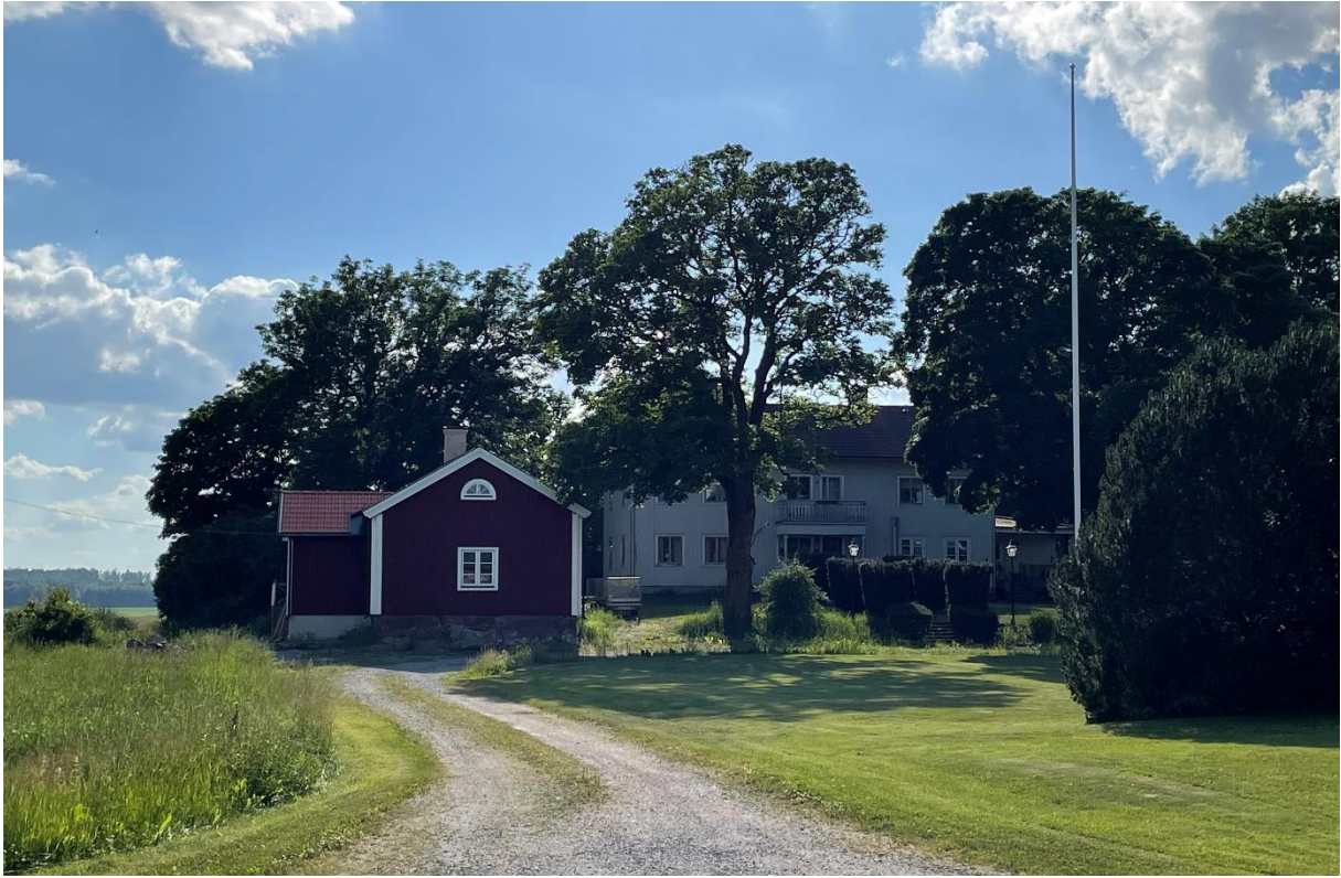
Före detta prästgård.