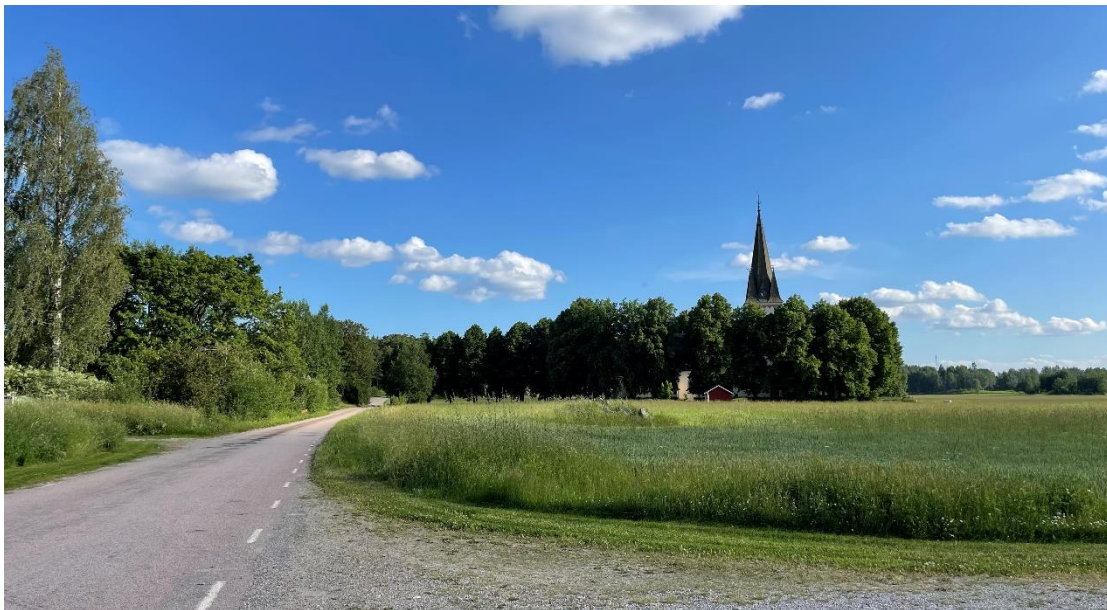
Tärna kyrka från norr.