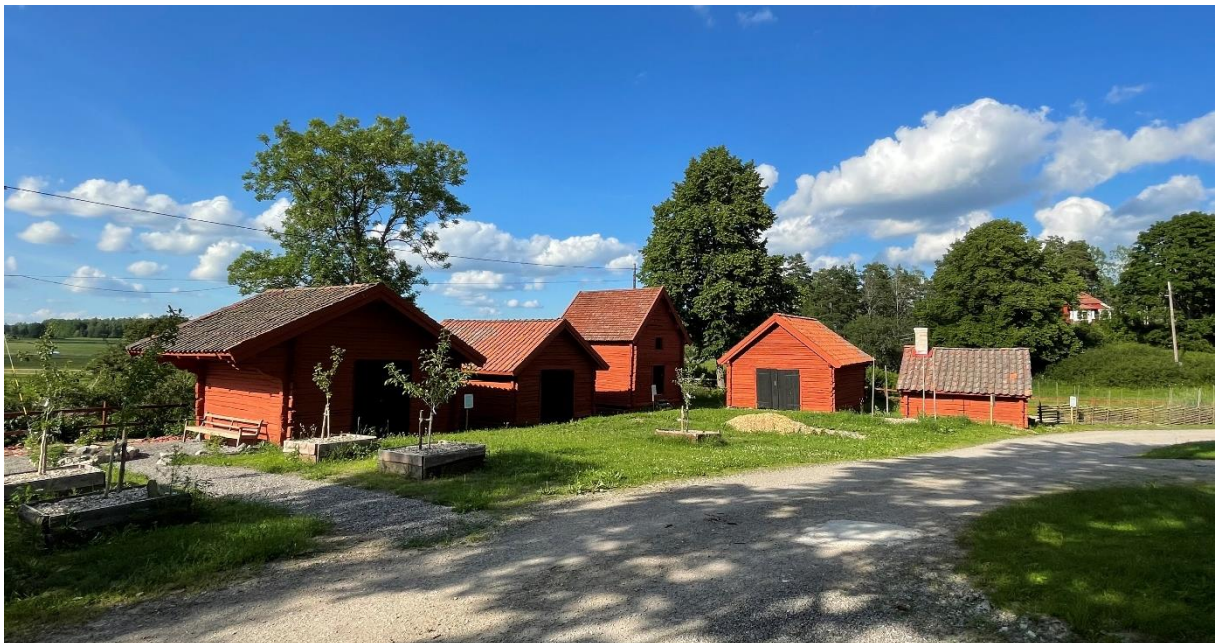
Före detta kyrkstall, sockenmagasin och bodar flyttade till bygdegården.