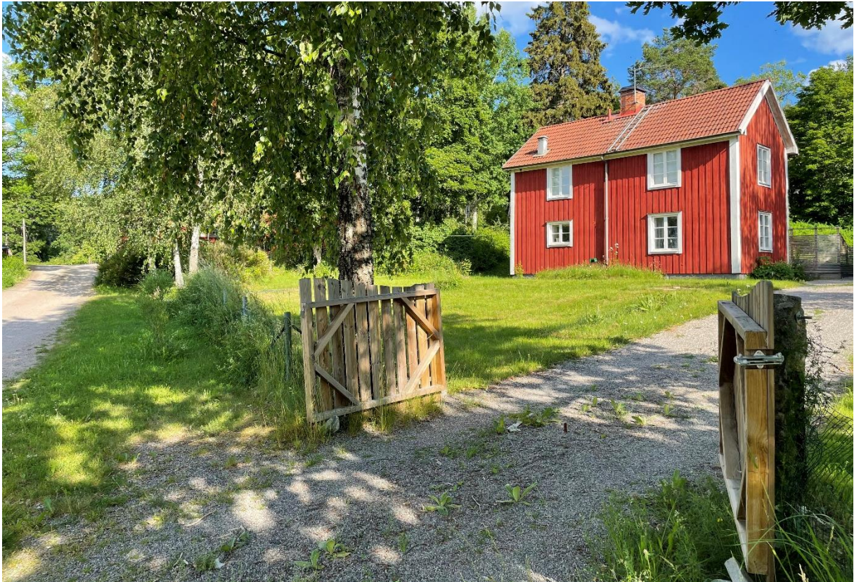
Före detta sockenstuga.