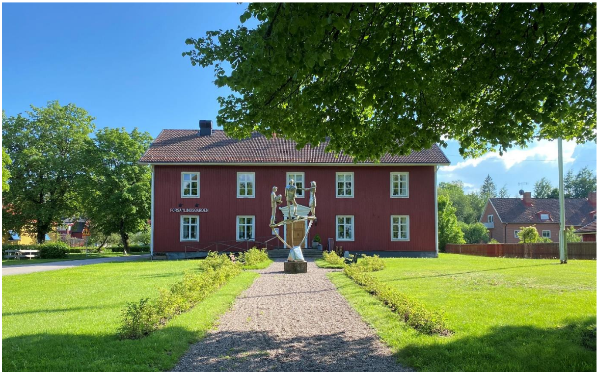
Före detta sockenstuga, även tingssal, skola, lärarbostad och kommunalhus. Idag församlingsgård.