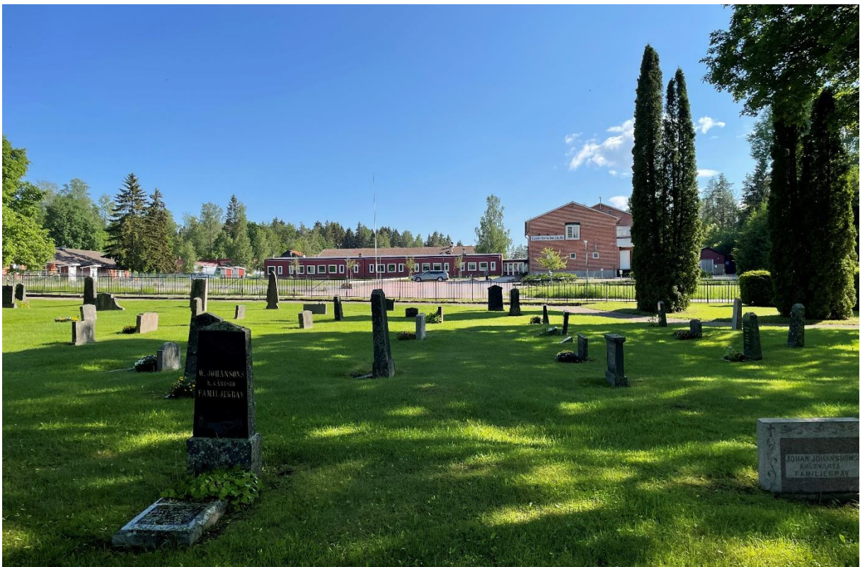
Kyrkogård med centralskola.