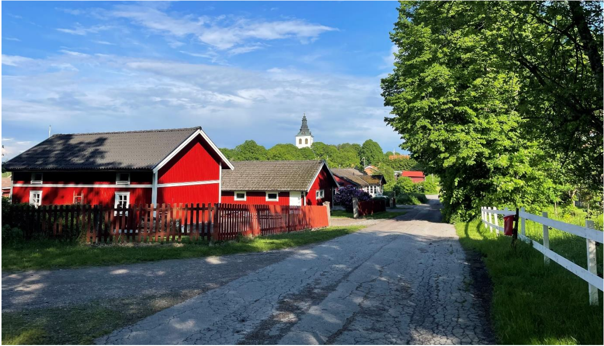
Vy från före detta prästgården över moderna bostadshus mot kyrkan.