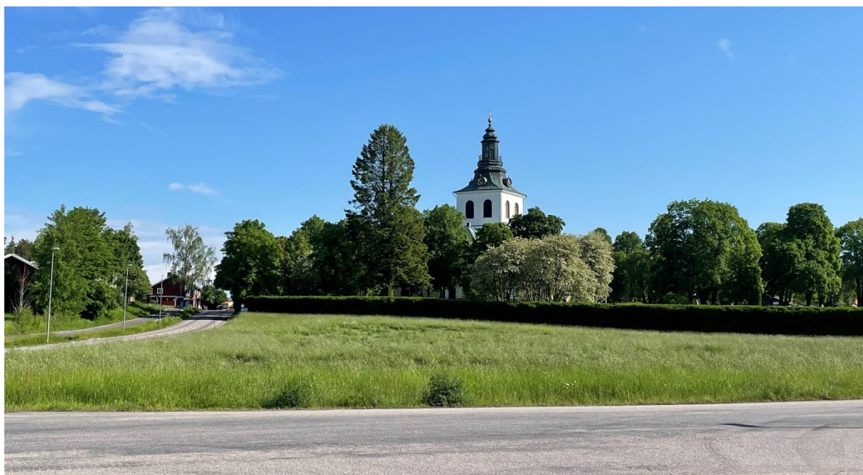
Västerfärnebo kyrka från norr.

Kulturhistorisk karakterisering Västerfärnebo kyrka, Västerås stift, 2005