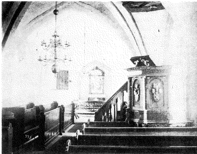
Interiör av Fågeltofta kyrka omkr. 1915.

NICOLAUS-BILDEN på storklockan i Fågeltofta kyrka. Textbandet är här kraftigt förminskat i förhållande till bilden. Observera de bakvända S-en.