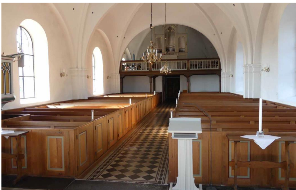
Kyrkorummet sett mot orgelläktaren i väster.

De flesta av kyrkans fönsteröppningar är utförda med rundbågvalv och murade med flera rätvinkliga språng. Fönsterbågarna är av gjutjärn med småspröjsade klarglas och solbänkarna täcks av asfaltsstrukna kalkstenshällar. Till tornets andra våning finns ett rundfönster med blomformad spröjsning. Ljudöppningarna till klockvåningen består av dubbla rundbågsöppningar i samtliga väderstreck. Mot öster och väster är öppningarna indragna i en rundbågsformad nisch murad med två språng. Den yttre rundbågsomfattningen saknas kring ljudöppningarna mot norr och söder som istället omfattas av ett enkelt mursprång. Ljudluckorna är av brunmålad träpanel.