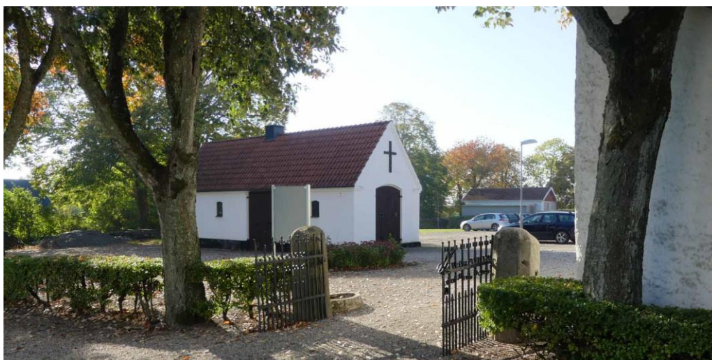
Entrén till kyrkogården från väster med bårhus och till höger i bild ett förråd.

Väster om kyrkogården ligger ett bårhus uppfört 1934. Bårhuset utvidgades år 1975 med toalettutrymme och lunchrum för kyrkans personal. Ombyggnaden skedde sannolikt efter ritningar av Torsten Leon Nilson. Byggnaden har putsade och vitmålade fasader med höga gavlar. Längst ned finns en svartmålad sockel och murarna avslutas med ett murat listverk i två skift. Muröppningarna har