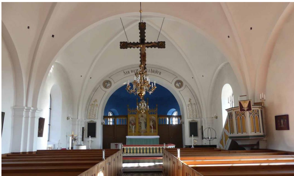
Vy av kyrkorummet sett mot koret.