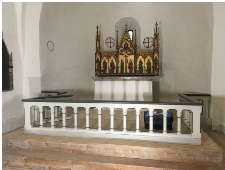
Altare och altarskrank.

Predikstolen är tillverkad 1665, men målad senare, först 1729 och senare på 1800-talet. Den är placerad på det medeltida sidosaltaret. Trappskärmen är betydligt nyare än resten av predikstolen. Baldakinen köptes från Fole kyrka 1751. Den togs ner vid restaureringen 1967 eftersom man ansåg att den skymde de då framtagna väggmålningarna. Den konserverades av Marja-Liisa Alm och återuppsattes år 2000. Resten av predikstolen konserverades av Erik Olsson 1967. Han tog då bort den brunådring som fortfarande finns kvar på baldakinen. Invändigt var korgen övermålad med grå färg. Även på trappräcket tog han bort den bruna ådringen men eftersom det där inte fanns någon äldre färg under målade han den i nuvarande färger. Skärmen som suttit mot den södra väggen var skadad efter elementet så denna målades om med linoljefärg i en liknande nyans. På de blå fälten på korgen hade lack strukits så flödigt att det runnit, nu när lacken åldrats såg det ut som gula rinningar. Dessa togs bort under konserveringen. Resten av objektet rengjordes och alla små bortfall och skador kittades upp och målades in.