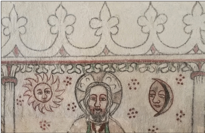
Detalj av Nådastolen. Långhus, södra väggen.