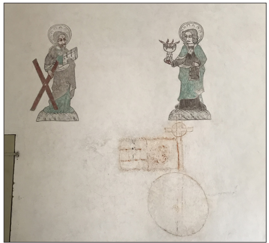
Före och efter konservering. Apostlarna Andreas och Johannes samt ett klot med kors och fana. Målningarna finns i tornet, norra väggen. Fotograf Rebeca Kettunen.

ringkammare. Dessa äldsta målningar har ristade konturer, som en skiss, ett stöd vid måleriets utförande. Det finns kvar tio av tolv konsekrationsskors i kyrkan. Sannolikt har två försvunnit vid upptagandet av större fönster. Under 1300-talet tillkom det monumentala måleriet av Kejsar Henriks själavägning på långhusets sydöstra vägg. Samtliga målade apostlar, scenen med "Tjuvmjölkerskan och helvetesgapet", "Kristus i mandorlan" samt passionsfriserna som ses på långhusets norra och södra väggar tillkom under andra halvan av 1400-talet av passionsmästarens verkstad. Från den sista tidsperioden härrör en kartusch i gråsvart kulör placerad under passionsfrisen på södra väggen med inskriptioner som anger årtalet 1695 och flera initialer. Det finns en ytterligare inskription i gråsvart på väggen mot öster i predikstolen vilken är svårtydd och har möjligtvis målats under 1600-talet.