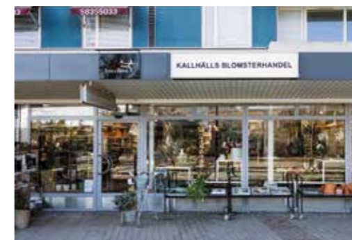
Entré från Gjutarplan.

– Alla hjärtans dag är egentligen tuffare än julhelgen eftersom allt är koncentrerat till en och samma dag. Då jobbar vi nonstop.