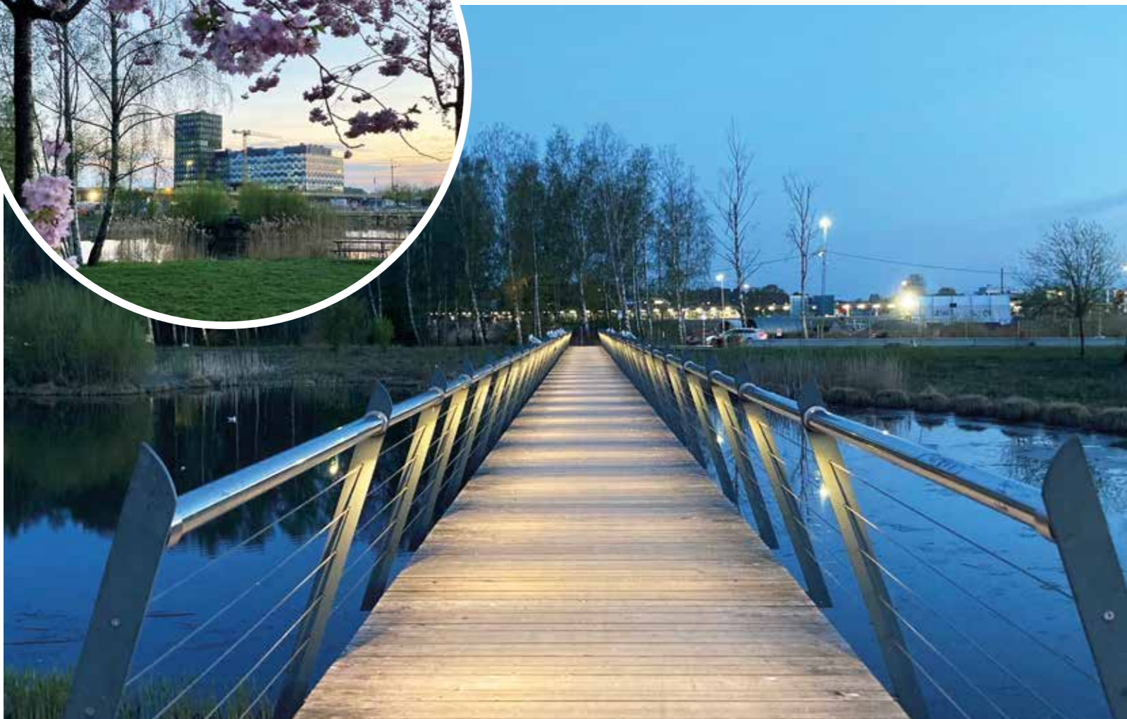
Skyfallsparken är ett bra exempel på hur det går att hantera stora vattenmängder vid kraftiga regn. Då fylls tillfälligt det vanligtvis stilla vattendraget och de lägsta spångarna översvämmas. Parken lockar till sig ett rikt fågelliv. Här beundrar ett par änder utsikten.