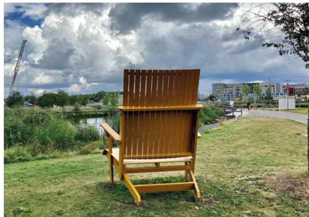
Plats för tankar.

”Alla måste förstå hur de ekologiska systemen fungerar, även ekonomerna.