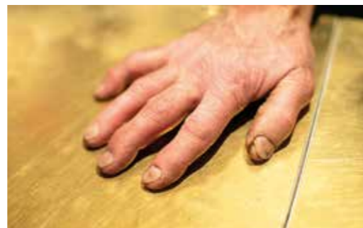
Skapande av blomstergrupper innehåller många kreativa moment. Växtsaften och jorden påverkar händerna efter år av arbete.