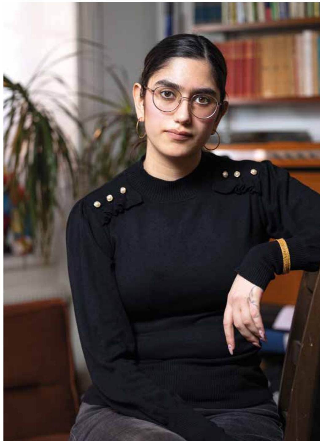
- Jag är glad att det tog tid med publiceringen. Jag fick distans och kunde förbereda mig.