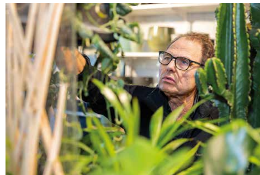
Djungelkänsla i Kallhälls centrum.