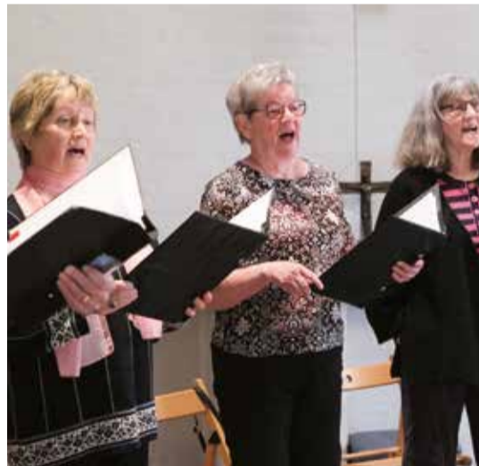
Att sjunga i kör ger en speciell känsla av gemenskap.