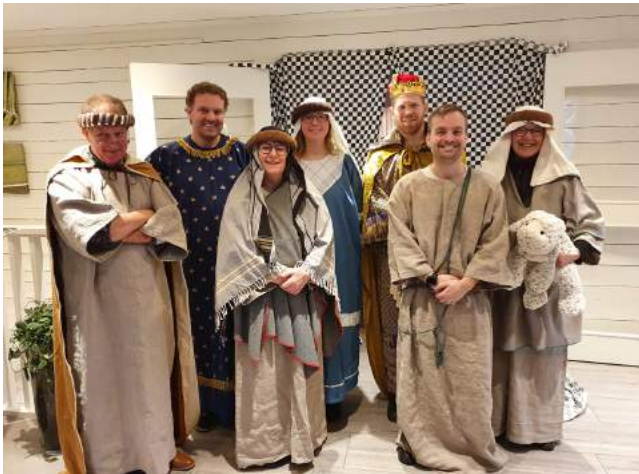
Julspel för år 1 i Ölmostad pingst med får.