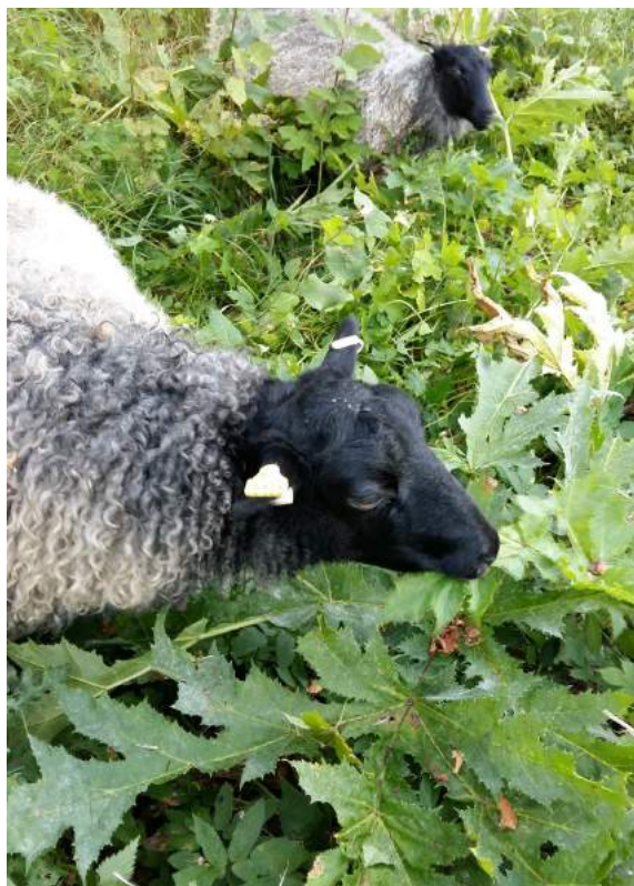
Får med jätteloka

Gällande ekonomin med fårskötsel kan det sägas att det gått i vågor. På 1950- och 1960-talen var det populärt med skinn och ull av får. 1970- till 1990 - talen utgjorde sämre tider, medan under 2000 - talet har intresset för får återuppstått. Köttet, speciellt lammkött, är efterfrågat av dagens mera miljömedvetna konsumenter, eftersom det är så kallat naturbeteskött och fåren utgör naturliga, miljövänliga gräsklippare, som bidrar till att hålla markerna öppna. Intresset för fårskinn och speciellt då just skinn från gotlandsfår - världsunika, med sin grå färg, vackert glansiga och lockiga - upplever en renässans.