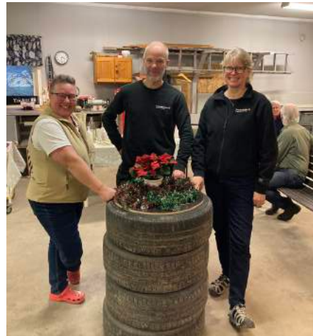
Invigning Skärstad ekonomibygnad.