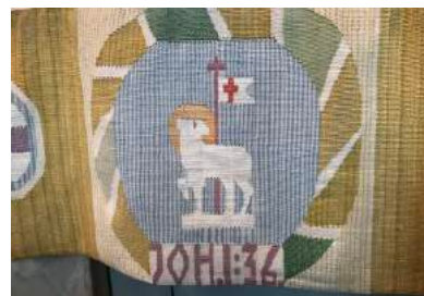
Altarbrun i Ölmsstad kyrka