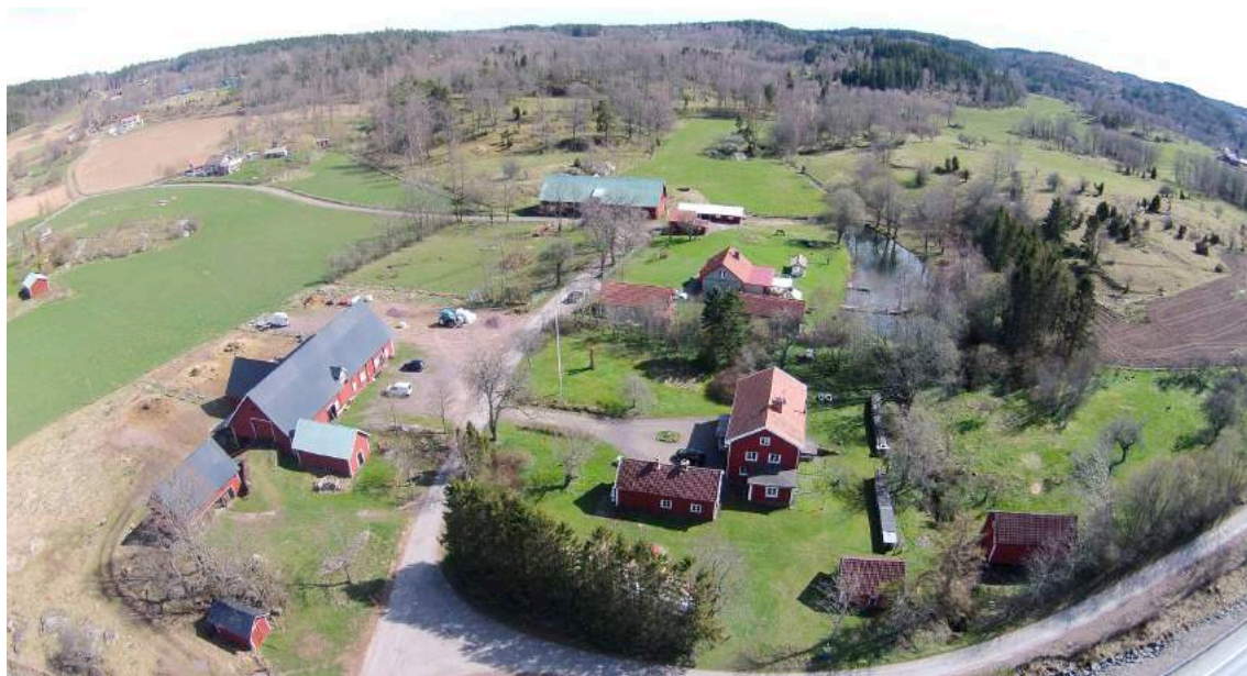
Gunneryds Frälsegård drönbild.