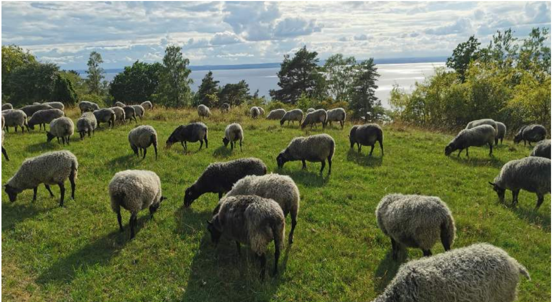
Fagfår i beteshagen i en strålande miljö.