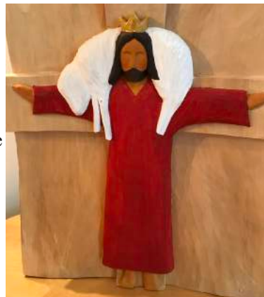
Altaruppsatsen i Lillkyrkan, Skärstad kyrka

'Herren som en herde' är en av de mest älskade bilderna för Gud i Bibeln. Många har säkert sett illustrationen där Jesus står klädd som en herde med ett litet lamm över sina axlar. I handen håller han en herdestav, till hjälp för att fånga in fåren, som kanske fastnat någonstans eller som sprungit vilse. Det är en harmonisk bild, som säkerligen är så uppskattad för herdens omhändertagande sätt och vilja att se till så att fåren, det vill säga vi människor, har det bra!