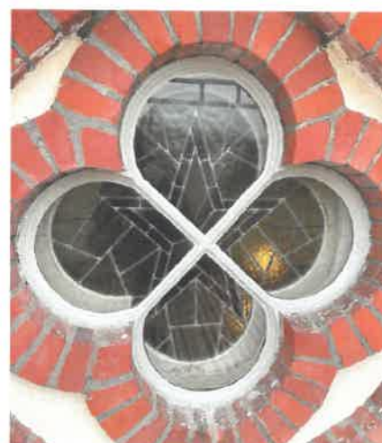
Köinge kyrka.