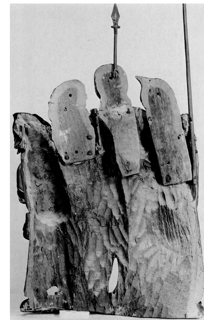
Högra figurgruppen i altartavlans mittparti, fram- respektive baksida.