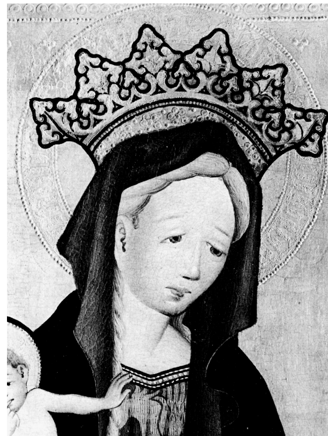
Jungfru Maria, detalj av målning på insidan av den vänstra flygeldörren.

flygeldörrarnas yttersidor målade han nästan helt om. Gloriorna på helgonen är ursprungligen utförda genom punsning i förgyllningen. Vid den hårdhanta restaureringen förgylldes hela bakgrunden, varigenom texten med helgonens namn kom att bli mycket svår att se. Texten har aldrig framhävts med hjälp av någon färg utan endast som skiftning i den förgyllda bakgrunden. Detta var