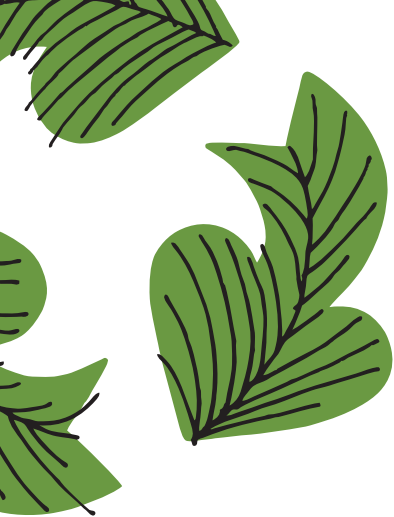
ILLUSTRATION: SUSANNE ENGMAN