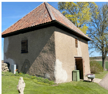
Kyrkboden från 1600-talet har varit spannmålsmagasin, bårhus och materialbod. "Sockenmagasinet" är benämningen idag.

Edward Nonnen dog i mars 1862 och begravdes på Rackeby kyrkogård. 1914 restes en tre meter hög minnesvård av granit vid graven.