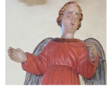
◀ Predikstolens färger fick vara vägledande vid den senaste renoveringen 1989-90.

Bevarade delar av de raserade medeltidsvalven på en av innerväggarna (t v) och dopfunten.