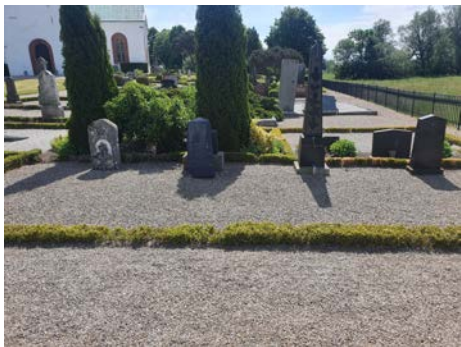
E 77 Fyra äldre stenar. Delvis sent 1800-tal. Sten med avbrutet kors och tre andra varav en obelisk. K