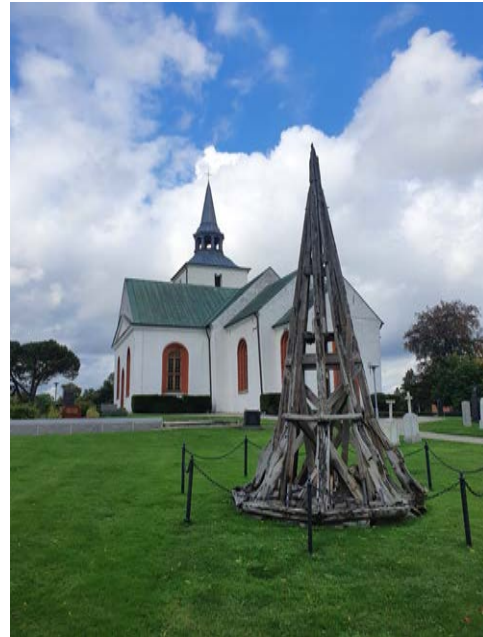
Kvarter B Gamla tornspiran vissa trädetaljer från 1700. Ny tornspira på Reslövs kyrka år 2010