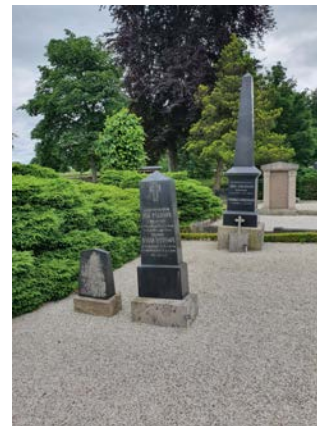
A 2, 4. Jöns Andersson och hustrun Pernilla samt två mindre stenar.