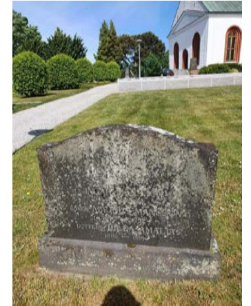
B 86 Ensam gravsten i grasmattan i sydöstra hörnet i kvarteret B. Gammal gravsten i grå granit från tidigt 1920- talet. Familjegrav. Återlämnad (B)