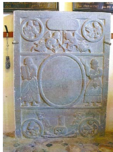
Gravsten i Vapenhuset