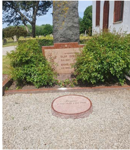
B 10 - 11 Nyare gravsten Byggmästare Olof Svensson o.h.h. Olof Svensson var en flitigt nyttjad byggmästare till pastoratet på 1940–50 talet. Privat (B)