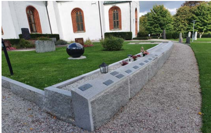
Askgravplats i kvarteret B. Anlagd 2013