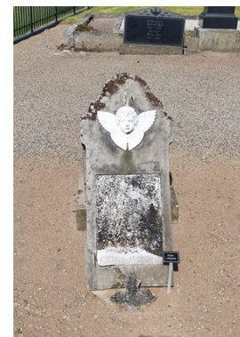
E 70 Sten med vit ängel i marmor och vit marmorplatta. Oläslig text, Söndrig. K.