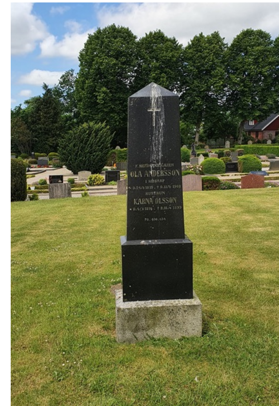
Två gravstenar på gräsmattan framför kyrkan. F 105. Enkel men vacker obelisk i svart diabas från förra sekelskiftet. Liggande sten med ett infällt kors, oläslig text