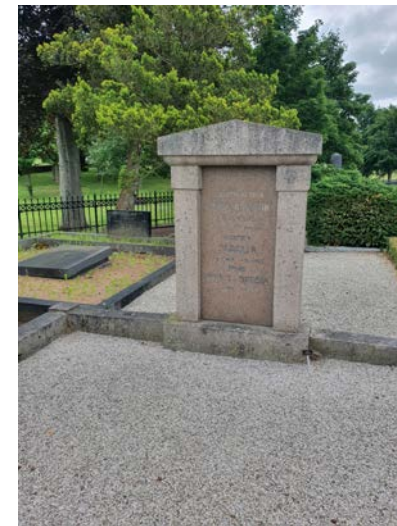
A 8. Lantbrukare Jöns Jönsson och hustrun Pernilla. Ovanlig granitsten med pelare och tympanonfält. K.