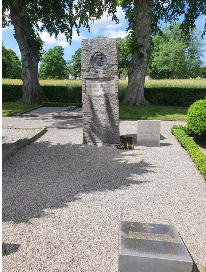
I 160. Kontoristen Per Emil Retzlow. Stor granitsten med en medaljong av Per Emil Retzlow själv. Till graven hör ytterligare tre stenar.