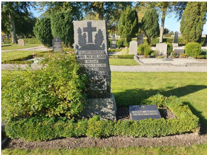
L 121. Lantbrukaren Jöns Mickelsson m. hustru. Rikt ornamenterad 1800- tals sten