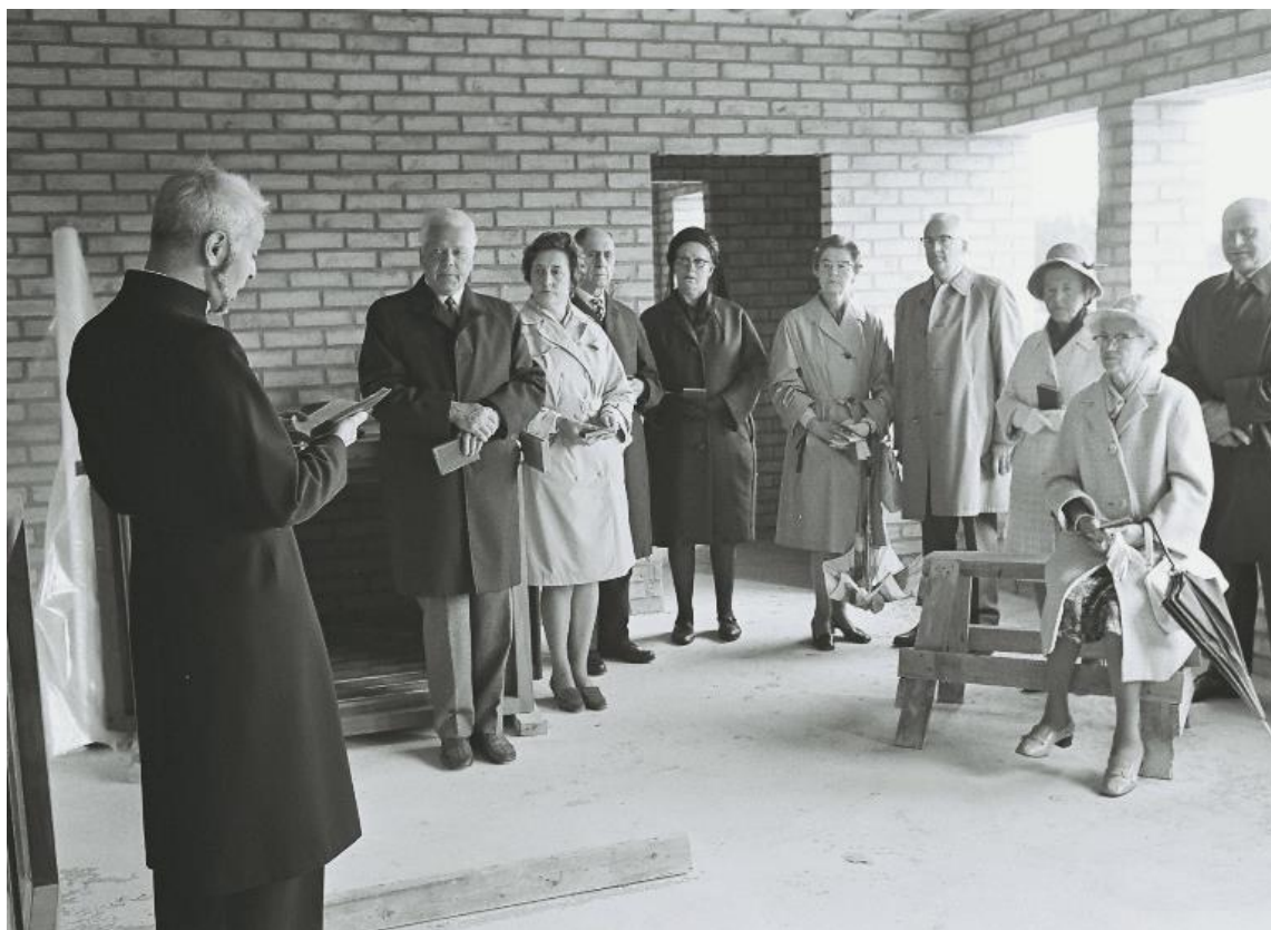
12 juli 1970 - Första gudstjänsten i församlingsgården.

På 1950-talet gjordes på uppdrag av biskop Elis Malmeström en utredning om var i stiftet det fanns behov av en småkyrka. Bland annat nämndes Ekenässjön med stor folkmängd och långt till kyrkan i Vetlanda. År 1955 föreslog Sven Westberg att kyrkorådet skulle utreda möjligheten att bygga en småkyrka i Ekenässjön. En småkyrkokommitté utsågs. År 1965 inköptes samhällets vackraste tomt och arkitekt Per Rudenstam från Jönköping anlätades att göra ritningar till kyrka och församlingsgård. På platsen där kyrkan skulle stå satte man upp ett enkelt kors av björk och gudstjänster hölls där under sommartid, den första i maj 1965. I november 1969 kom byggnadstillståndet för församlingsgården och klockstapeln. Huvudentreprenör var Ekenäs Byggnads AB och markarbetena utfördes av Firma Schakt AB, Jönköping.