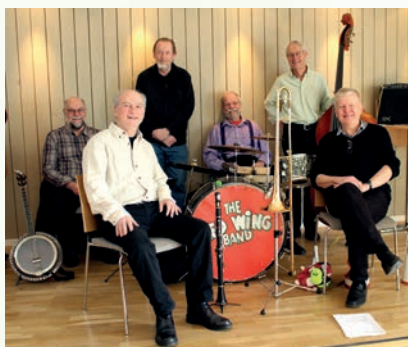
9 juni 20.00 - Lagmansereds kyrka Tradjazz i New Orleansanda Red Wing Band