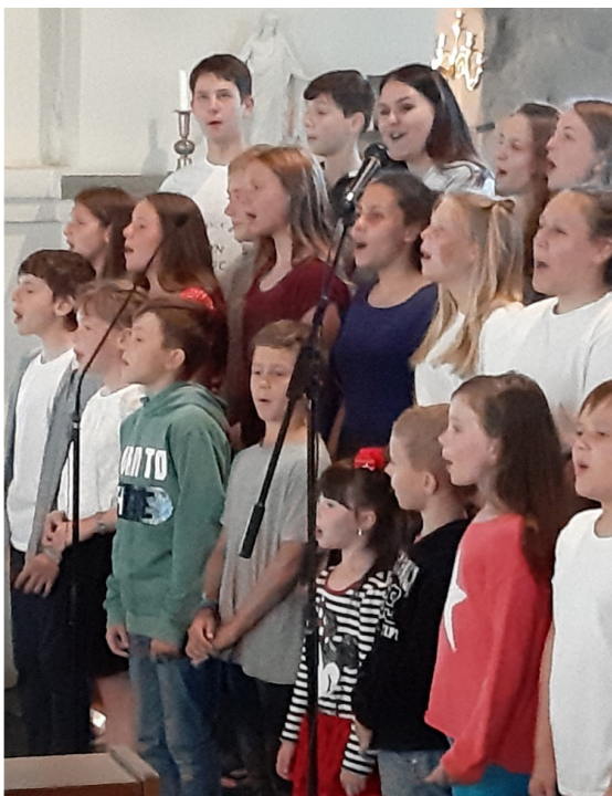
23 juli 2019 – Ukrainabarnen i Strövelstorps kyrka

Först kom pandemin. Sedan kom kriget. Det är tre år sedan vi senast kunde möta och lyssna på "ukrainabarnen" i Strövelstorps kyrka.