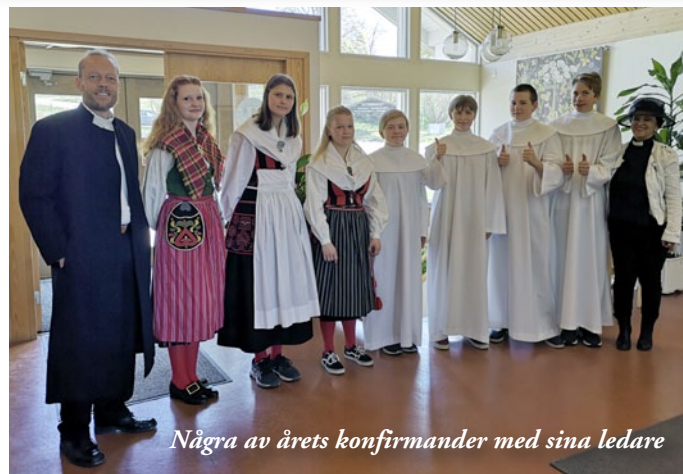
Några av årets konfirmander med sina ledare

Från 12 juni till i höst finns utställningen i bakre delen av Bjursås kyrka. Kyrkan är öppen dagtid och alla är välkomna att ta del av utställningen, tända ett ljus och varför inte passa på att besöka Lillkyrkan, rummet bakom altaret, som är omgjort. Där finns även barnaltarskåpet som är en lekkyrka för barn.