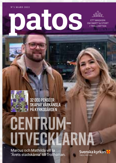
Så här såg det 26:e numret av Patos ut. Nu håller du i nummer 27.