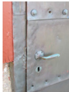
Flera kopparnitar är stulna från dörren till kyrkans sakristia.

Kyrkans försäkring 021 – 17 85 25, 021 – 17 85 27 info@kyrkansforsakring.se