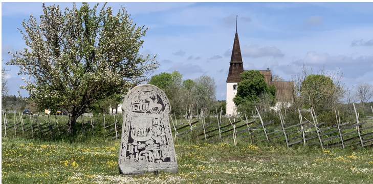
Ardrestenen, kopia från 1999 av originalet som påträffades i kyrkans golv hundra år tidigare.