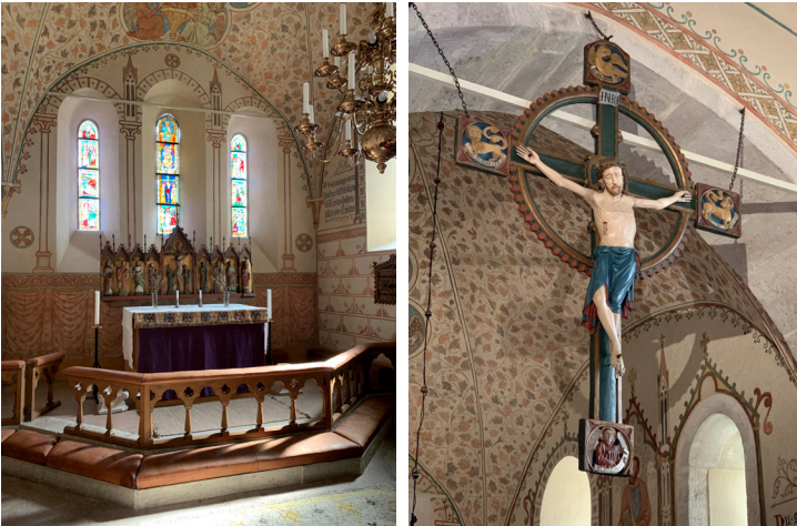
Av kyrkans glasmålningar är tre från 1300-talet, de andra från 1900-02. Retablet på altaret är från 1300-talet och triumfkrucifixet från 1200-talets mitt, ommålat senast 1900-02 av Johan Gardelin.

Snart skedde vissa moderniseringar. Långhusets sydfasad var från början enklare med mindre portal och fönster. Vid 1200-talets slut flyttades gamla långhusportalen till norra sidan och en praktfull portal sattes in. De stora måtten talar nästan för att den var tänkt för en annan kyrka men den