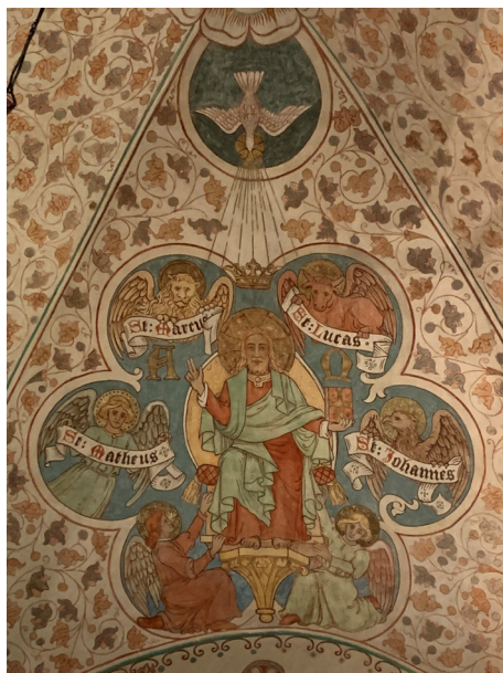
Korvalvets målningar med Jesus Kristus, äng- lar, Evangelisterna och Den Heliga Ande.