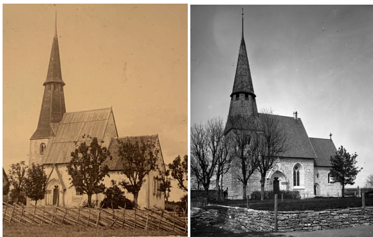
Kyrkans yttre före och efter restaureringen 1900-02. Tornspiran var tidigare högre och det tegeltäckta kortaket lägre, men vid restaureringen frilades murverket och taken täcktes av spån.

I detta läge växte planerna på en omfattande restaurering fram. 1800-talets senare del var en tid då det fanns en förkärlek för perfektionism och gedigna byggnadskonstruktioner samtidigt som intresset ökat för den medeltida arkitekturen vilket gjort de gotländska kyrkorna till en restaureringsfråga för kulturvårdare även utanför Gotland. Tre drivkrafter bakom restaureringen blev att laga det som var trasigt, säkra byggnadens fortbestånd och att ärerädda den, som man uppfattade, missköta medeltidsbyggnaden. Att Carl Georg Brunius i den enda tryckta bok som nämnde kyrkan skrivit att 1700-talsfönstret vid altaret skulle "illa anstå en bondstuga" gjorde inte saken bättre. Mitt emot såg han "en illa upptagen ingång till en dålig nybyggd