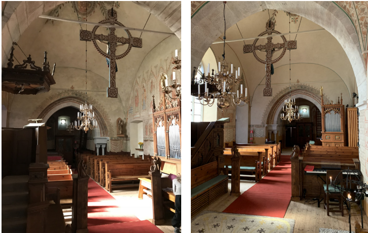
Kyrkorummet mot väster före och efter restaureringen 2020-21. Putsytorna har tvättats rena och orgeln flyttats till rummets västra del.

Kyrkorummet kom att behålla sekelskifteskaraktären, även i en tid när den blev omodern och motsvarande interiörer kunde målas över i vitt på många håll på fastlandet vid senare restaureringar. Endast små förändringar skedde. Kaminen ersattes av modernare uppvärmning och på dess plats sattes den konserverade Madonnaskulpturen. År 1973-75 genomfördes en yttre restaurering. Cementfogarna hade