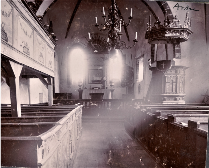
Interiör mot öster före restaureringen 1900-02 med bänkinredning från 1600-talet, läktare från 1700-talets slut, altaruspsats från 1839 och valvmålningar från 1801. 1600-talspredikstolen finns ännu kvar.

ljus genom fönstren. 1860 förstorades långhusets fönster, men dess poster och masverk i kalksten tillkom 1900-02. En äldre exteriörbild visar hur kortaket sänkts när det täcktes med tegel, medan tornspiran var högre än nu, med klockan placerad så högt upp det gick utan att slå i för att den skulle höras till socknens bortre delar. Men bilderna visar även hur det sviktande golvet fått bänkraderna att gå i vågor medan spiran börjat luta betänkligt, även om fotografen ställt sig så att det inte riktigt syns.