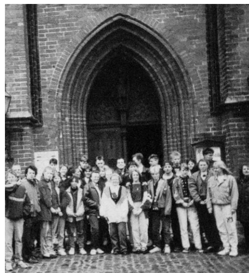
Kyrkråttor från Filipstad församlade på sin resa till östra Tyskland.

Filipstads pastorat och Karlstads stift hade många vänner i Mecklenburger Kirchenkreis utanför Rostock varför resan gick just dit. Ungdomarna gjorde besök i bland annat Tessin och byn Vilz, där de bodde i prästgårdar och träffade andra kyrkligt aktiva ungdomar. Ett besök i klostertaden Bad Doberan gjordes en av dagarna, och det blev grillkvällar med sång och musik vid lägerelden. Lite tid för shopping inne i Rostock hanns också med och sista kvällen tillbringade ungdomarna i Bentwisch, där det blev samspråk med tyska ungdomar om musik, politik, mode, sport och religion.