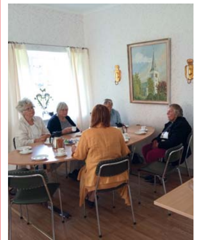
Kaffestugan i Nykroppa har öppnat igen efter sommaruppehållet.