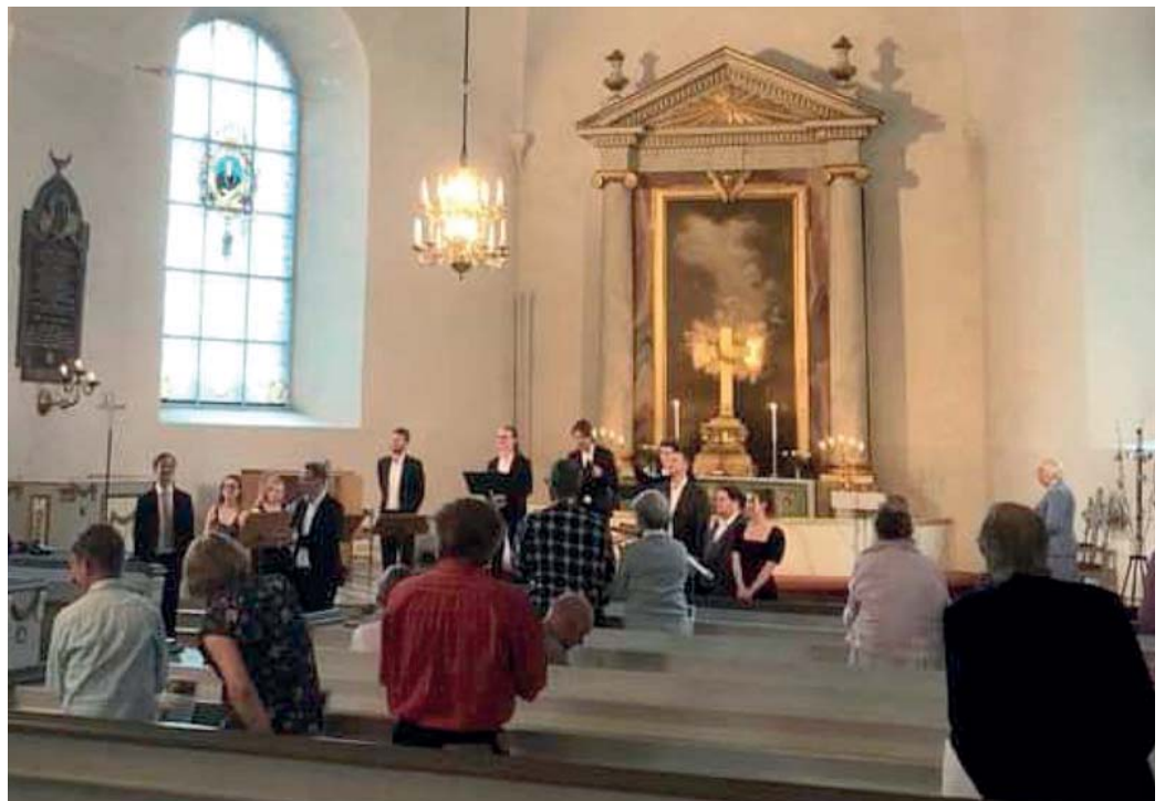
Långväga finbesök i Filipstads kyrka. Cantores Amicitiae, en vokalensemble från Storbritannien, turnerade i Sverige med bara några få stopp på vägen och Filipstads församling föräddades alltså ett besök. Det kunde bara bli stående ovationer i kyrkan.

En ganska normal musiksommar i församlingen, äntligen. Och även det till stor glädje för oss alla.