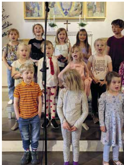
Musiklekis vid ett framträdande i Gustavsbergs kyrka.