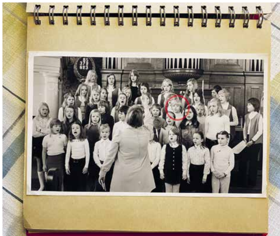
Körerna Ung ton och Unga röster i Sundsvall 1973. Den inringade textförfattaren verkar något frånvarande, ser han kanske något på läktaren?