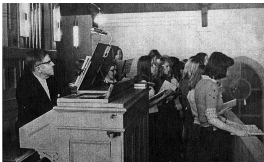
Körsång i Gustavsbergs kyrka 1973.

Information om körerna i Gustavsberg-Ingarö församling hittar du på sid 13.