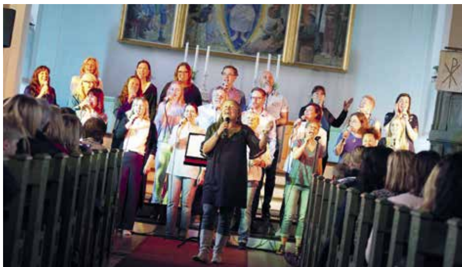
Gustavsbergs Gospel ger konsert söndag 25 september tillsammans med Lidingö Gospel. Välkommen att ta del av höstens musikupplevelser i Gustavsberg-Ingarö församling.