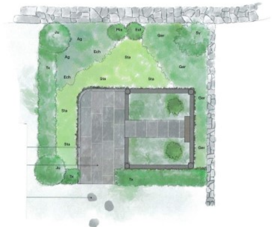
Ritning 2: Förslag utökning Askgravlund, Torp kyrka

Ove Magnusson Kyrkogårds- och fastighetschef