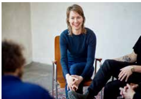
I gruppen bearbetar alla en specifik utmaning eller längtan i sitt eget liv.