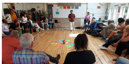
Workshop Community organising.