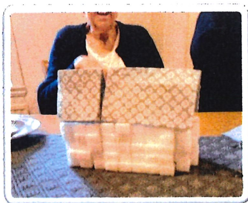
Här bygger vi kyrka tillsammans

Att väcka nyfikenhet hos människor kan leda till bra saker och intressanta samtal. Att möta människor där de befinner sig i livet, vilket vi som kyrka gör i de olika verksamheterna. Här finns en möjlighet att se och höra vad människor längtar efter och vad som människor önskar att kyrkan kan bidra med. Sedan skall det även nämnas att vara aktiv på nätet är nästan det viktigaste idag.