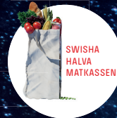
SWISHA HALVA MATKASSEN