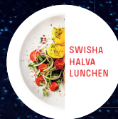
SWISHA HALVA LUNCHEN