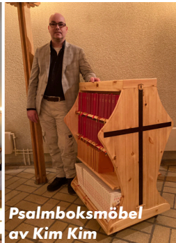
Psalmboksmöbel av Kim Kim