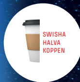
SWISHA HALVA KOPPEN