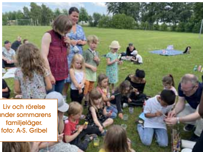
Liv och rörelse under sommarens familjeläger.