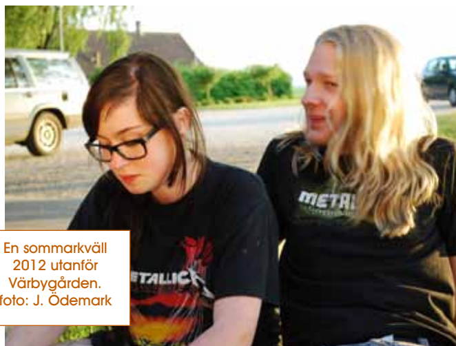
En sommarkväll 2012 utanför Värbygården.