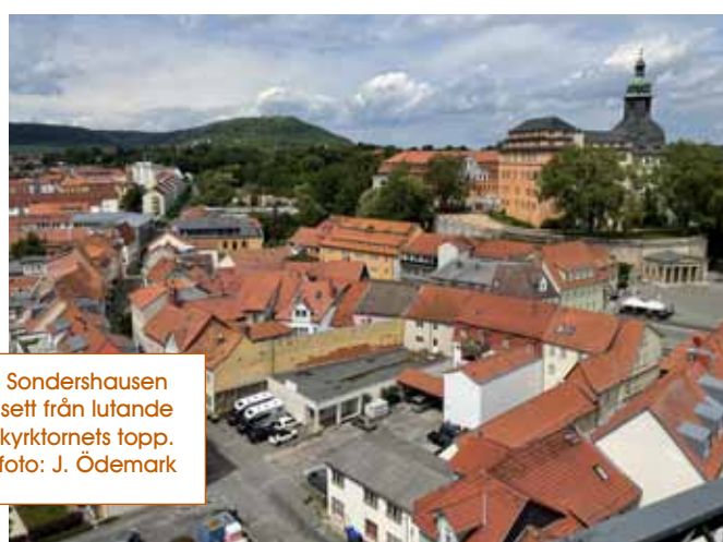
Sondershausen sett från lutande kyrktornets topp.