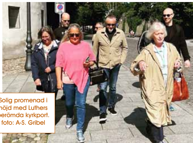
Solig promenad i höjd med Luthers berömda kyrkport.