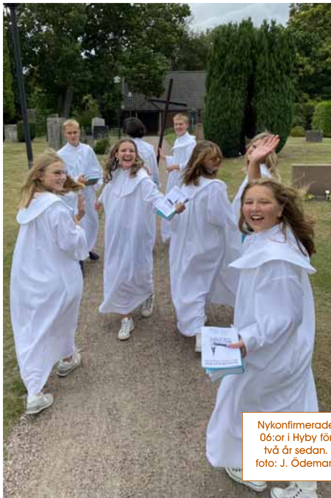
Nykonfirmerade 06:or i Hyby för två år sedan.