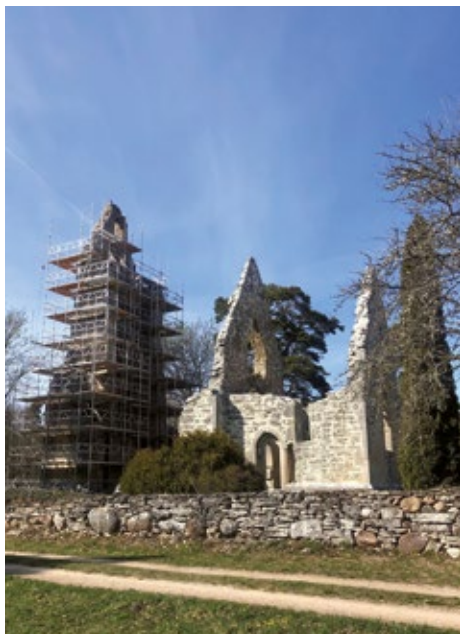
Bara ödekyrka.

Nu bör ödekyrkan klara sig närmare femtio år till nästa renovering. Roland hittade nämligen signaturer från förra renoveringen uppe i tornet. Den var 1974.