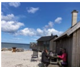
Utflykten till Rommunds fårgård och Baju.