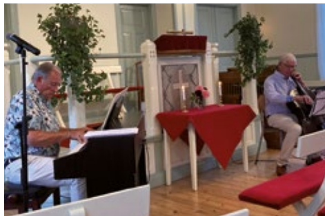
Musik för själ och hjärta, Elimkapellet.