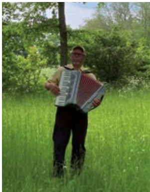
Vårutflykten i Mangsarveänget