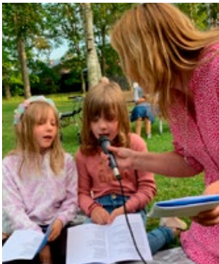
Allsången i parken i Roma.

Här kommer lite bilder från pastoratets aktiviteter under våren och sommaren.