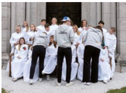
Våra Unga ledare hjälper konfirmanderna inför årets fotografering.

UNGA LEDARE Vi kommer att ha en första träff den 7 september .