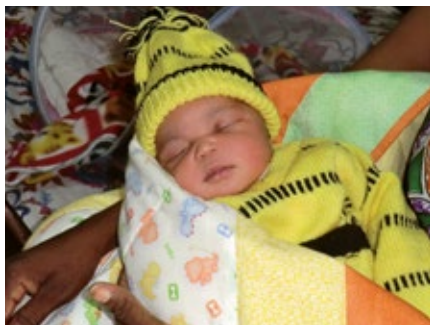
Ge för livet ger nyfödda barn i Centralafrikanska republiken en god start.

Du kan också ge en gåva genom att swisha till 1234599981 (skriv: "Ge för livet") eller genom att använda Elims bankgiro: 793-9283 (skriv: "Ge för livet"). Din gåva, liten eller stor, behövs!