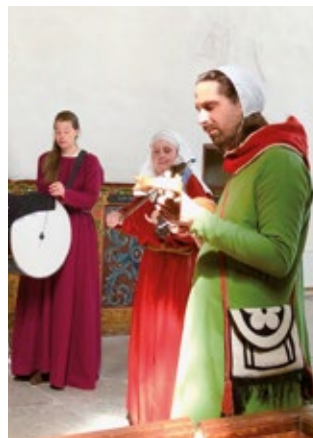
Medeltidsbandet Själ, Gammeltorns kyrka.