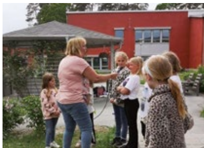
Barnen sjunger sommarsånger på Roma äldreboende.