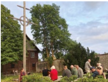
Ekumenisk andakt, Borgviks gårdskors.