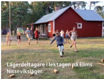
Lägerdeltagare i lektagen på Elims Nisseviksläger.