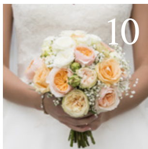
10 En gemenskap utifrån tro får positiva konsekvenser för livet