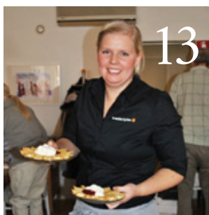
13 Att söka sig till kyrkan både när livet är svårt och när livet är lätt