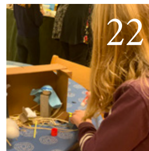
22 Vi måste som kyrka våga stå upp för barnens rätt