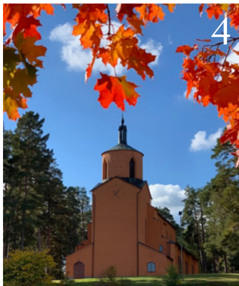
4 Vi i Svenska kyrkan i Tranås

40 Användning och spridning av församlingsinstruktionen