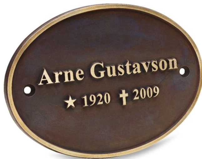
Exempel på gjuten namnplatta i brons