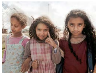
Många bryr sig om världens flickor.