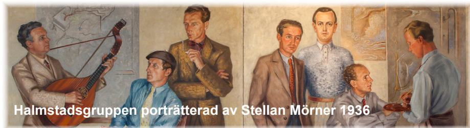
Halmstadgruppen porträtterad av Stellan Mörner 1936